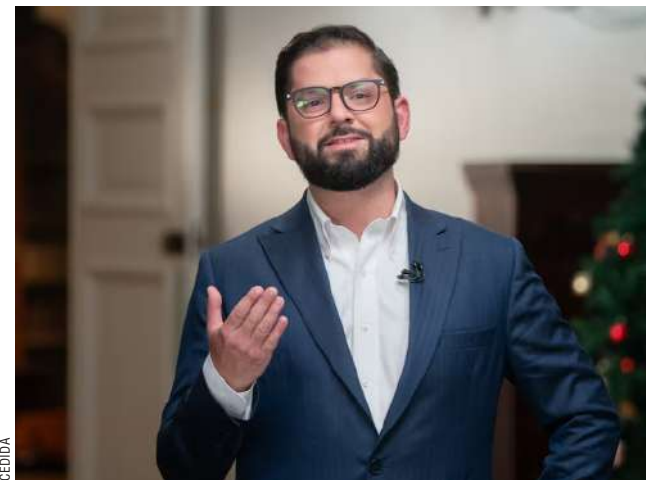
Presidente Gabriel Boric, envió mensaje al país de Año Nuevo.

Como ya lo ha señalado en otras oportunidades, el Presidente apuntó que el país “tiene enormes potenciales y talentos. Y la mejor forma de aprovecharlos es trabajando juntos para que la riqueza y los bienes que se producen en nuestro territorio lleguen a toda la comunidad,