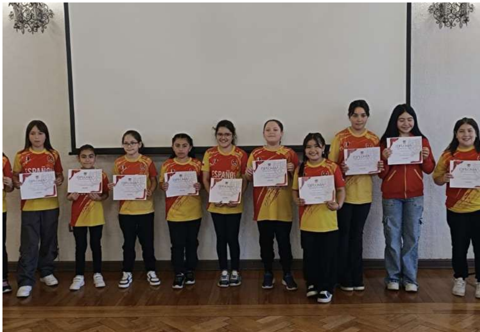
Serie Pre Mini.