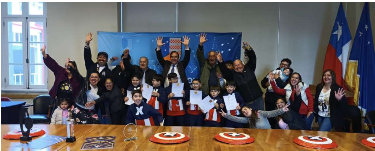
Los jóvenes junto al gobernador y los consejeros regionales en el hito de reconocimiento local.

“Ese era el primer objetivo: llegar allá y que los niños pudieran estar en un escenario Sudamericano o fuera de la región, y la verdad es que los chicos se comieron el escenario: el jurado y el público quedaron fascinados y ahí