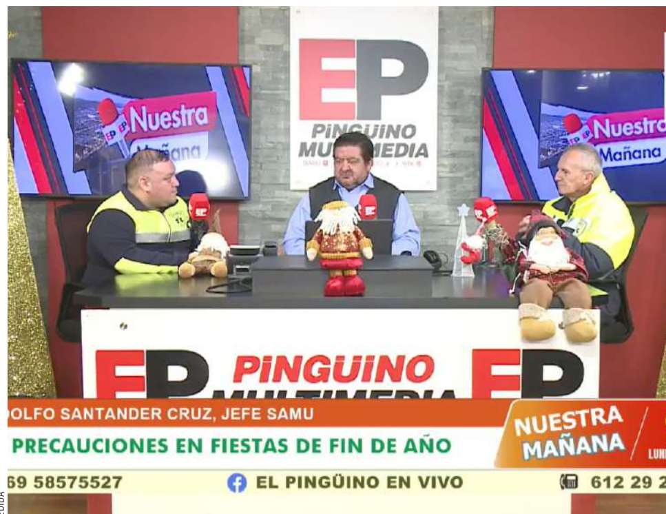
Miembros del SAMU durante el Matinal de Pinguino Multimedia.

En plena temporada de celebraciones, el SAMU de Punta Arenas llama a donar sangre ante el aumento de emergencias