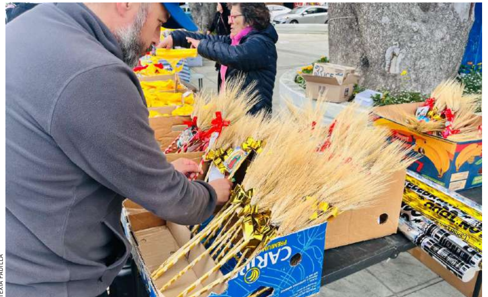
Entre el cotillón y los encuentros familiares, Punta Arenas le abrió las puertas al 2026.

Punta Arenas recibió el 2026 con entusiasmo desbordante. Entre cábalas, alegría y abrazos que cruzaron fron-