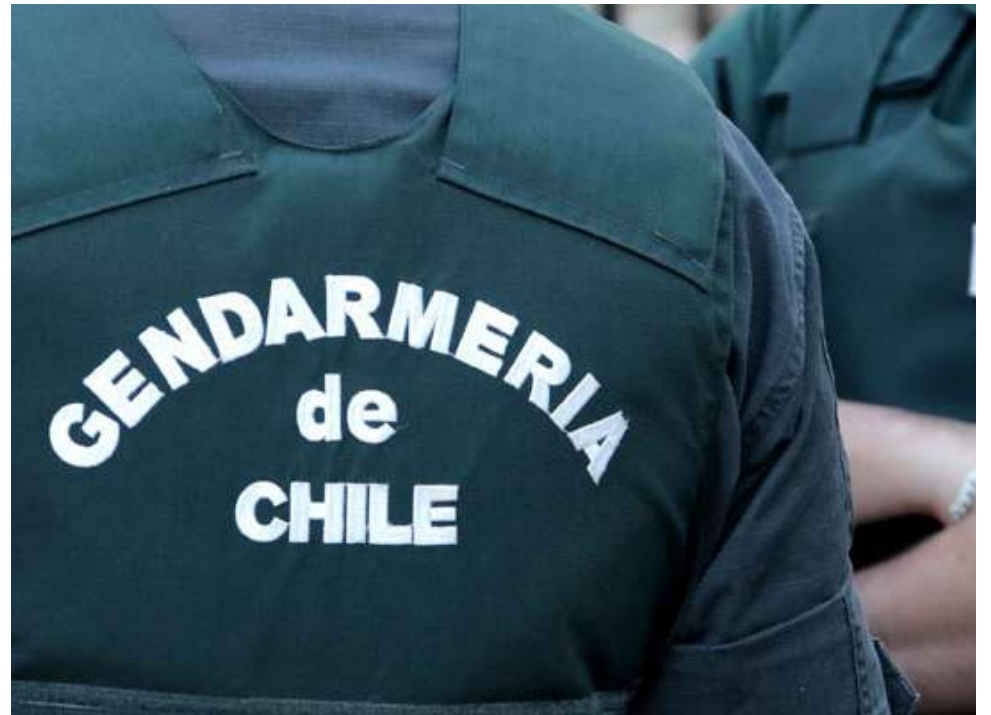
El ajuste -se explicó- se hizo resguardando la continuidad de los servicios esenciales, especialmente aquellos vinculados a la atención directa de personas.

Desde el Ejecutivo han insistido en que estas medidas responden a un escenario de estrechez fiscal y a la necesidad de ordenar las finanzas públicas, evitando comprometer áreas sensibles como el sistema penitenciario, la identificación civil y la defensa penal. En esa línea, el ministerio enfatizó que el ajuste corresponde a una redistribución interna que busca mantener la operatividad del sistema sin afectar su funcionamiento esencial.