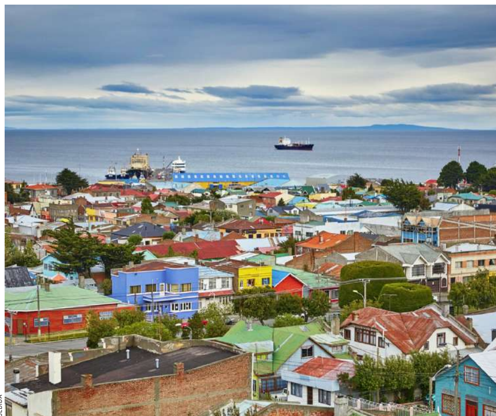
Punta Arenas, capital de la Región de Magallanes y de la Antártica Chilena.

Radonich recaló que el municipio opera con un presupuesto austero, sin variaciones significativas y con escasa inversión priva-