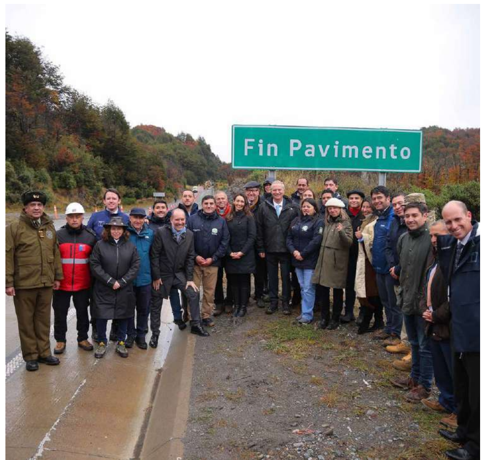
Kast dio a conocer millonaria inversión para intervenir un total de 244 km, mediante conectividad vial, marítima y lacustre.

Adicionalmente, se proyecta el reinicio de la construcción de los nuevos puentes Palena y Rosselot,