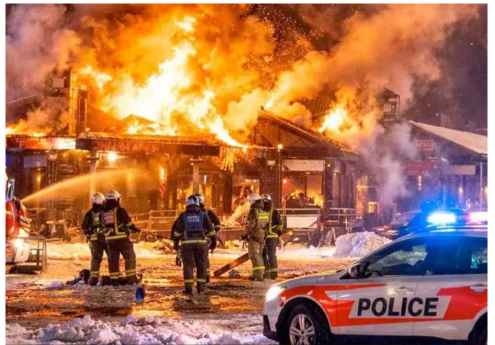
El incendio ocurrió en el bar Le Constellation de Crans-Montana, un local frecuentado por turistas.

Las autoridades creen que hay muchos extranjeros entre las víctimas, pero aún no han facilitado