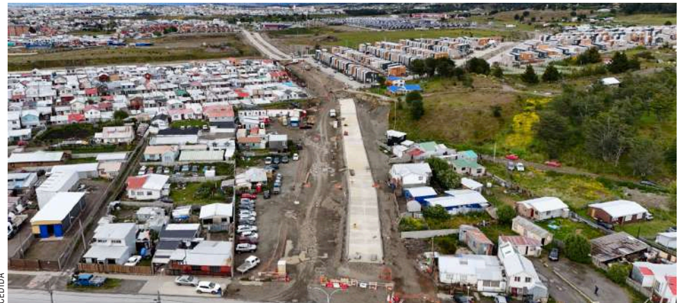
Sigue avanzando el proyecto de la Avenida Circunvalación Ramón Cañas Montalva.

La ejecución está a cargo de la empresa Salfa S.A.,