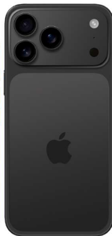
iPhone 17 Pro Max