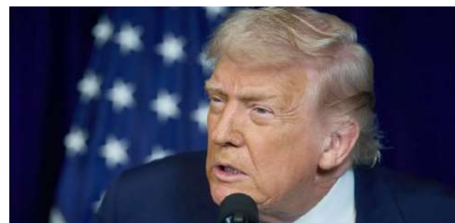
Trump lanzó una dura advertencia a Irán.

Las protestas, que comenzaron el domingo en Teherán, se