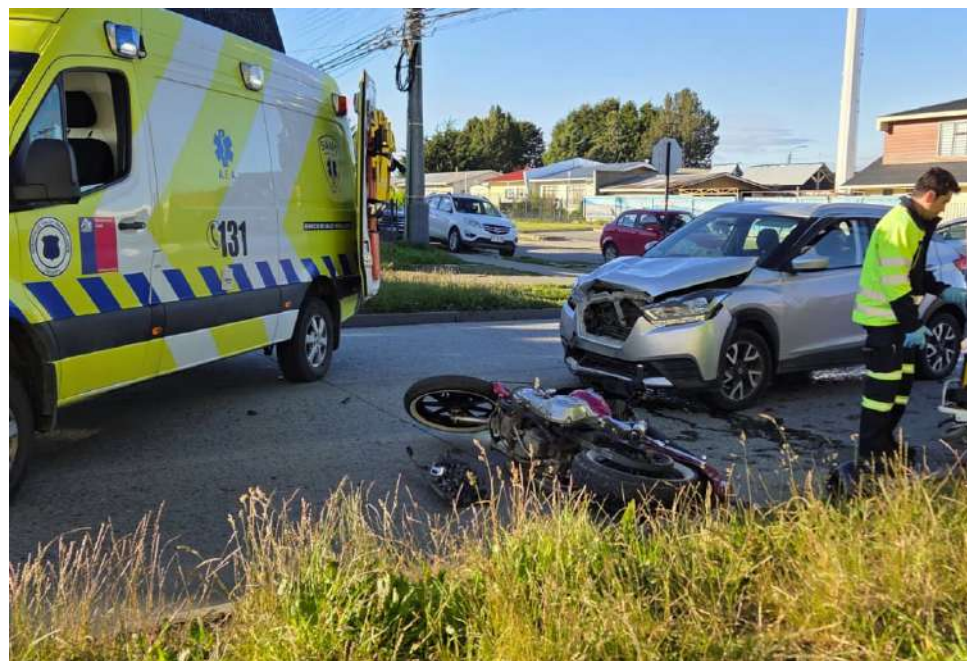
Producto de la colisión, el motociclista salió proyectado y resultó con diversas lesiones.

Desde las autoridades se reiteró el llamado a la conducción responsable y al respeto irrestricto de las señales de tránsito, especialmente en cruces regulados, recordando que la omisión de estas normas continúa siendo una de las principales causas de accidentes viales, particularmente aquellos que involucran a motociclistas en la capital regional.