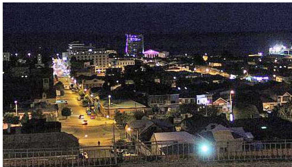
El comportamiento de la ciudadanía fue destacado por las autoridades locales en la capital regional.

Finalmente, se informó que las 4 fiestas masivas autorizadas se desarrollaron sin inconvenientes. Seguridad