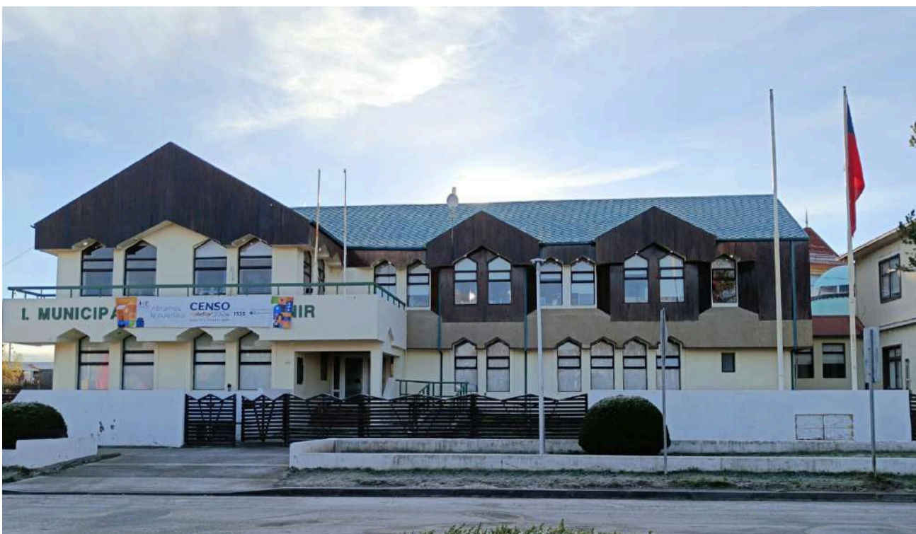
El municipio ha trabajado fuertemente en la digitalización y modernización.