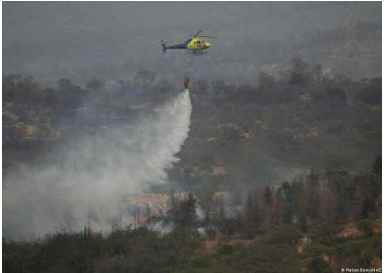
El uso de pirotecnia irregular marcó negativamente las celebraciones de Año Nuevo en la provincia de Chiloé.

La distribuidora eléctrica además explicó que la desconexión se inició a las 00:05 horas, afectando inicialmente a 9.500 clientes. A las 00:17 horas, gracias a maniobras realizadas en