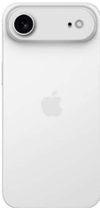
iPhone 17 Air