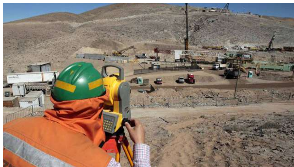
La Contraloría alerta sobre un riesgo crítico en la supervisión de la actividad extractiva en Chile.

Adicionalmente, el organismo encabezado por Dorothy Pérez detectó una distribución desigual de la carga laboral entre los fiscalizadores. Durante el período analizado, 105 funcionarios realizaron inspecciones, con diferencias significativas en la cantidad de controles efectuados por cada uno, lo que