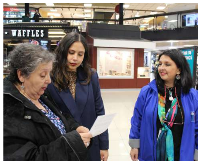
Constantemente el Registro Civil realiza campañas en terreno, además del trabajo propio en las oficinas.