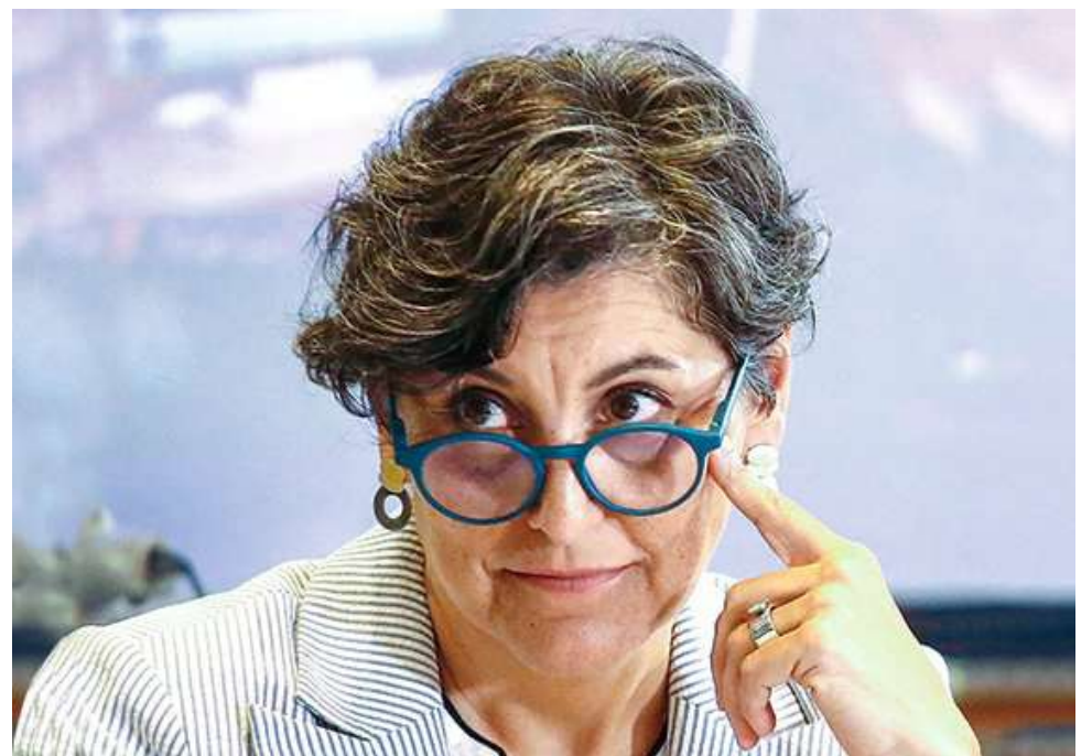
El deceso ocurrió “en un contexto de deterioro general asociado a sus antecedentes y la gravedad de su cuadro clínico”, señaló la dirección de El Salvador en un comunicado.

El centro de salud también confirmó que ya se encuentra colaborando con los organismos fiscalizadores. “A la fecha, hemos recibido un requerimiento de la Contraloría General de la República sobre este caso, el cual será atendido conforme a los procedimientos establecidos”, sostuvo el texto, subrayando que el hospital entregará “la información solicitada a las instancias competentes, resguardando en todo momento la protección de la confidencialidad de los datos personales y clínicos de nuestros pacientes”.