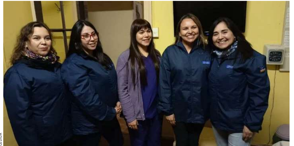
La Fundación Chay Austral ha sufrido varios traspiés desde que asumió la responsabilidad de la residencia.

diciembre. Toda esa información tenemos que hacerla llegar a la plataforma. Luego de eso, cuando ya la información esté en la plataforma, vamos a poder recibir los fondos que corresponden a Senama”, explicó la directora Sandoval.