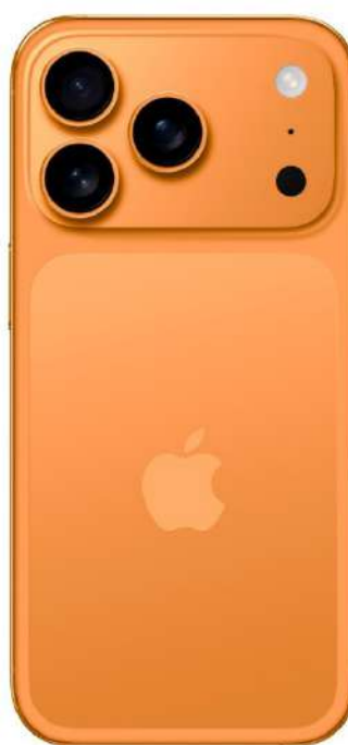
iPhone 17 Pro