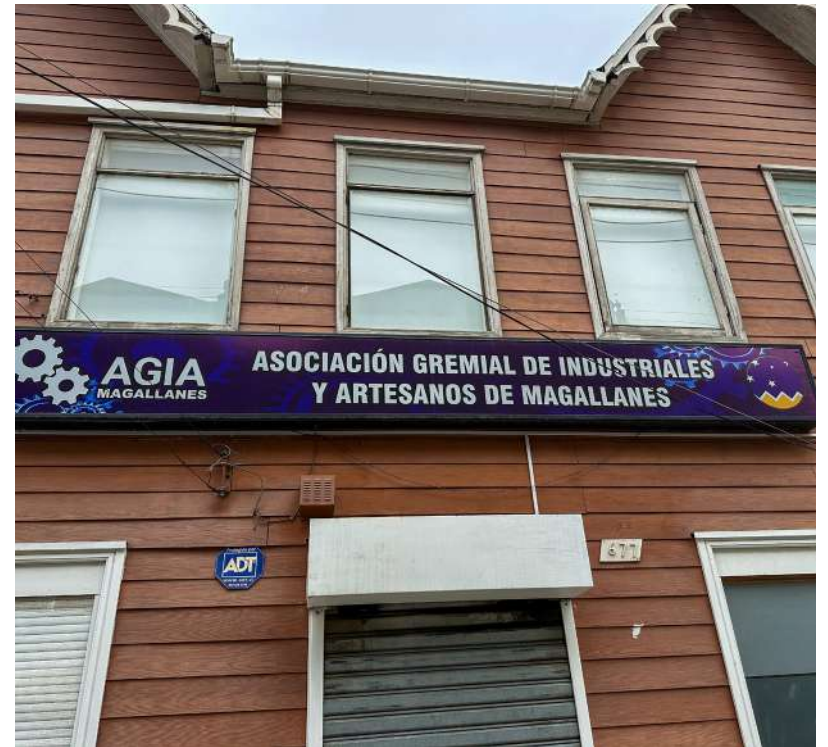
Oficinas de AGIA, ubicadas en calle Sarmiento 677.

Quienes deseen más información pueden acercarse a las oficinas de AGIA, ubicadas en calle Sarmiento 677, entre las 9:00 y las 13:00 horas, o escribir al correo electrónico agia.magallanes.2007@gmail.com .