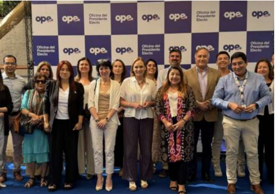
La reunión se llevo a cabo en Santiago.

“Lo más relevante es que aquellos compromisos que se pongan sobre la mesa se cumplan. Hay una buena acogida, lo reconocemos y lo agradecemos”.