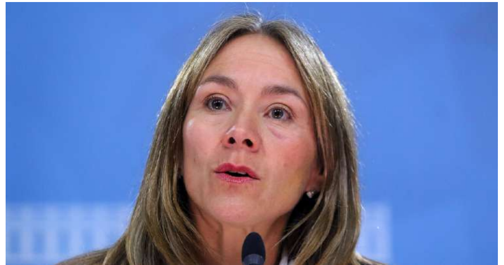
“Buscamos que no aumente la cifra y que abordemos anticipadamente el tema de (el cierre del comercio en) las elecciones”, afirmó.