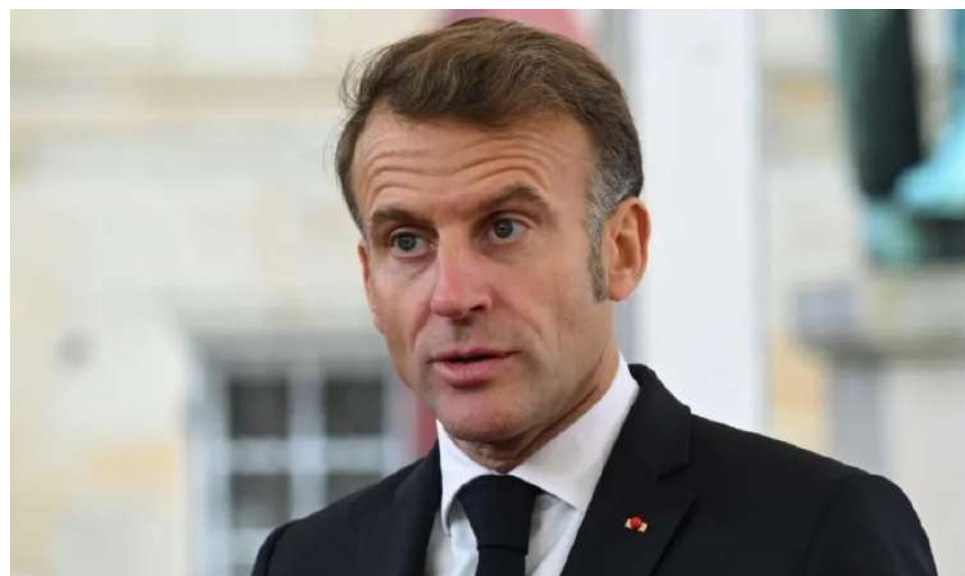
El petróleo sigue disparado por temores de una escalada tras el discurso de Trump.

"No es en absoluto la opción que contemplamos y consideramos que es poco realista", añadió el mandatario francés, que consideró que una operación de este tipo "tomaría un tiempo infinito" y entrañaría "numerosos riesgos".