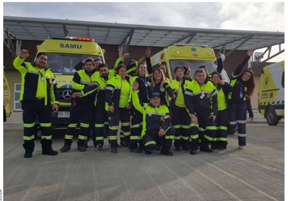
El equipo SAMU mejoraría en próximos días sus condiciones laborales.