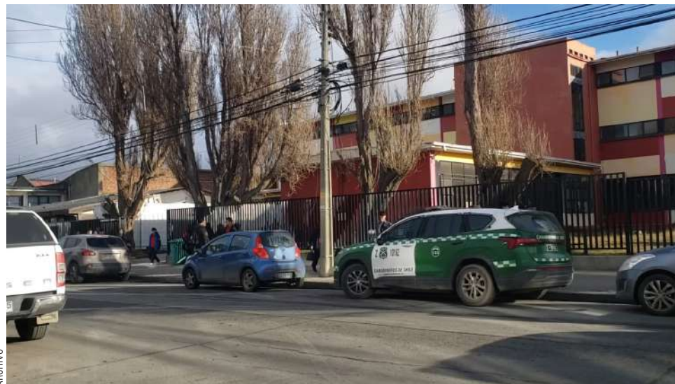
El tribunal acreditó que el ataque ocurrido a la salida del Liceo Lemaitre fue premeditado.

Adicionalmente, la sentencia ordena el comiso y la destrucción definitiva del cuchillo utilizado en la agresión, una vez que el fallo quede firme.