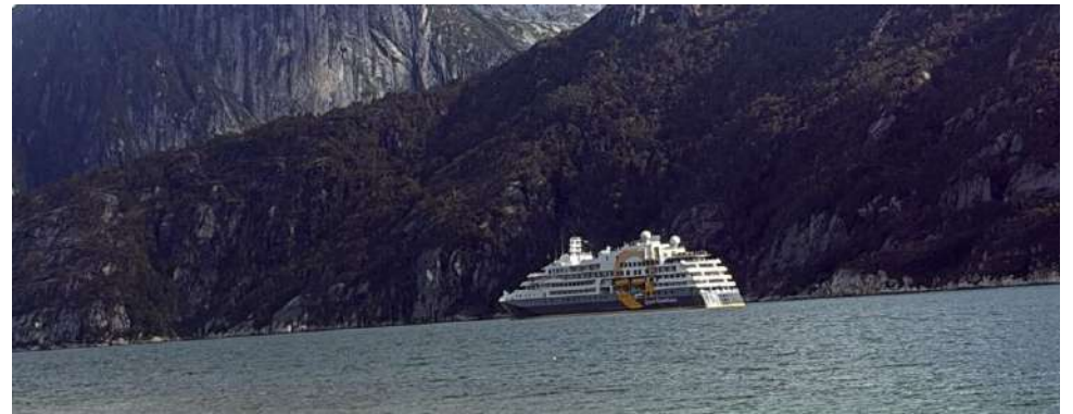
Naves extranjeras surcan fiordos australes sin control, reavivando el debate por el cumplimiento de la ley y protección de la industria marítima nacional.

El debate, en definitiva, vuelve a poner sobre la mesa la necesidad de equilibrar el crecimiento del turismo internacional con el respeto a la normativa y la protección de los intereses regionales.