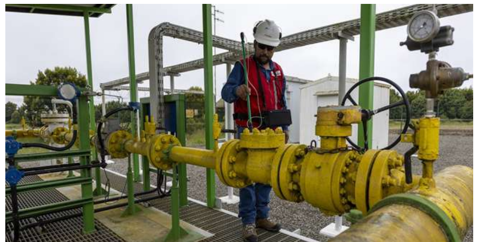
El Ministerio de Energía dijo que el “gas no cuenta con el estándar contratado”.

Por su parte, desde Innergy Soluciones Energéticas indicaron que “siguiendo los protocolos establecidos, este hecho fue informado tanto a las autoridades correspondientes como a los clientes de la compañía. Continuamos monitoreando para mantener informado a sus clientes y a quienes corresponda”.