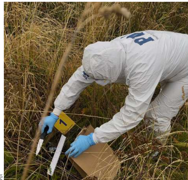
Esta es el arma que recuperaron en el sitio eriazo, ubicado en el sector norte de Punta Arenas.

Con este hallazgo, el ente investigador cuenta con herramientas sólidas para sustentar la acusación contra los dos adolescentes, quienes actualmente cumplen la medida de internación provisoria. Se espera que los informes de laboratorio sobre el arma encontrada se entreguen en los próximos días para ser integrados a la carpeta judicial.