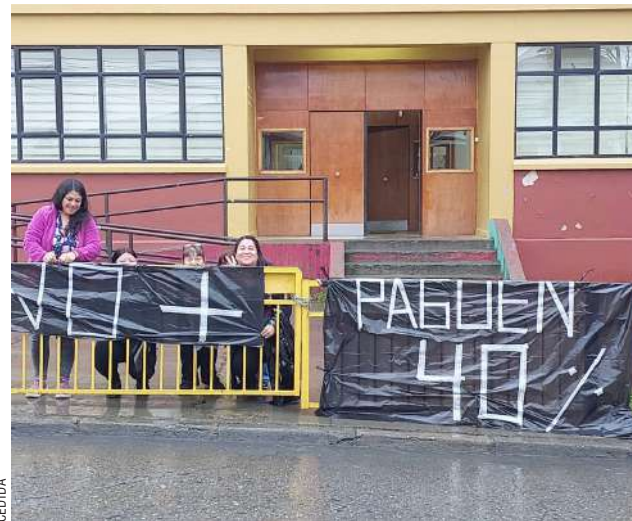
Despliegue de lienzos y carteles en las afueras de los establecimientos educativos.

Esto, explicó, "para que entre ambas instituciones gestionáramos y llegáramos finalmente a la decisión de que este bono se cancelará el día de mañana (hoy) a partir de las 11 horas a todos los asistentes que tengan obviamente el derecho de recibir esta bonificación. Por lo tanto, debo informar de que existió una muy buena disposición de ambas instituciones frente a la petición expresa que hizo esta seremia y hemos llegado a feliz