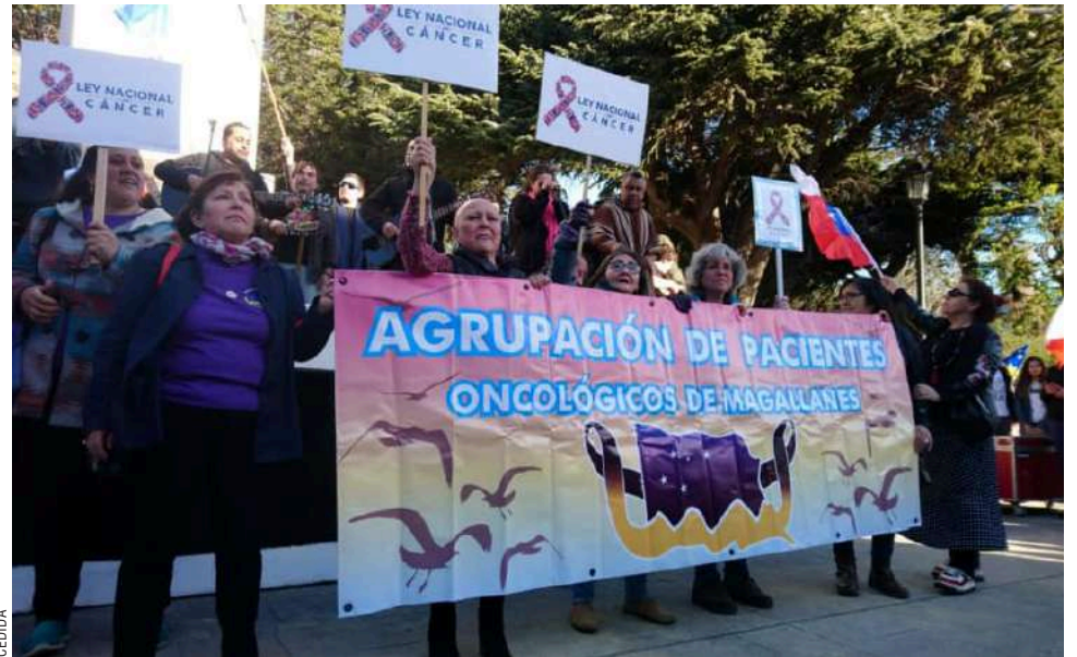
La Agrupación de Pacientes Oncológicos está atenta al Plan de Alerta Oncológica impulsado por el Ministerio de Salud.

Identificación/ validación, contacto/ vinculación, y resolución/ acompañamiento, son las tres fases principales del Plan de Alerta Oncológica.