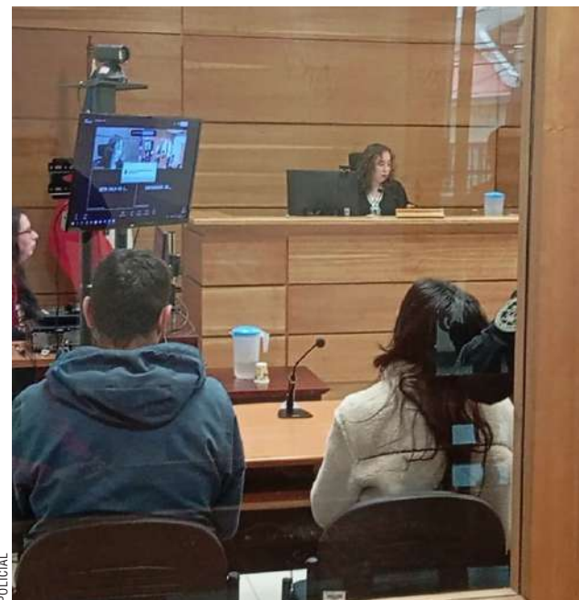
Pese a que la mujer pidió retomar la relación, la justicia priorizó su seguridad ante el historial de violencia del agresor.

Finalmente, se decretó el arraigo regional para la mujer, mientras que para el hombre se impuso el arresto domiciliario nocturno, el arraigo regional y la prohibición absoluta de contacto y acercamiento a la víctima. Adicionalmente, se fijó un plazo de 60 días para el cierre de la investigación, periodo en el que se mantendrá el resguardo obligatorio sobre la afectada.