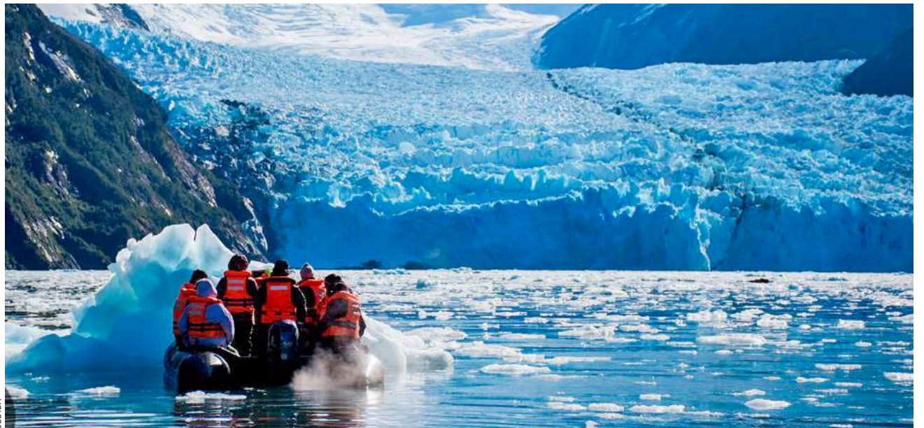
Cruceros y veleros extranjeros están desembarcando pasajeros en áreas silvestres protegidas.

“Esto hay que terminarlo de una vez por todas”,