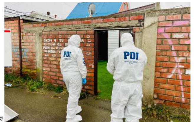
Detectives de la Brigada de Homicidios y peritos del Laboratorio de Criminalística trabajaron en el sitio del suceso.