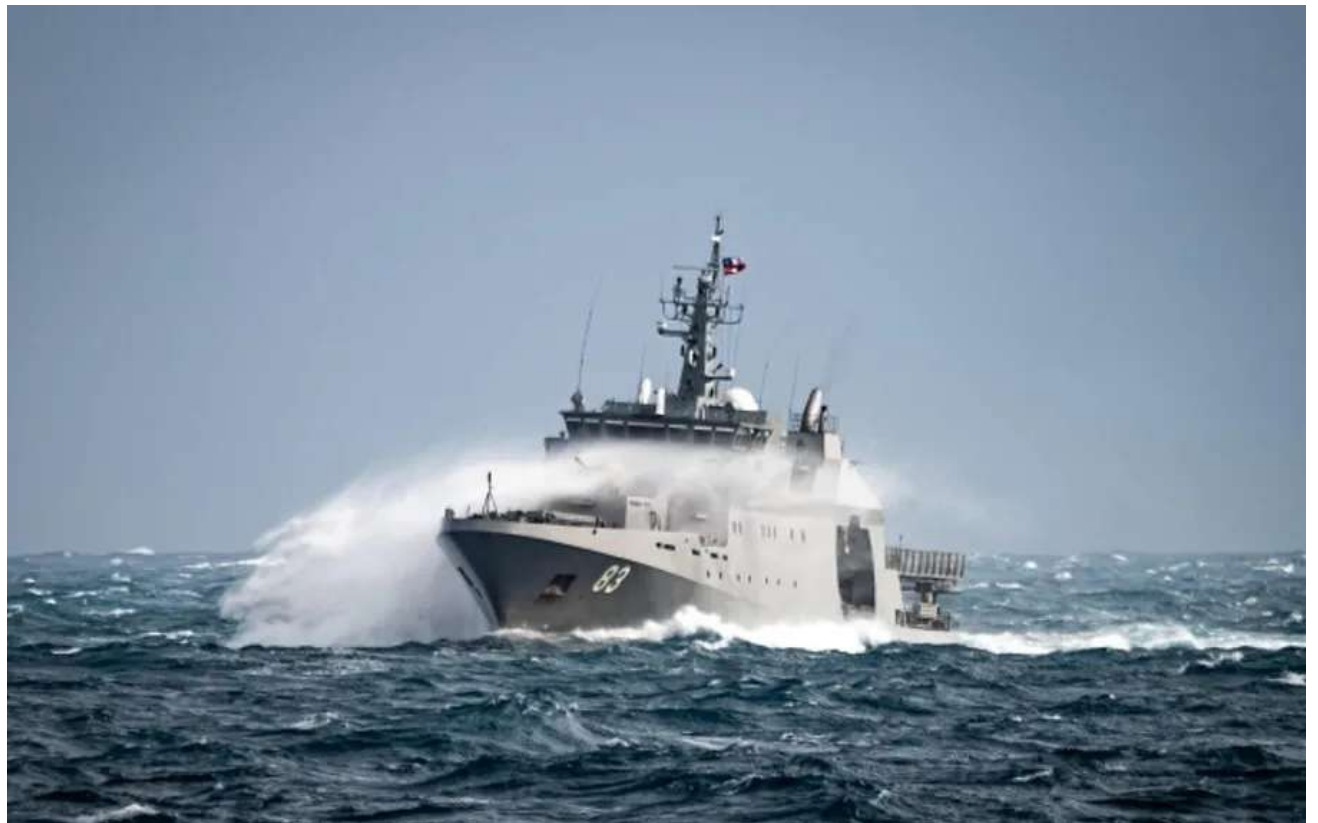
OPV Marinero Fuentealba venciendo el temporal en las aguas del Océano Austral en el Territorio Chileno Antártico.

Si la conciencia marítima requiere conocimiento, presencia y proyección, pocas instituciones encarnan esa triple dimensión con tanta nitidez como el Instituto Antártico Chileno (INACH), con sede preci-