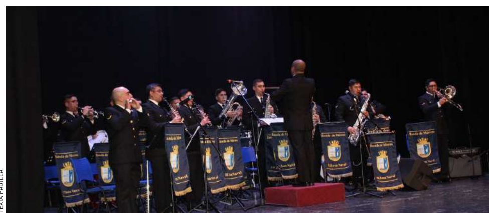
La Tercera Zona Naval abre en mayo una nutrida agenda de actividades abiertas a la comunidad.

Con este evento, la Tercera Zona Naval abre una nutrida agenda de actividades abiertas a la comunidad durante mayo, reafirmando el compromiso de consolidar un Chile verdaderamente marítimo.