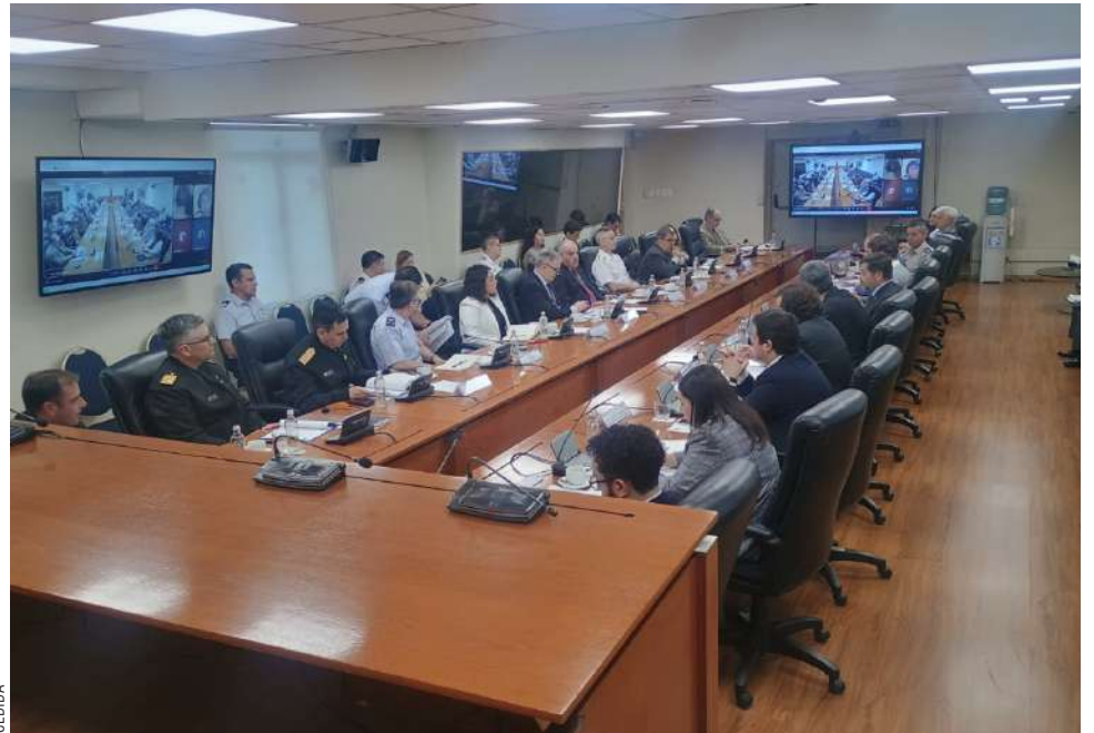
Sexta versión de la Sección Nacional del Sistema del Tratado Antártico (SNSTA).

La participación de la autoridad regional refuerza el rol estratégico de Magallanes en la proyección, presencia y defensa de los intereses de Chile en la Antártica.