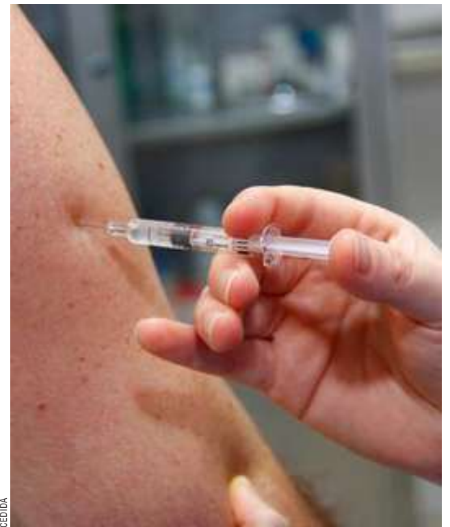
Esta vacuna es parte del Programa PNI del Ministerio de Salud.

Esta vacuna se puede administrar en los centros de atención primaria de Magallanes.