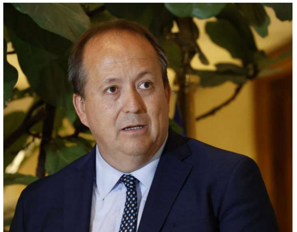
El fiscal nacional, Ángel Valencia, abrió debate tras sus dichos.

Asimismo, llamó a la ciudadanía a denunciar de inmediato cualquier hecho, subrayando que la respuesta oportuna es clave para enfrentar este tipo de amenazas.