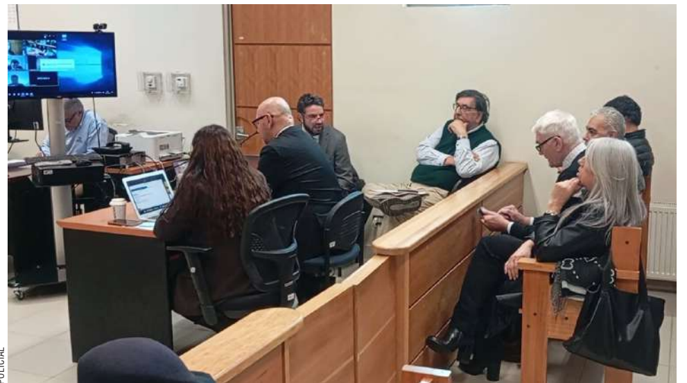
Tras una extensa audiencia, el tribunal acogió el sobreseimiento de cinco eximputados, mientras la defensa de Flies insiste en que podrá probar la intencionalidad de daño de los restantes.

Para ellos, el tribunal rechazó el sobreseimiento debido a que las expresiones vertidas en