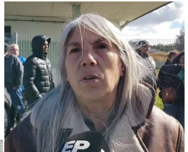
La consejera ha acompañado a los vecinos afectados de la Población Cardenal Raúl Silva Henríquez.

Si bien no es auspiciosa en que la erradicación sea efectiva durante este año, anhela que impere el Estado de Derecho. “Espero que sí