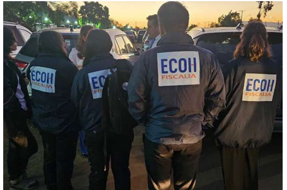
La violencia sigue sin dar tregua, con hechos que se registran y reportan a diario.