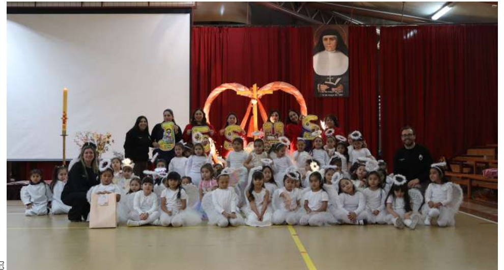
Las estudiantes fueron protagonistas de la celebración de resurrección.

Esta actividad fue organizada por el equipo que conforma el área pastoral del establecimiento que es encabezado por Yasna Loncón, que también consideró tradicionales cánticos