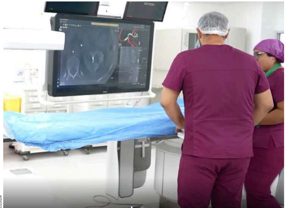
Los profesionales realizaron la capacitación en las comunas de Providencia, Vitacura y Santiago.

Actualmente una segunda enfermera de la clínica se encuentra en Temuco realizando una especialización de seis meses para profundizar conocimientos en el área. Se espera que el equipo se inaugure la próxima semana en Punta Arenas.