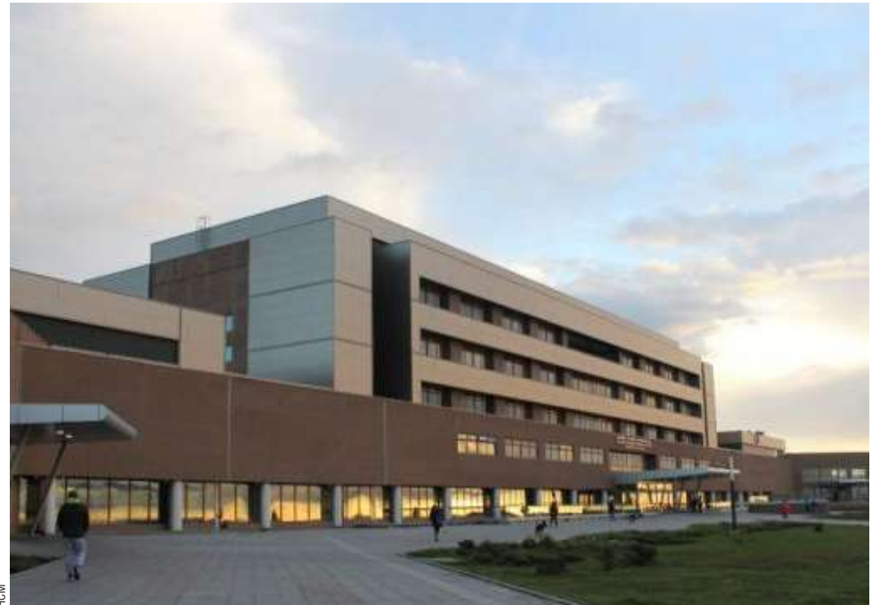
Hasta el Hospital Clínico de Magallanes fue trasladado el afectado luego de la derivación de los doctores de Porvenir.

Hasta el cierre de esta edición, L.C.G. se mantiene prófugo. Las policías han desplegado patrullajes en la zona para dar con su paradero, mientras que los antecedentes ya fueron puestos a disposición de la fiscalía local para tramitar las órdenes de detención correspondientes.