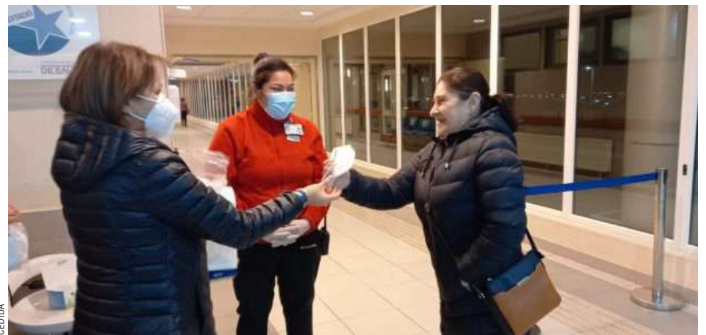
En los servicios de urgencia se aglomera gran cantidad de personas donde aumenta la circulación de virus respiratorios.

“Sabemos que al acercarnos al invierno aumenta la circulación de virus respiratorios, por lo que es fundamental reforzar todas las barreras de protección disponibles. Debemos mantener las medidas de autocuidado ya conocidas, como el lavado frecuente de ma-