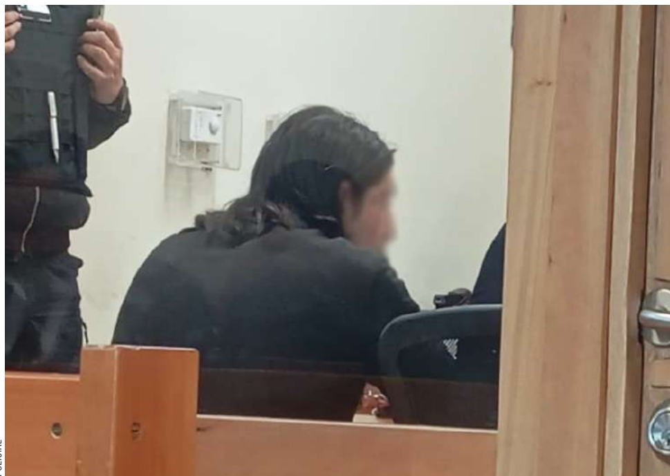
La rápida acción de Carabineros permitió la captura del individuo, quien además de la agresión portaba sustancias ilícitas.

● Fue detenido tras golpear e intentar asfixiar a su conviviente. Adicionalmente, Carabineros incautó 14 gramos de marihuana al momento de su captura y el tribunal lo consideró un peligro para la sociedad y la víctima, ordenando su ingreso al recinto carcelario.