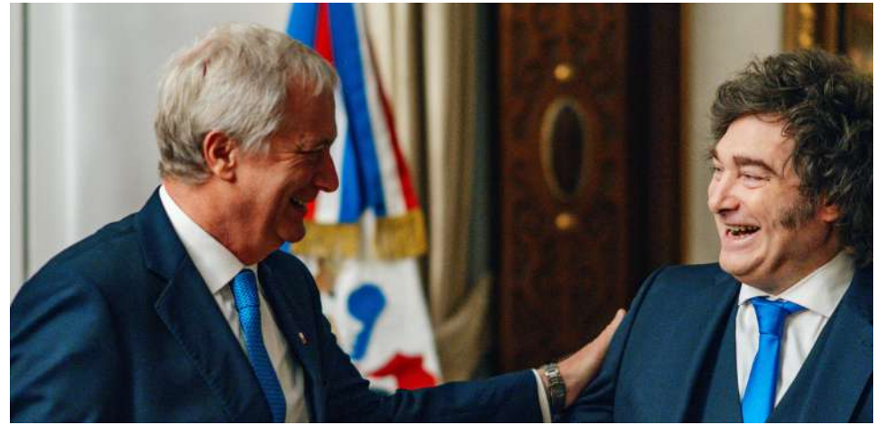
Un cordial encuentro sostuvieron los Presidentes de ambos países.

Kast reiteró el apoyo de Chile a los “legítimos derechos”