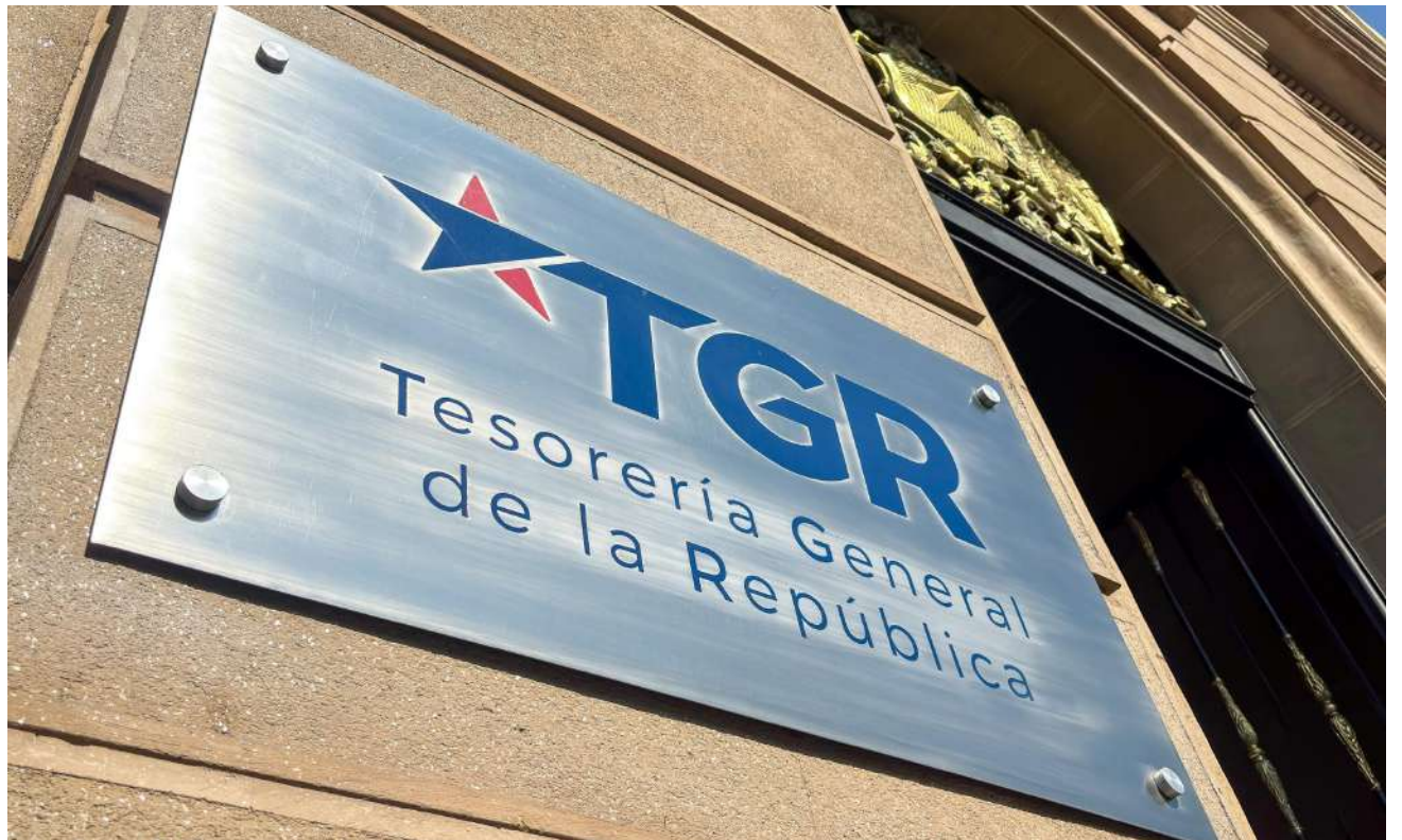
El proceso contempla convenios para quienes ganen menos de cinco millones de pesos mensuales y acciones judiciales para otros casos.

La autoridad también subrayó la relevancia de estos ingresos para el fi-