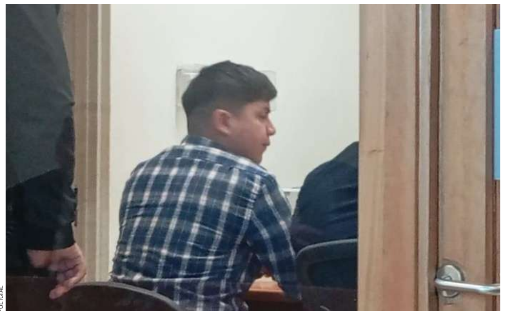
La Fiscalía acreditó que el sujeto conducía bajo los efectos de la cocaína y sin licencia.

Se fijó un plazo de 60 días para el cierre de la investigación.