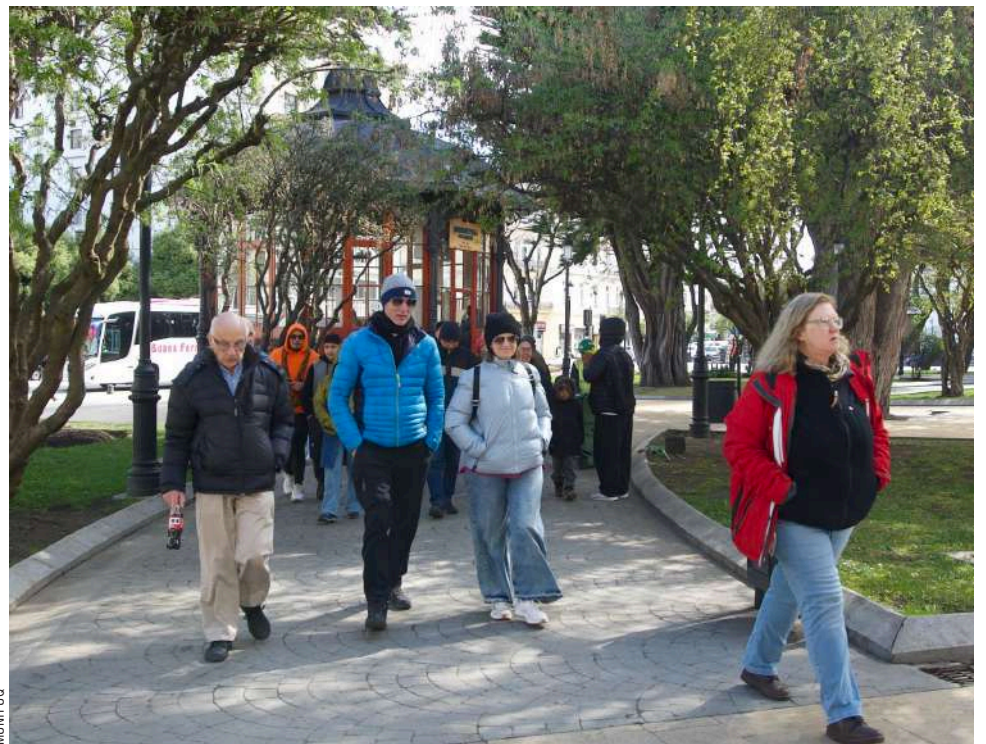
Municipio informa resultados de la temporada alta 2025-2026.