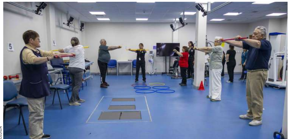
Noventa adultos mayores magallánicos son parte del estudio.

de este estudio para la salud pública: “Buscamos un grupo de personas que tengan una condición que se llama obesidad sarcopérmica, que combina un exceso de grasa corporal con una pérdida de masa, fuerza y funcionalidad muscular. Lo que queremos evaluar es no sólo esa recuperación a nivel físico, sino también a nivel molecular en sangre. Vamos a evaluar unos biomarcadores en el DNA que circula en nuestra sangre que se llaman marcas epigenéticas y que se asocian al proceso de envejecimiento, lo que, de cierta manera, nos podría estar indicando que podemos monitorizar una especie de rejuvenecimiento conseguido a través del ejercicio”.