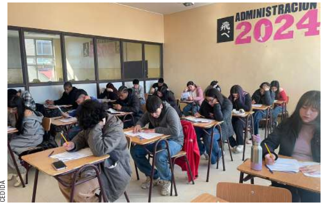
Estudiantes del Instituto Superior de Comercio, pusieron a prueba sus conocimientos para obtener certificación.

El llamado, especialmente a los establecimientos