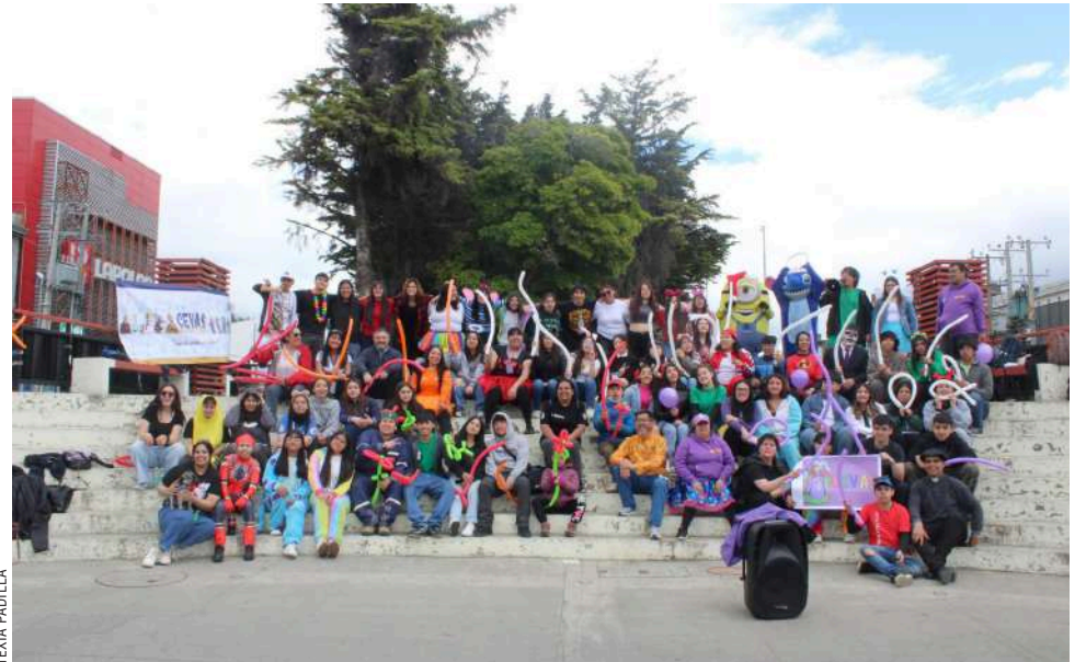
Más de cien monitores CEVAS participaron de este lanzamiento.