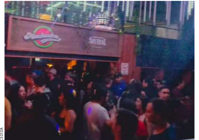
Este sería uno de los locales donde se bailarían pese a tener patente de restaurante.

"Por ejemplo, un bar X tiene una carga ocupacional de 100 personas sentadas; al sacarle las mesas y hacerlo salón de baile pasan a ser 200 personas, pero sus vías de escape están dadas por Dirección de