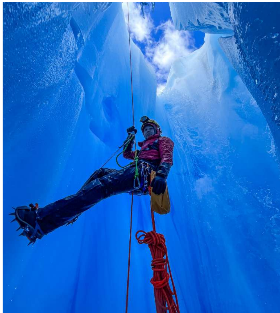
Desafíos complejos y un trabajo altamente técnico caracteriza a estos exploradores del siglo XXI.

Una demostración de experiencia y capacidades técnicas para desarrollo de expediciones espeleológicas que han marcado nuestra Patria, especialmente Magallanes, dando pie para que desde la región se organicen y exploren rincones apartados y desconocidos desarrollando una disciplina que nos hace recordar los escritos de Julio Verne con su novela “Viaje al centro de la tierra”, un desafío no menor en donde ponen todo el conocimiento y experiencia para que exploradores magallánicos se sumen a la aventura... ¿por qué no animarse a ser explorador del centro de la tierra?, seguramente tras ver el documental “Patagonia, la Última Frontera” no serán pocos los que se animen a seguir la senda de estos exploradores del siglo XXI, pues aún hay mucho que descubrir.