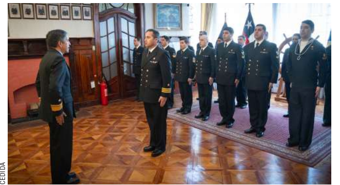
Tras un año en la Antártica marinos retornan a diferentes regiones del país.

“Durante nuestra estadía, nos enfrentamos a temperaturas extremas, como los -28°C registrados este año en el mes de junio, y con sensación térmica de -54°C. En ocasiones, estas condiciones impedían trabajar en el exterior. Ver una bahía completamente congelada, con más de tres kilómetros de hielo, fue algo impresionante. Además, conocer la fauna, como los pingüinos papúa y