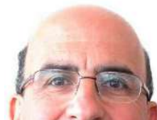
Fernando Chomali Garib Arzobispo de Santiago de Chile

Navidad es un tiempo privilegiado para volver la mirada al misterio de la encarnación y del nacimiento de Jesús, el Hijo de Dios, verdadero Dios y verdadero hombre. Es un tiempo de volver el corazón hacia Dios para reconocerlo en su omnipotencia, pero sobre todo en su misericordia. Como Él quiere que tengamos vida en abundancia, esa vida nos llega por medio de su Hijo.