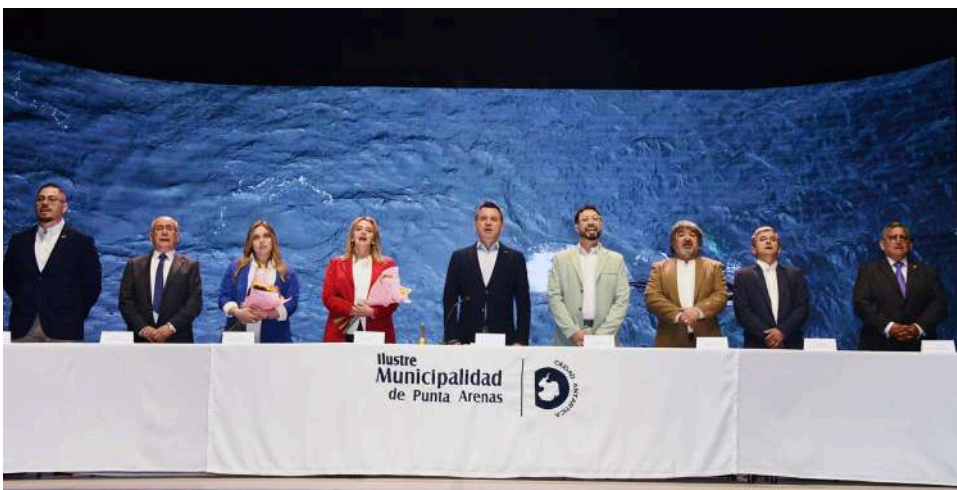
EL VIERNES EL ALCALDE DE PUNTA ARENAS, ASUMIÓ SU TERCER PERIODO JUNTO AL NUEVO CONCEJO MUNICIPAL.

"Poder intervenir en materia de tránsito; ese día durante el accidente nuestro personal no podía