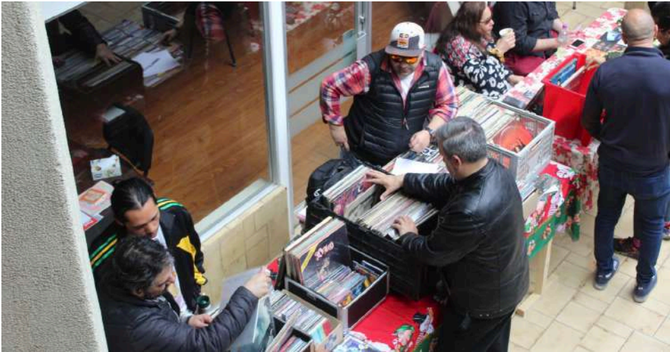
Coleccionistas pudieron intercambiar vinilos de época con otros expositores.