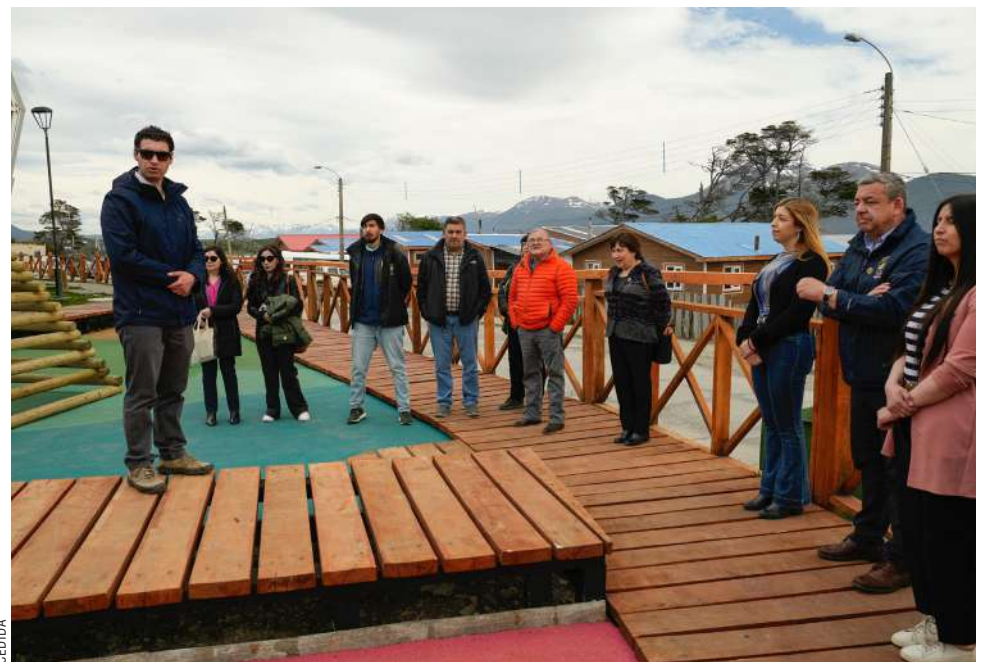
Los consejeros regionales constataando las obras terminadas.

Dentro de las actividades en la localidad, también pudieron observar el muelle multipropósito de Puerto Williams, una de las obras más esperadas por la comunidad y que forma parte del Plan Especial de Zonas Extremas (PEDZE). La iniciativa fortalecerá la infraestructura portuaria local, permitiendo el atraque de naves turísticas, científicas y de suministro de combustible que operan en la región. El nuevo muelle está diseñado para recibir embarcaciones de hasta 240 metros de eslora y un calado de 9 metros, lo que representa un avance significativo para mejorar la conectividad marítima de la zona.