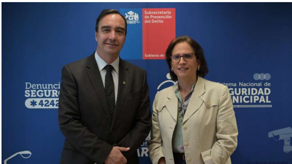
EL GOBERNADOR JORGE FLIES JUNTO A LA SUBSECRETARIA DE PREVENCIÓN DEL DELITO, CAROLINA LEITAO.

● La autoridad se reunió en la capital con diversas autoridades con el fin de ver el estado de avance de los proyectos regionales. Además de conversar sobre el presupuesto, seguridad pública, conectividad, entre otros temas de interés local.