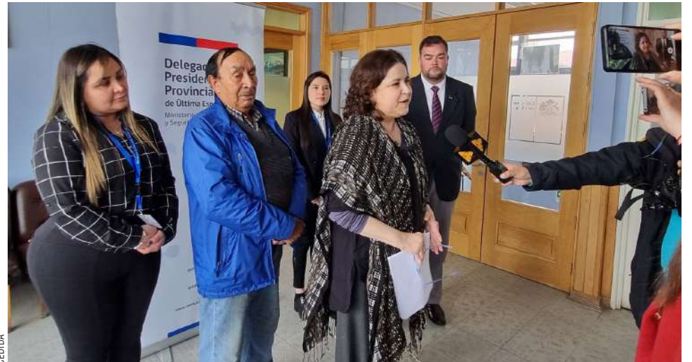
Autoridades dieron a conocer la cantidad de beneficiarios del aguinaldo de Navidad que entrega el Estado.

Por otro lado, los pensionados del sistema de AFP también tienen derecho al Aguinaldo de Navidad, siempre que estén recibiendo la Pensión Garantizada Universal (PGU), el Aporte Previsional Solidario (APS)