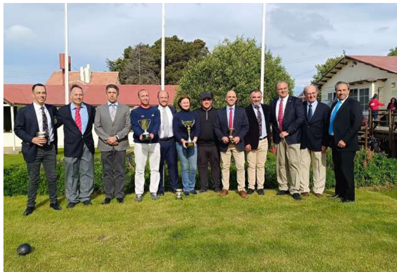
En la gráfica, directivos del Magallanes Golf Club, junto a los grandes ganadores del “Abierto de Magallanes 2024”.

En temas de resultados el gran ganador del “Abierto