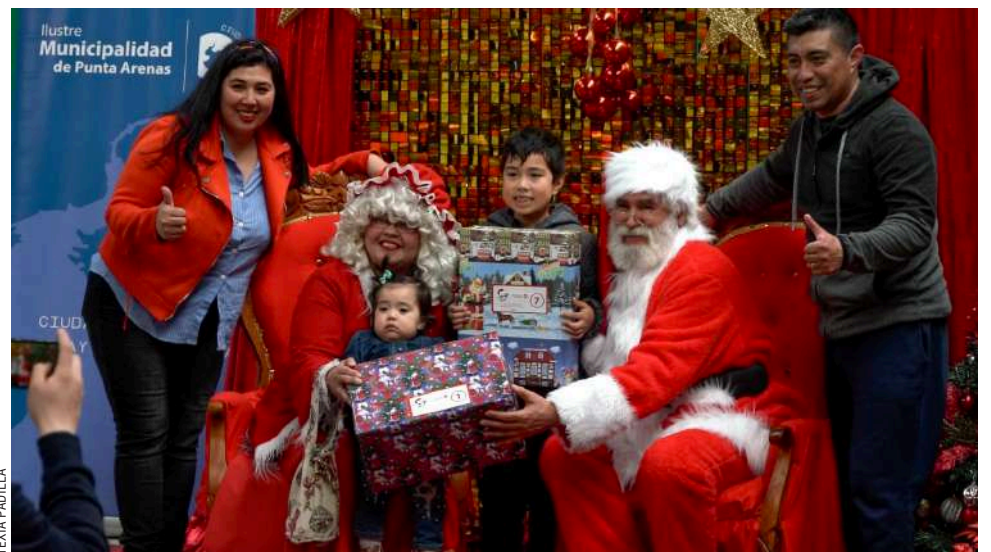
Cientos de niños felices con la visita del Viejito Pacuero.