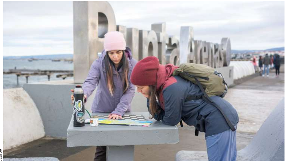
Punta Arenas será sede de importante evento turístico durante esta semana.