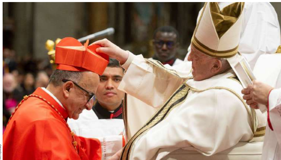
El papa Francisco celebró su décimo consistorio en el que investió al arzobispo de Santiago, Fernando Chomalí, como nuevo cardenal.

Con estos nombramientos, el papa ha dejado su huella en el futuro cónclave para elegir al próximo papa, ya que casi el 80% de los purpurados que entrarán en la Capilla Sixtina han sido elegidos en su pontificado.