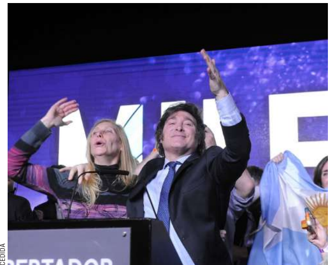
El Presidente de Argentina, Javier Milei, logra una aprobación histórica en su gestión.

Un informe con datos relevados a nivel nacional por Aresco, consultora del analista Federico Aurelio, uno de los más seguidos por el jefe de Estado argentino, señaló que Milei llega a su primer año de mandato con una imagen personal positiva del 57,2%, por encima del 53,7% de octubre y el 51,7% de septiembre. En cuanto a su gestión, el dato es similar: en noviembre dio 57,1% de evaluación favorable.