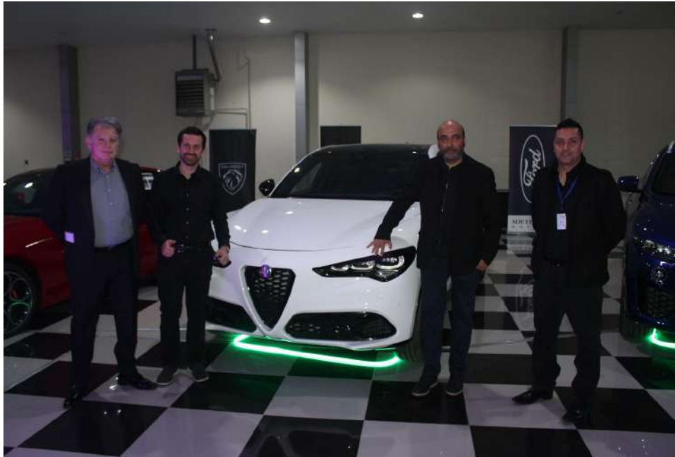
El lujo automovilístico estuvo presente en cada rincón.