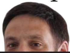
Andro Mimica Guerrero seremi de Gobierno

Como “La Deuda Histórica” ha sido conocido el perjuicio salarial que vivieron miles de docentes de nuestro país cuando se realizó la municipalización de la educación pública en nuestro país durante la dictadura. Hubo una serie de municipalidades y corporaciones que como nuevos empleadores desconocieron la deuda y el reajuste salarial. Lamentablemente, dicha vulneración y afectación a las y los docentes de nuestro país nunca tuvo una respuesta clara por parte del Estado.