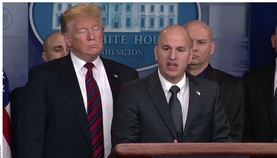
Donald Trump nominó al ex presidente del sindicato de Patrulla Fronteriza, Brandon Judd, como próximo embajador en Chile.

La inmigración fue la principal prioridad de Trump durante la campaña electoral y en sus primeros 100 días