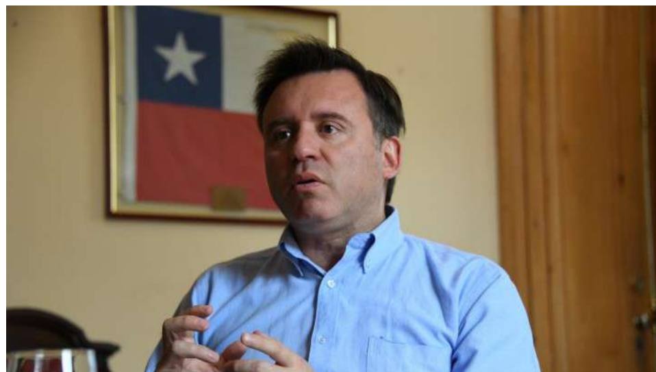
EL ALCALDE CLAUDIO RADONICH, DIO A CONOCER LAS PRIORIDADES PARA ESTE NUEVO PERIODO.

Otra materia es de orden político. El alcalde Radonich cree imperativo avanzar hacia la instalación de un alcalde y personal civil en la comuna 347 de nuestro país y que es la comuna Antártica.-