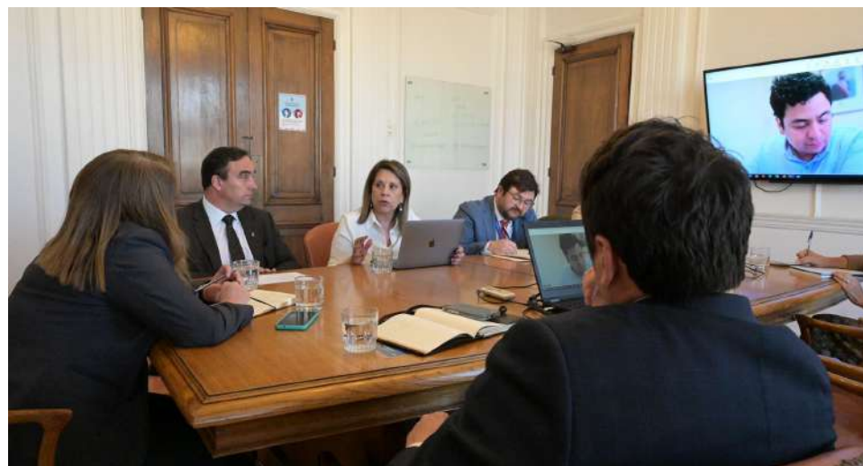
AUTORIDADES DEL MINISTERIO DE HACIENDA JUNTO AL GOBERNADOR REGIONAL Y LA ADMINISTRADORA REGIONAL.

Uno de los puntos que tocaron fue la puesta en marcha del Proyecto del Sistema Integrado de Teleprotección con Inteligencia Artificial (SITIA), que se realiza de manera piloto en Punta Arenas. Un programa que involucrar integración de