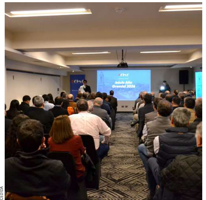
Con una masiva asistencia de autoridades regionales y socios del gremio, la Cámara Chilena de la Construcción (CChC) Magallanes dio inicio oficial al “Año Gremial” 2026.