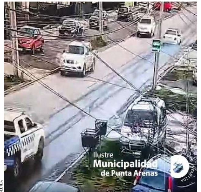
El procedimiento evitó una tragedia en un sector con alta presencia de familias.

Sin embargo, la estrategia legal no se detendrá en lo económico. El alcal-