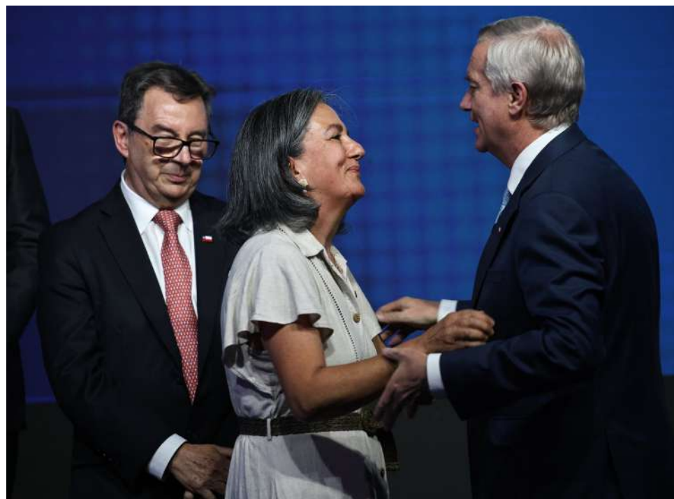
Según Critería, la ministra de Salud, May Chomali, es la mejor evaluada.

En sus atributos con menores porcentajes están ser cercano a la gente, con un 34%; y ser sensible con los problemas de las personas, con un 37%.