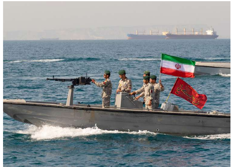
El Estrecho de Ormuz es el blanco de miradas dentro del conflicto entre Irán y los Estados Unidos.

“Se produjo un pequeño incendio que ya ha sido extinguido, no hay víctimas. No se ha reportado ningún impacto medioambiental”, señaló el UKMTO.