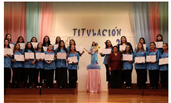
Tituladas de la especialidad de Atención al Párvulo.

De esta manera, las jóvenes egresadas cerraron una importante etapa de sus vidas, convirtiéndose oficialmente en la certificación de contar con una especialidad tras terminar su escolaridad.