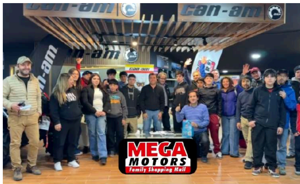
En la gráfica, la reunión de pilotos llevada a cabo en Megamotors Zona Franca.