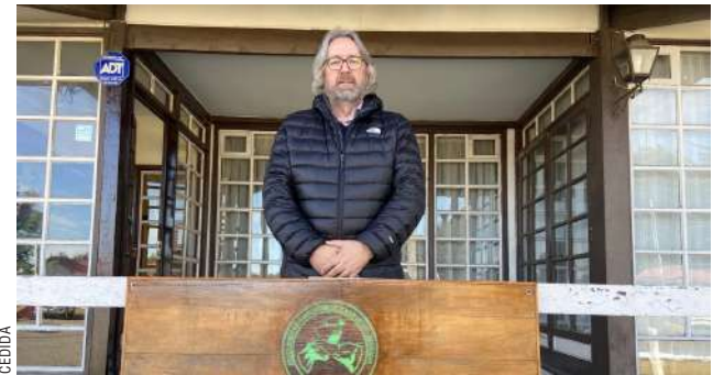
Otzen expuso que estos hechos amenazan al equilibrio del ecosistema rural de la región.

Por contraparte, Otzen expone que no está en contra del