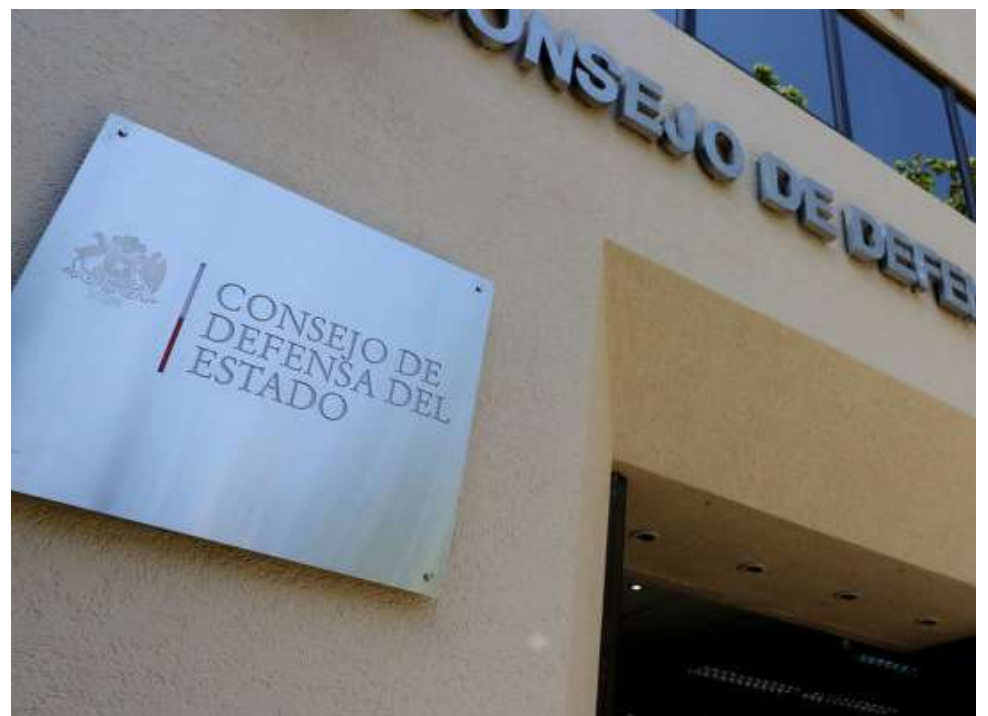
El año 2025 se registró el mayor número histórico de ingresos.

A ello se suman demandas por negligencias médicas, conflictos asociados a contratos públicos, expropiaciones y reclamaciones derivadas de obras de infraestructura.