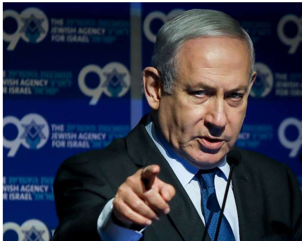
Netanyahu advirtió que aún quedan “muchas tareas pendientes”.

Aun así, evitó responder si Israel contempla operaciones militares para tomar el control del uranio en caso de que fracasasen las negociaciones con Teherán.