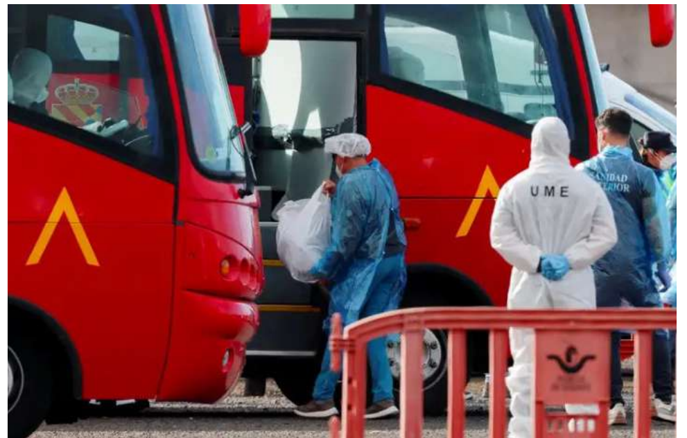
Casi 100 personas fueron evacuadas de crucero con hantavirus.

Parte de la tripulación, así como el cuerpo de una pasajera que murió a bordo, permanecerán en el barco, el cual partirá hacia Rotterdam, Holanda,