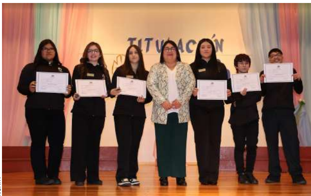
Las seis primeras jóvenes tituladas de la especialidad de Programación del Insafo.

Esta última, forma a estudiantes en el análisis, diseño, desarrollo, instalación y mantenimiento de software, incluyendo el armado de computadores y fomenta