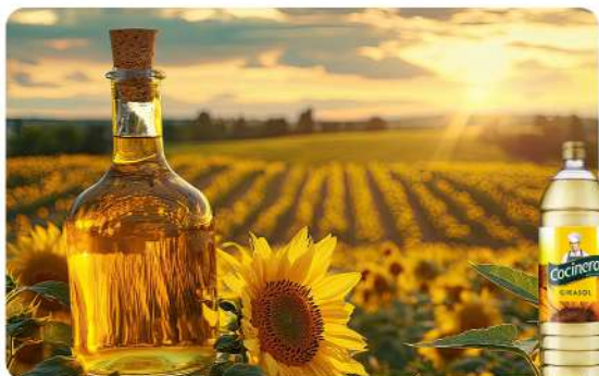
ACEITE DE GIRASOL 900 ML · COCINERO Stock: 11400 Unidades