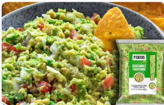
GUACAMOLE 450 GR · MC CAIN Stock: 670 Unidades