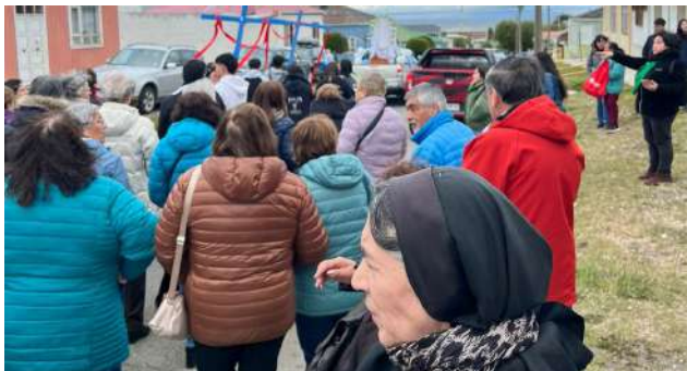
En su paso los asistentes rezaron el Santo Rosario.