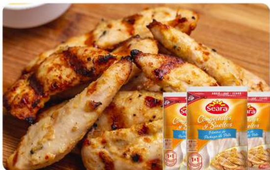
FILETITOS DE PECHUGA 1 KG · SEARA Stock: 5700 Unidades