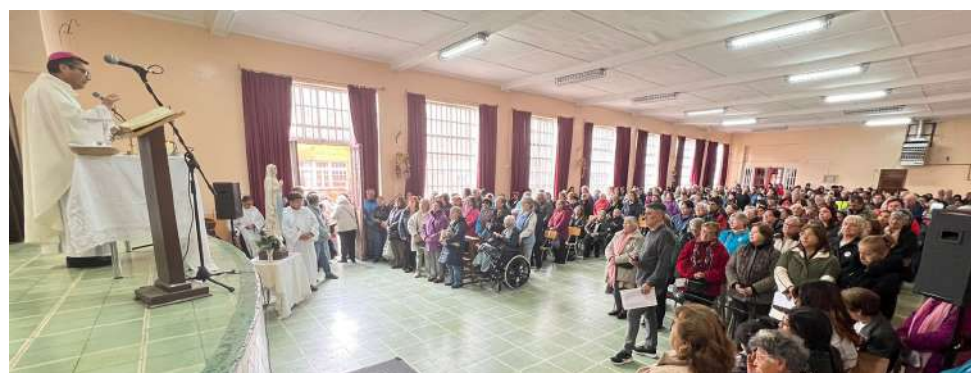
Finalmente se celebró la eucaristía en el Hogar de Niños Miraflores.