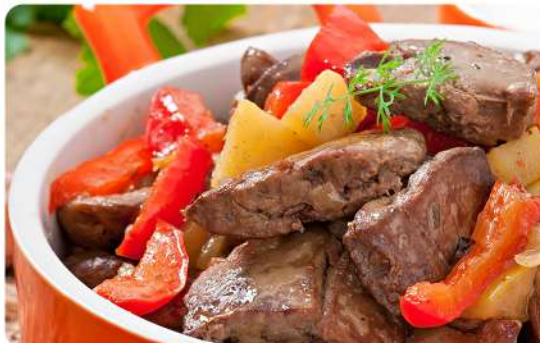
TAPAPECHO CAT V. IMP · BEEF CLUB O PUL Stock: 4300 Kilos