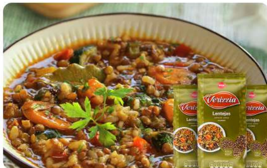
LENTEJAS 400 GR · VERIZIA Stock: 2500 Unidades