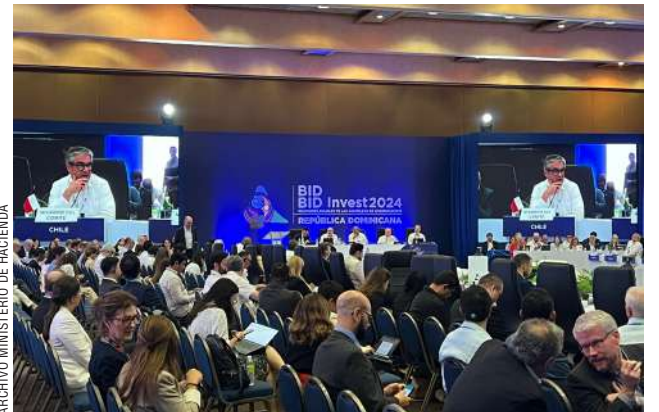
El ministro Mario Marcel durante el encuentro de 2024.

“Instalarse acá para lo que a nosotros es fundamental para el crecimiento: mirar las condiciones de Magallanes, no solo hoy el paso estratégico del Estrecho de Magallanes, en función de lo que pasa en Panamá; también nuestra vocación antártica, queremos ser plataforma logística; para qué hablar de las inversiones de hidrógeno verde; y también cómo Magallanes, a propósito de las condiciones de su territorio, podemos entregar espacios importantes para que las empresas se instalen, en