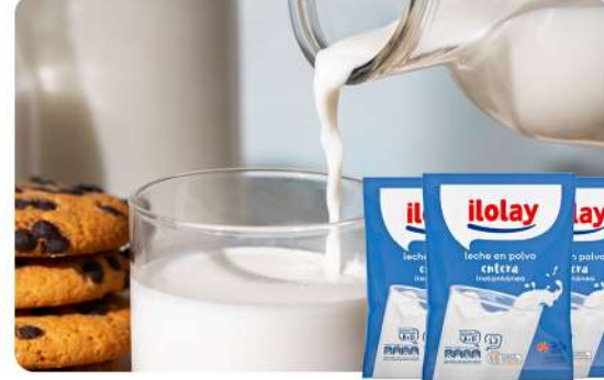
LECHE ENTERA EN POLVO 400 GR · ILOLAY Stock: 3400 Unidades