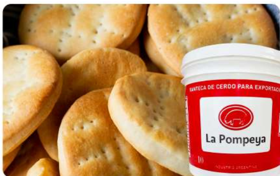
BALDE DE MANTECA 10 KG · LA POMPEYA Stock: 1300 Unidades