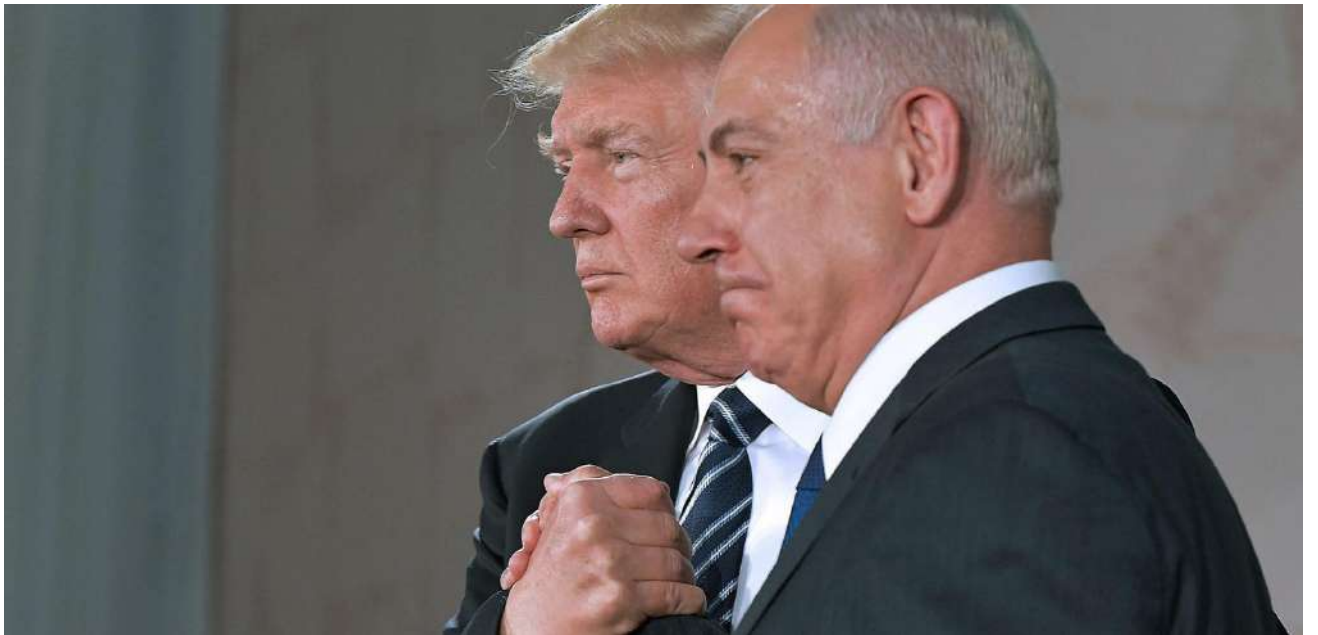
Los líderes amenazaron de reanudar los ataques en la Franja de Gaza.

Netanyahu reiteró que todos “aplauden” esa sugerencia de Trump, así como su “visión revolucionaria para el futuro de Gaza”, como parece que ha pasado a conocerse entre los funcionarios israelíes la propuesta de vaciar la franja de gazatíes, un crimen de guerra si se realiza de forma forzosa, según el Derecho Internacional.