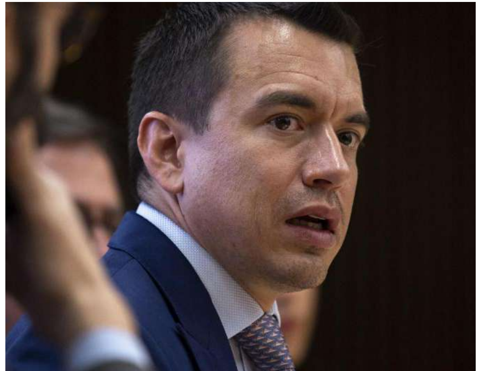
En el balotaje del 13 de abril, los candidatos reeditarán el duelo de las atípicas elecciones de 2023, en las que se impuso Noboa.

La OEA remarcó que los comicios fueron “técnicamente sólidos y sin mayores contratiempos”, e insistió en que “los resultados oficiales son aquellos emitidos por el CNE, ya que las misiones de observación electoral no sustituyen a las autoridades electorales nacionales ni interfieren en sus atribuciones”.