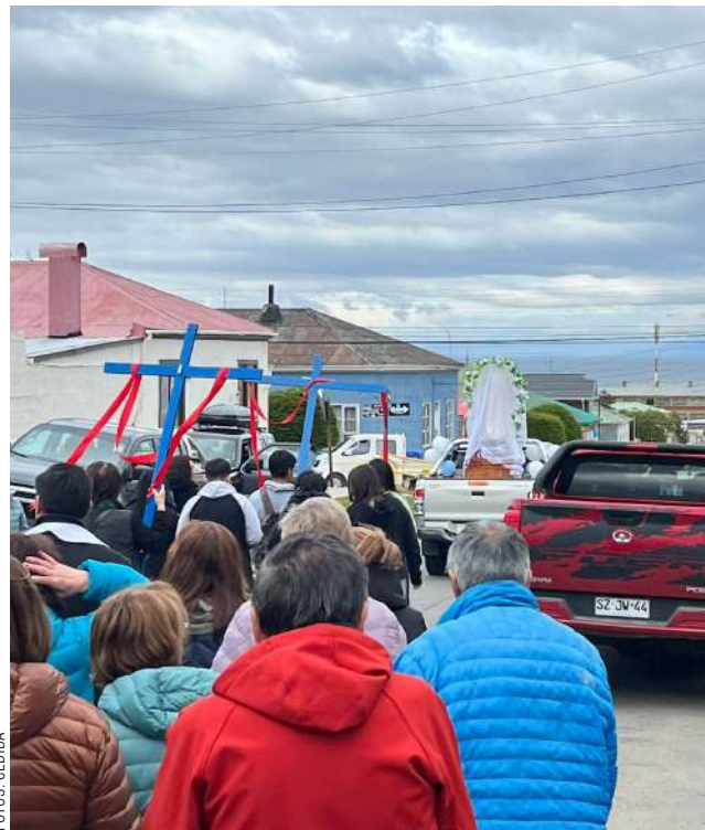
La procesión partió desde la Parroquia San Miguel.

● La comunidad de la Parroquia San Miguel se congregó a los pies de la Virgen para celebrar una procesión y eucaristía con unción a los enfermos.