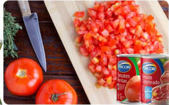
TOMATE CUBETEADO O PERITAS LATA 240 GR · ARCOR Stock: 14000 Unidades