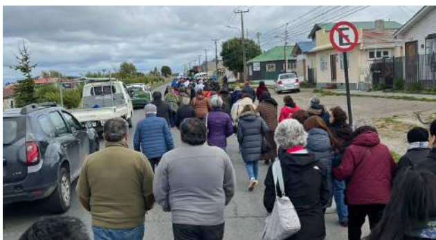
Los fieles recorrieron las calles del Barrio Sur.