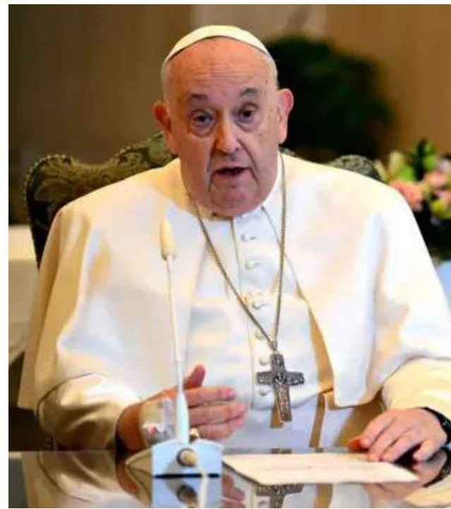
El Papa Francisco lamentó y condenó las deportaciones.

gración ordenada y legal. Sin embargo, la mencionada ‘maduración’ no puede construirse a través del privilegio de unos y el sacrificio de otros”, subrayó.