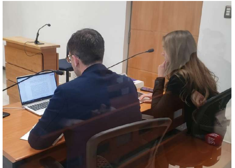
El fiscal Fernando Dobson le comunicó a la imputada los cargos que se siguen en su contra.

Cabe hacer presente que se prohibió dar a conocer el nombre o difundir el rostro de la imputada.