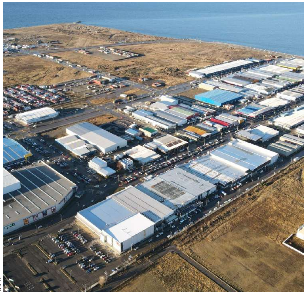
El sector de servicios de la Zona Franca estaría en un terreno de la FACH.

“Si el ministro de Hacienda no está de acuerdo con que se amplíe la zona franca de servicios, no hay nada que hacer. Si está de acuerdo debe redactar la letra chica: servicios profesionales, o todo tipo de servicios, o de apoyo a zonas industriales, son