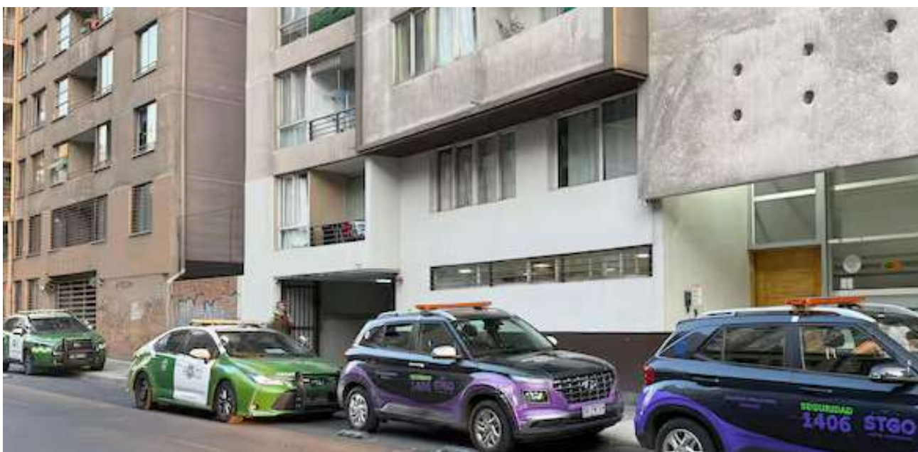
La tragedia se desató en un edificio ubicado en la calle Eleuterio Ramírez, Santiago Centro.

"El niño, desde un dormitorio que estaba con la ventana abierta, habría caído. Por lo que se ve, la información preliminar, es