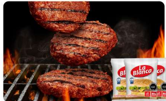
HAMBURGUESA VACUNO · 80 GR LA BLANCA Stock: 54800 Unidades