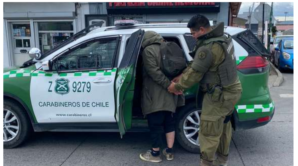
Carabineros ha realizado cientos de controles de identidad, con la finalidad de detectar incumplimientos de este tipo.