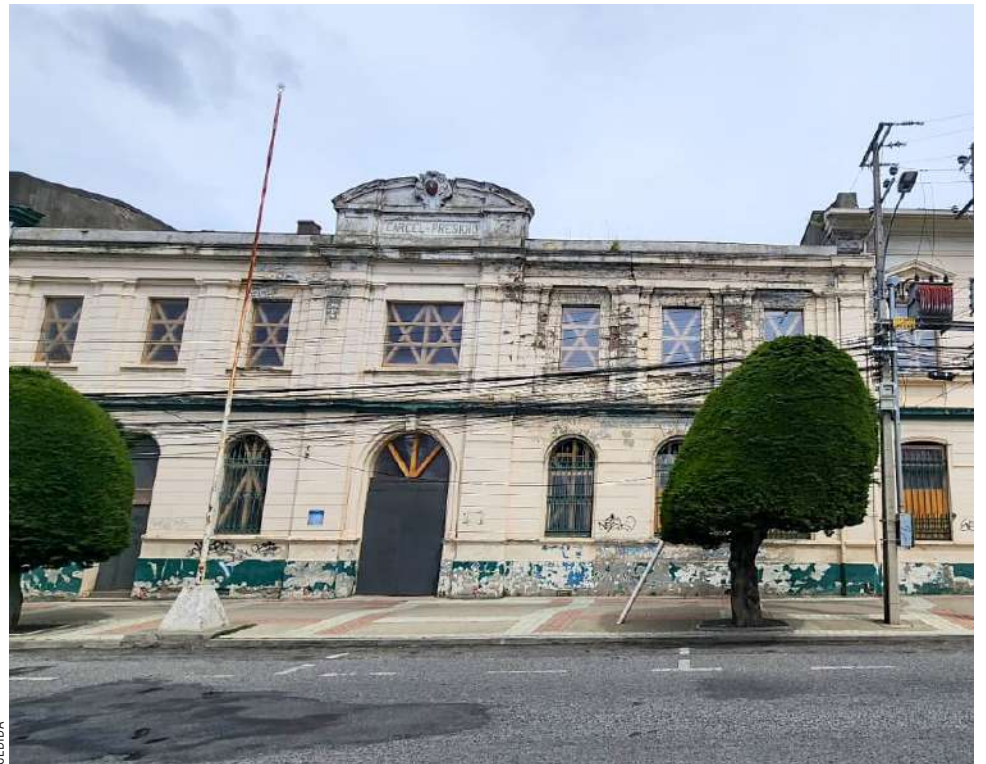
El Consejo de Monumentos supervisa los hallazgos en el terreno.

La ejecución se llevará a cabo en una superficie de 2.100 metros cuadrados de terreno, con 4 niveles que abarcan en total 4.900 metros cuadrados de construcción, con espacios para conferencias y de uso público, como la transformación de las celdas de la cárcel -que dejaron de usarse en 1987- en salas de lectura.