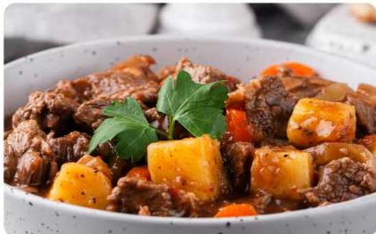
POSTA NEGRA, ROSADA O PALETA CAT. V. IMP · BEEF CLUB O PUL Stock: 8600 Kilos