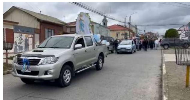
Cerca de 400 personas participaron de la jornada.