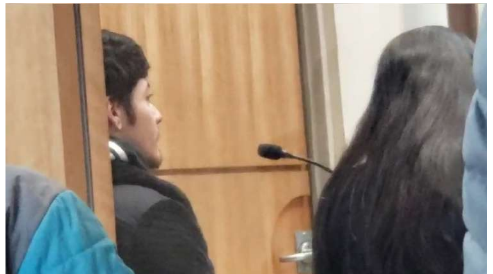
El conductor fue formalizado ante el Juzgado de Garantía de Punta Arenas, por no dar cuenta a la autoridad ni asistir a las víctimas del accidente.