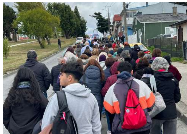
Hubo gran participación de jóvenes.