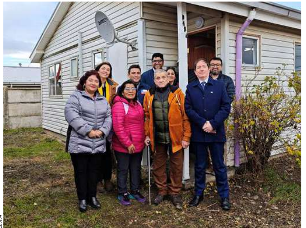
La tranquilidad regresa bajo un nuevo techo.

Actualmente, el programa de viviendas para personas mayores de Serviu contempla 11 unidades en Puerto Natales: cinco ya asignadas, cuatro en reparación y dos disponibles para mejoramiento.