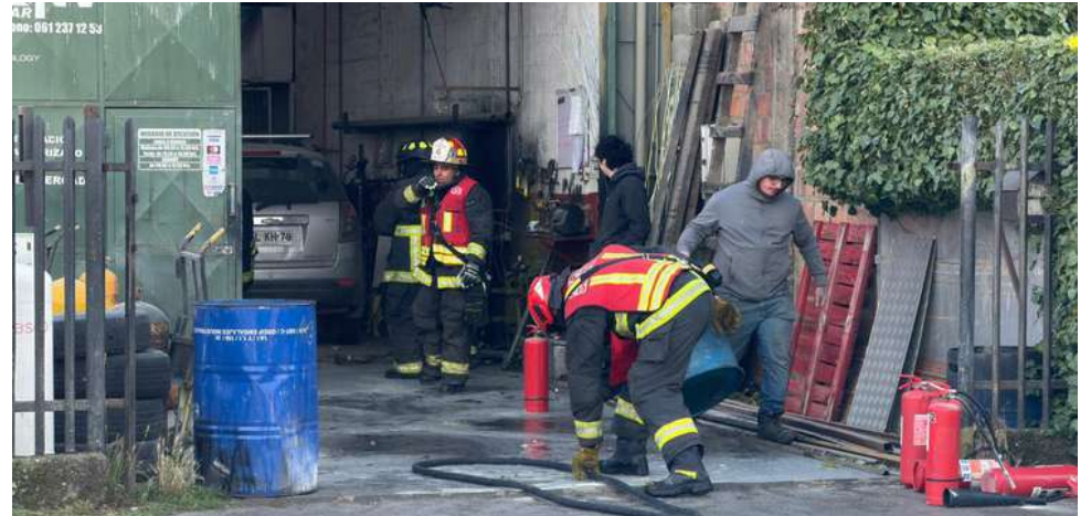
Tres unidades de Bomberos acudieron al sector, pero ya los trabajadores habían controlado la emergencia.