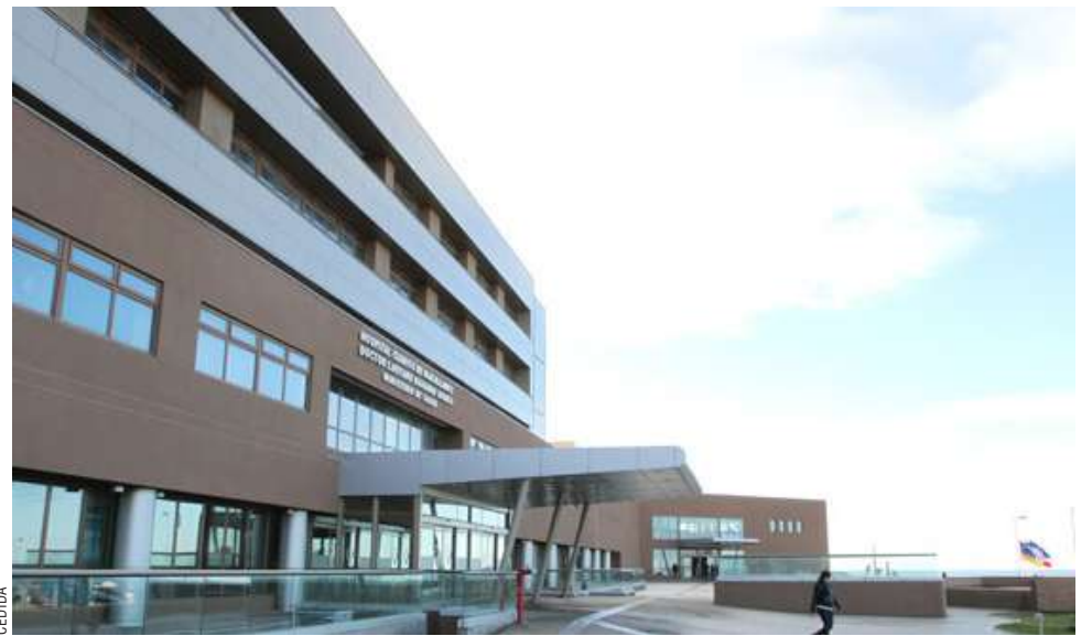
El tribunal de alzada fijó una indemnización de 30 millones de pesos por concepto de daño moral, tras acreditar que el Hospital Clínico de Magallanes actuó de forma tardía ante una urgencia quirúrgica.

El profesional precisó que "el fallo constituye, además, un importante precedente regional y nacional en materia de derechos de los pacientes y protección reforzada de niños y adolescentes frente a