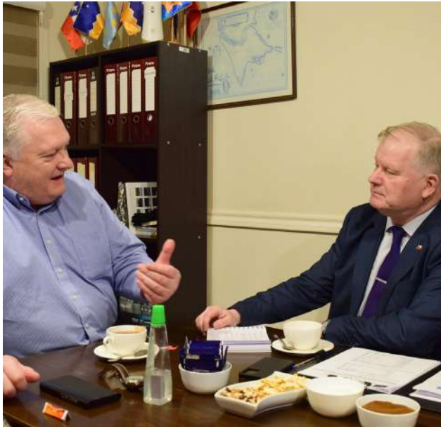
Autoridades buscan mejorar la conectividad en zonas apartadas de la región.

Por su parte, el seremi de Transportes, Allan Stöwhas, destacó la relevancia de mantener una coordinación permanente con el Senado para avanzar en proyectos que permitan mejorar el transporte y la conectividad regional. “Para nosotros es importante poder trabajar coordinadamente estos temas, especialmente considerando los desafíos que tiene Magallanes por su condición geográfica y las necesidades