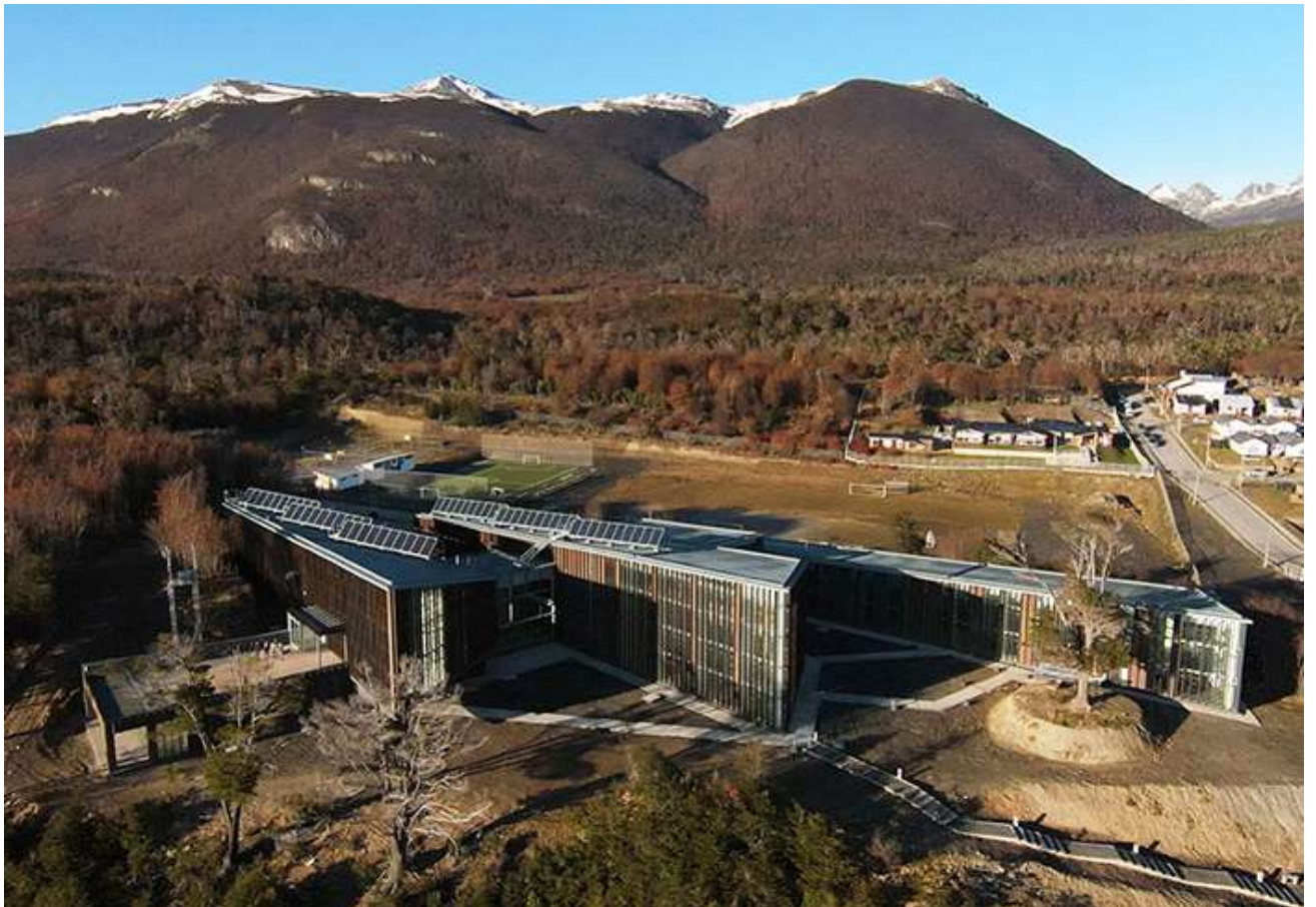
Centro Internación Cabo de Hornos en Puerto Williams.

Actividades en terreno y talleres sobre gastronomía, sustentabilidad, turismo, conservación y biodiversidad local están disponibles para la comunidad más austral del mundo. Las jornadas comenzaron a abrirse antes del inicio oficial: el sábado 9 de mayo, vecinos y aficionados salieron a recorrer Isla Navarino para una observación y registro de aves usando la aplicación eBird, sumándose a