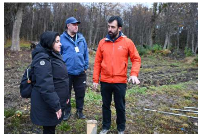
La seremi recorrió el Parque Omora.