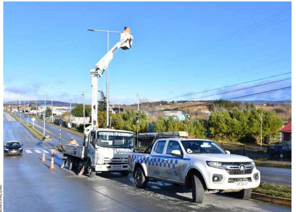
El trabajo realizado entre los funcionarios municipales y la empresa contratista finalizó ayer en la mañana.

Desde la casa edilicia hicieron un llamado a la responsabilidad, recordando que cada impacto contra el mobiliario urbano no solo pone en riesgo vidas, sino que resta recursos críticos para otras necesidades sociales de la comunidad magallánica.