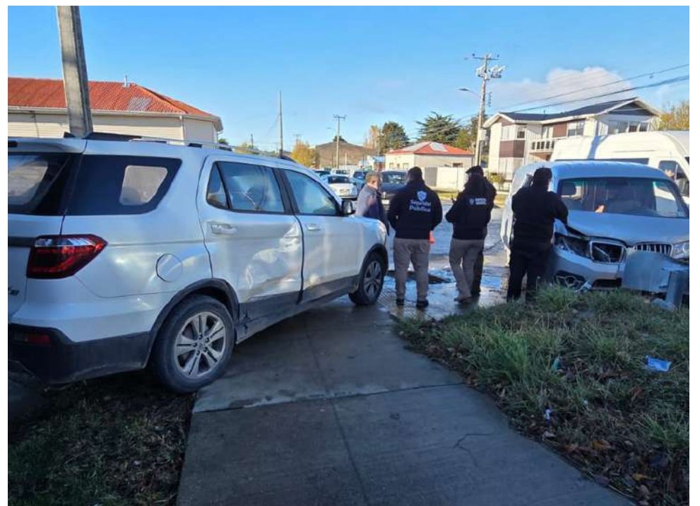
En estas condiciones quedaron los móviles involucrados en el accidente ocurrido la mañana de ayer.

Una particularidad del incidente fue que el hombre viajaba acompañado de un perro al que se disponía a llevar de paseo al momento de la colisión; afortunadamente, la mascota tampoco reportó lesiones.