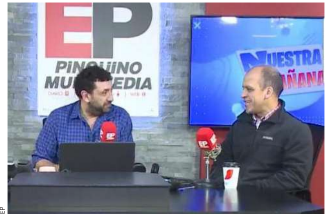
López durante entrevista en Pinguino Multimedia.

La recepción de los magallánicos ha sido positiva, aunque algunos vecinos manifestaron sorpresa por no