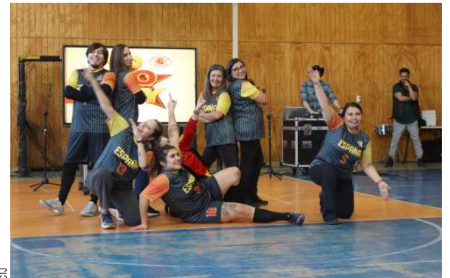
Educadores sorprendieron a sus estudiantes con caracterizaciones de cantantes

Actos como estos se vivieron en otros colegios de la región con el propósito de brindarles una mañana diferente a sus estudiantes en la celebración de su día.