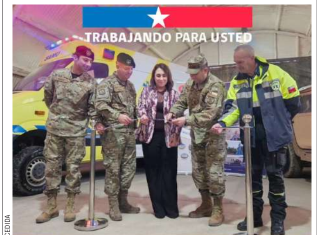
Hoy en Agrupación de Comandos Lientur del Regimiento N°10 Pudeto, se realizó la ceremonia de entrega del móvil SAMU en desuso a Macro Zonal Salud a fin de fortalecer su flota vehicular.