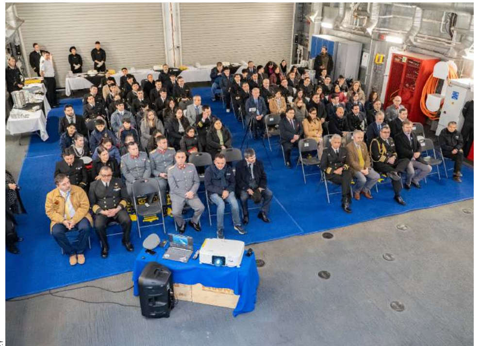
La Armada de Chile reafirma su rol estratégico en la protección de los intereses nacionales y el fomento de la ciencia global.

Con el cierre de esta comisión, la Armada reafirma su rol estratégico en la protección de los intereses nacionales y el fomento de la ciencia global, demostrando que la tecnología y el capital humano chileno están preparados para los desafíos del Territorio Antártico.