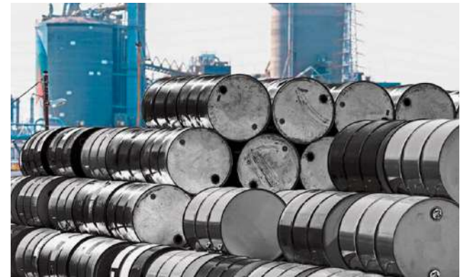
Los precios del petróleo repuntan sobre US$100 ante falta de avances para resolver la guerra.

"No había otra alternativa que aceptar los derechos del pueblo iraní tal como se