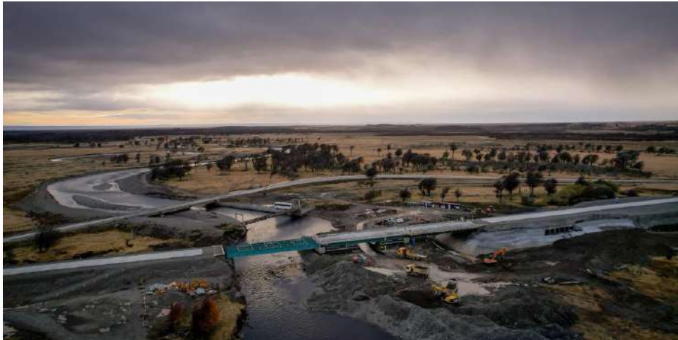
Avanzan los trabajos del nuevo Puente Río Rubens.