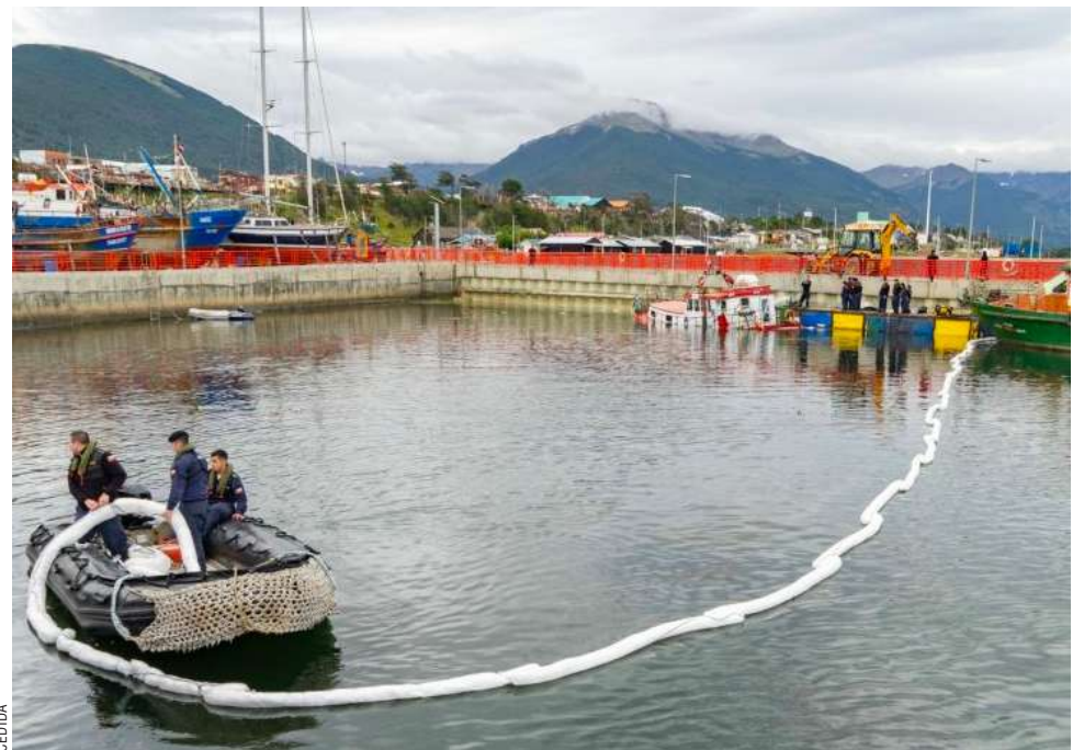
La foto de referencia muestra el sector del muelle de pescadores de Puerto Williams.

La tragedia enluta nuevamente a Puerto Williams, una comunidad marcada por estrechos lazos entre sus habitantes, donde la pérdida de uno de sus jóvenes integrantes ha generado profundo dolor y consternación.