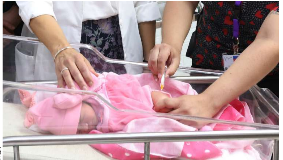
El VRS es una de las principales causas de hospitalización en menores de un año.

El Virus Respiratorio Sincicial es una de las principales causas de hospitalización en menores de un año, por lo que inmunizar a tiempo permite reducir significativamente el riesgo de cuadros graves y complicaciones respiratorias.