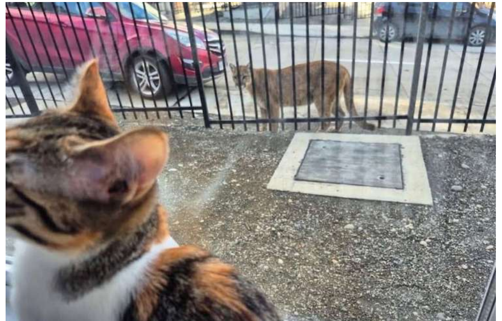
Esta es la fotografía que fue divulgada por medios y a través de redes sociales, generando la atención de la comunidad.

No es la primera vez que ejemplares de puma