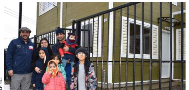
Minvu reasigna vivienda que fue recuperada antes de su entrega por incumplimiento de requisitos.

Desde el Serviu se informó que la revisión de antecedentes es obligatoria desde la asignación del beneficio hasta la entrega de