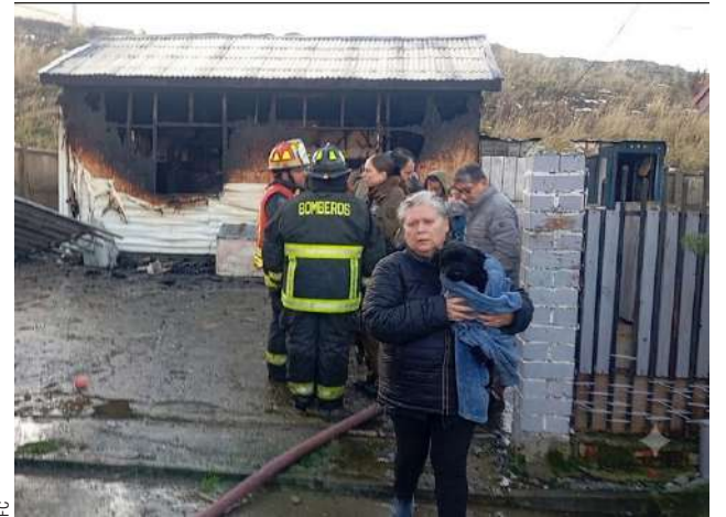
El fuego consumió el recinto comercial dedicado al cuidado de mascotas.

Este rescate cobró un significado especial para los activistas, ya que el animal se recuperaba de severas quemaduras sufridas por un caso previo de maltra-