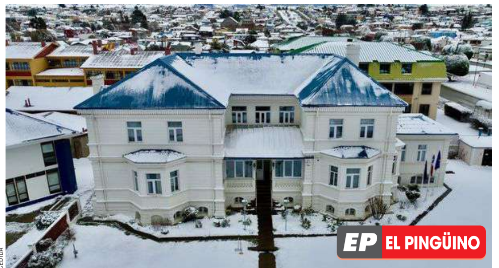
La Corte de Apelaciones de Punta Arenas.

Al estar asegurada su continuidad, la Corte concluyó que “en la actualidad no es posible sostener la efectividad de los hechos indicados (...), ya que no existe una suspensión indefinida respecto del internado clínico”.