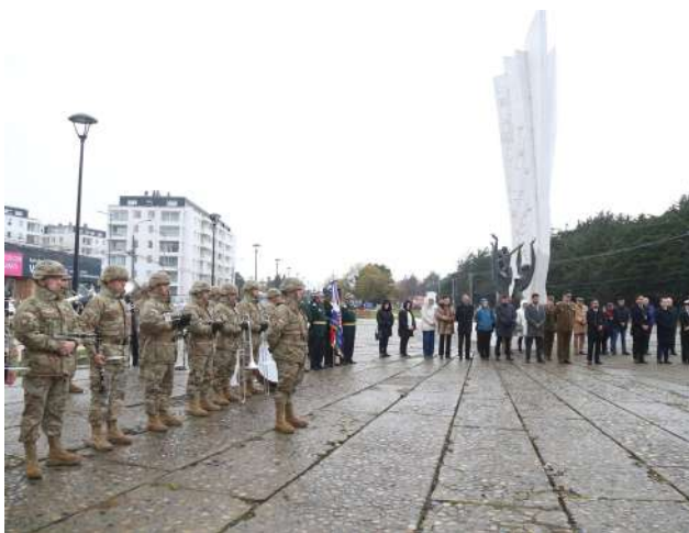
Vista general de autoridades asistentes a la ceremonia.