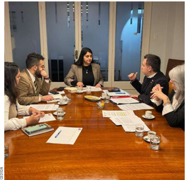
Reunión de trabajo para revisar avances en compromisos habitacionales, mejorar la normativa vigente y ampliar el acceso a subsidios.