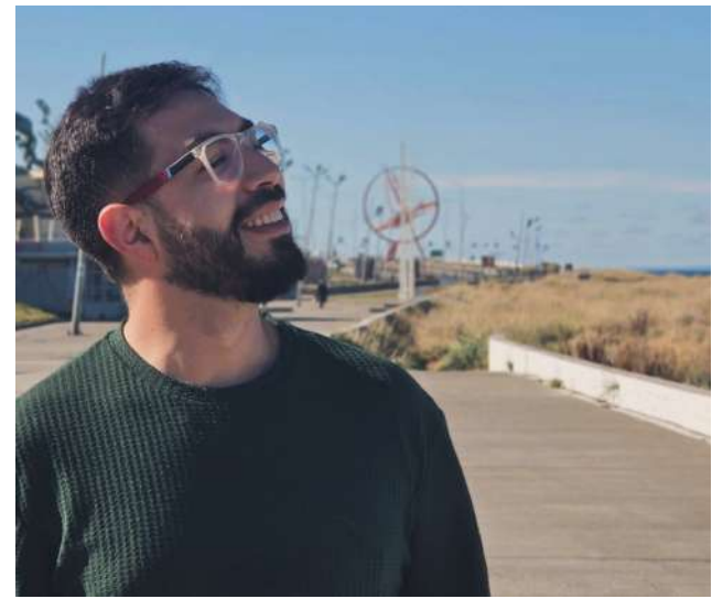
La autoridad comunal fue enfático en señalar que espera que la gestión mejore y exista un trabajo en equipo.

“Tenemos una ciudad que avanza poco, una ciudad que está estancada. Todos los alcaldes han dejado un legado, finalmente, que uno recuerda en el tiempo que son imborrables. En este sentido, faltan por parte del alcalde proyectos que sean significativos, que queden en el recuerdo de una gran obra”. Para cerrar, la autoridad comunal hizo un llamado directo a la unidad: “En vez de pelearse todo el tiempo con el gobernador, que exista un trabajo en conjunto con las autoridades (...) que se terminen las peleas y que comience el trabajo”.