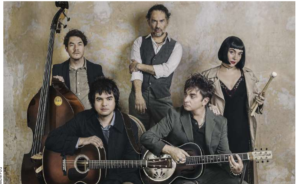
Los Bunkers abrirán los 30 años del Carnaval de Invierno.

Durante sus tres décadas de existencia, el Carnaval de Invierno se ha consolidado como una de las principales cele-