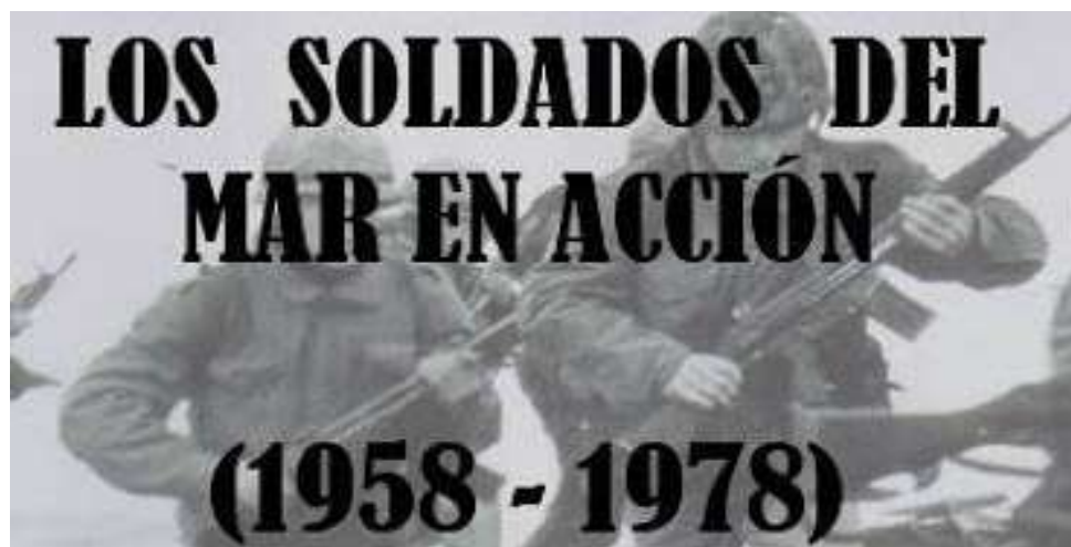
"LOS SOLDADOS DEL MAR EN ACCIÓN" ES UNO DE LOS LIBROS MÁS IMPORTANTES ESCRITOS EN TORNO AL CUERPO DE INFANTERÍA DE MARINA CHILENA.