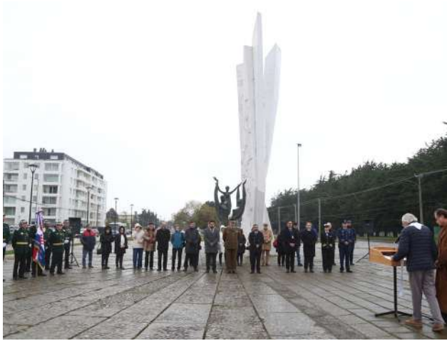
Vista general de autoridades asistentes a la ceremonia.