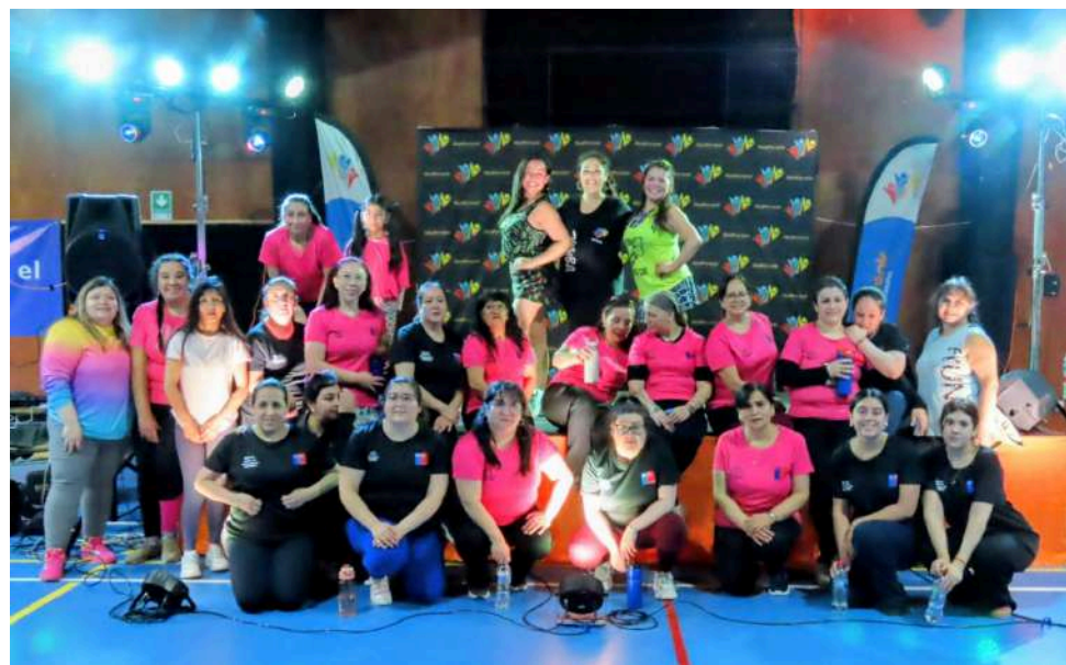
La comuna porvenireña vibró con la “Zumba Aniversario 132 de Porvenir”.

● Esta iniciativa fue organizada por la Municipalidad de Porvenir, a través de la Oficina Municipal de Deportes y Recreación, y financiada por el Instituto Nacional de Deportes.