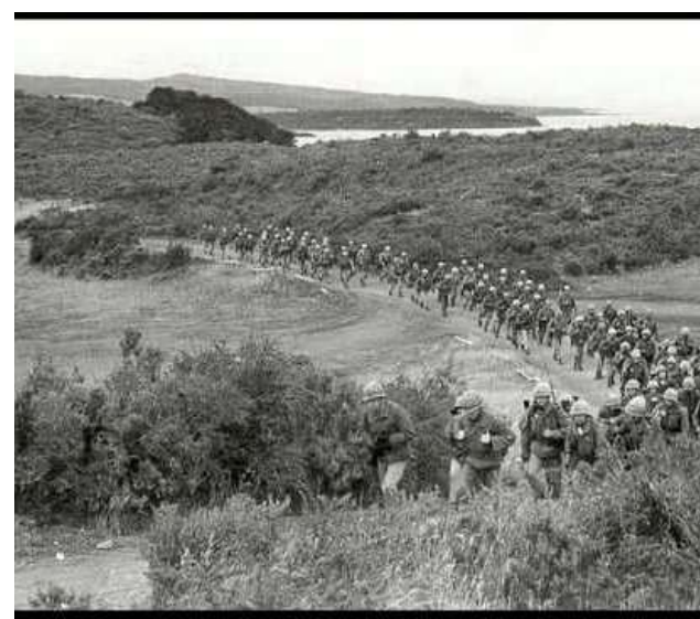
INFANTES DE MARINA EN PATRULLAJE EN LA ZONA AUSTRAL.

"A los de ayer... que nos permiten el hoy", reza una de las dedicatorias del libro. En esa frase cabe todo su sentido. Porque los ve-