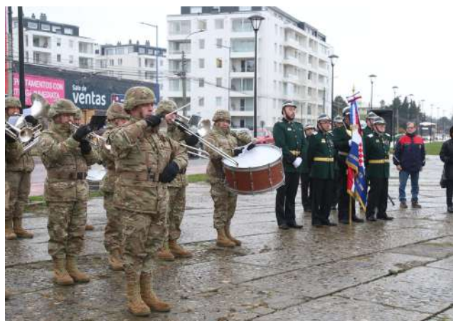
Banda Instrumental de la Vª División del Ejército, que interpretó los Himnos Nacionales de Chile y Croacia.