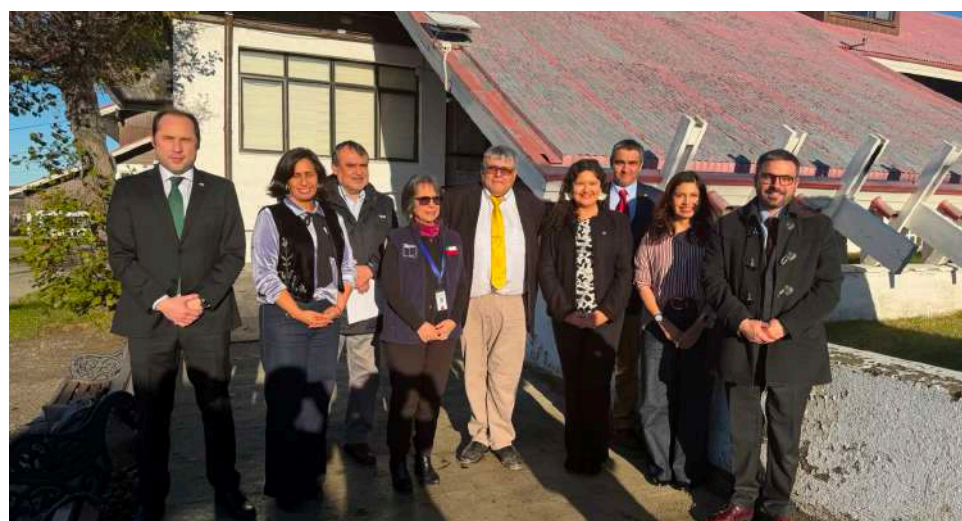
El Seremi de Economía de Magallanes impulsa agenda para destrabar inversiones y potenciar el desarrollo regional.

Por otro lado, la diferencia con Argentina no solo debe ser con incentivos económicos, debemos ser capaces de contar con