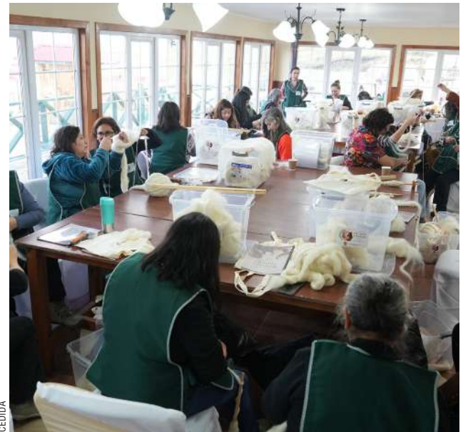
Río Verde impulsa oficios tradicionales con Taller de Hilado y Teñido de Lana 2026.

Con la ejecución de estos talleres de fomento productivo, el municipio reafirma su compromiso con el desarrollo de habilidades locales, el impulso al emprendimiento con identidad territorial y el fortalecimiento del patrimonio inmaterial de Río Verde.