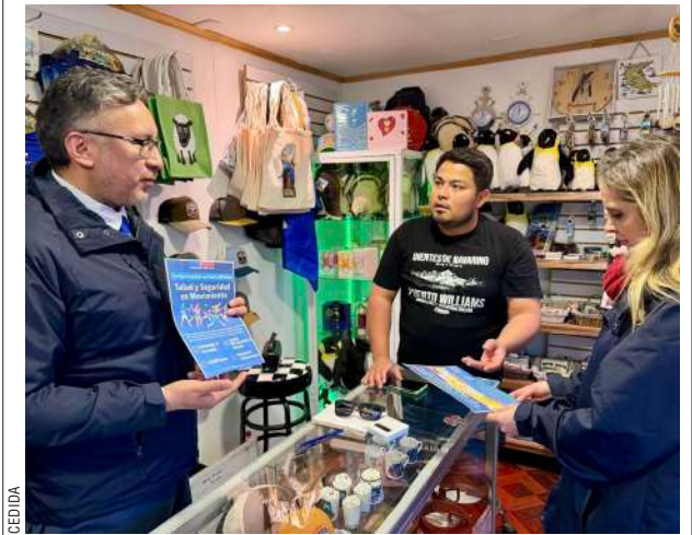
El domingo a las 10 horas, en el frontis de la Delegación Presidencial de la Provincia Antártica, se realizará la carrera recreativa de 3 kilómetros “Salud y seguridad en movimiento”. Se espera gran cantidad de vecinos y turistas.