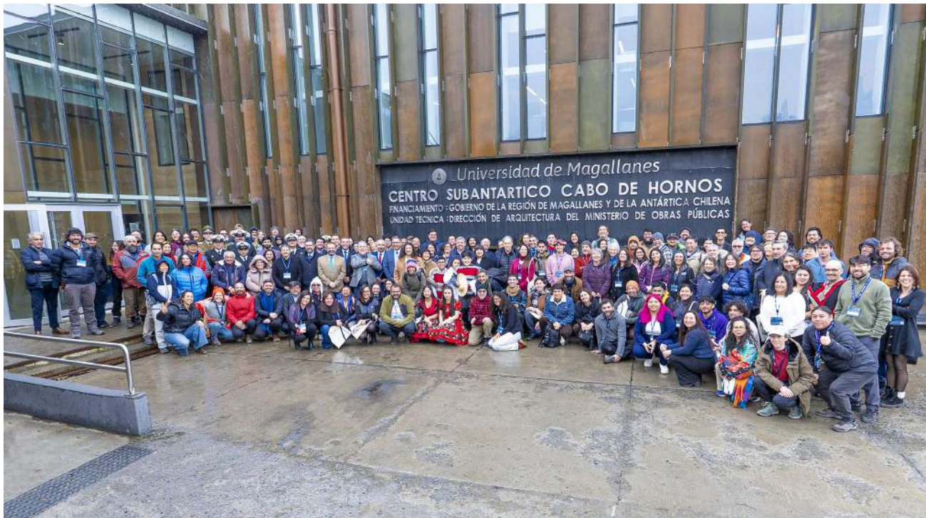
Foto oficial IV Conferencia Internacional CHIC 2026.