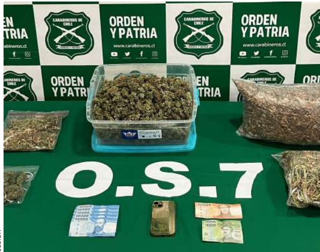
En el operativo se incautaron más de dos kilos de marihuana, avaluados en 25 millones de pesos.

Al respecto, el fiscal Oliver Rammsy fue enfático en señalar la gravedad del hallazgo, indicando que el sujeto "tenía toda un aparataje con una tecnología implementada en donde él tenía en una casa habilitado especialmente un lugar