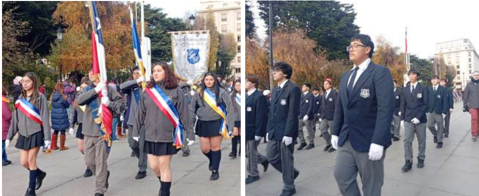
Estudiantes pasaron revista en conmemoración a las Glorias Navales.

De la cita, participaron comunidades educativas de