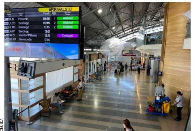
Aeropuerto Presidente Carlos Ibáñez del Campo.