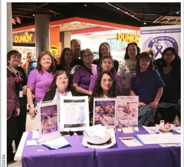
La Agrupación de Pacientes con Fibromialgia de Magallanes participó de una actividad denominada Gobierno en Terreno, donde entregaron información oportuna a usuarios.