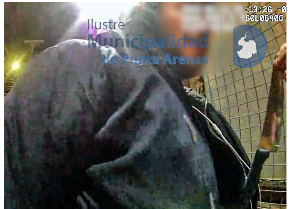
Este es el registro de uno de los inspectores municipales, donde se ve el arma que le incautan al sujeto.

"Esto se está haciendo cada vez más reiterativo", advirtió Rendoll, subrayando la importancia de la prevención en las principales arterias de la ciudad.