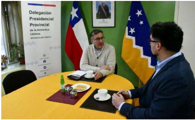
El planteamiento se entregó en una reunión entre ambas autoridades en Puerto Williams.