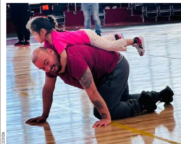
La comunidad educativa del Jardín Infantil “Papelucho” de Porvenir realizó la actividad “Mañana deportiva en familia”, en el Gimnasio “Padre Mario Zavattaro” de Porvenir.