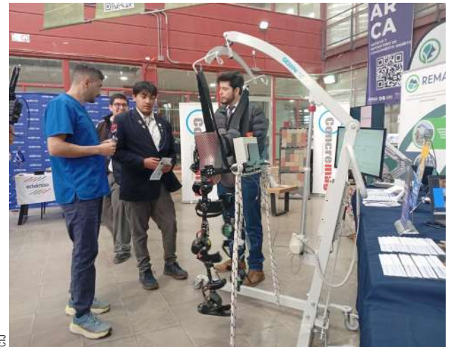
El exoesqueleto del Centro de Rehabilitación, entre los elementos más consultados por visitantes.

En un trabajo mancomunado con esta casa de estudios, el Centro de Rehabilitación formó un exoesqueleto que aporta con la circulación de las extremidades de los usuarios. "Un aparato ortésico que tiene motores que van dentro de las articulaciones. Entonces se coloca a una persona que tiene dificultad en la movilidad (de sus piernas). Entonces, a través de una programación, se realiza un movimiento normal de la extremidad inferior, entonces se le enseña a la