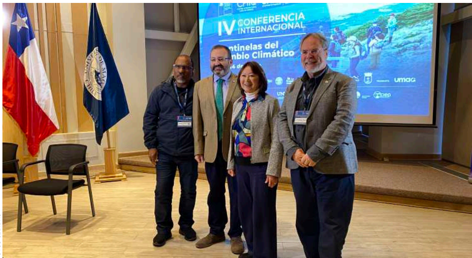
Un punto de encuentro con el mundo científico, autoridad y ciudadanía.

● Entre el 11 y el 14 de mayo, la ciudad más austral del planeta reunió a cientos de investigadores nacionales e internacionales bajo el lema “Centinelas del Cambio Climático”. El encuentro consolidó a Magallanes como nodo científico estratégico, con avances en monitoreo de marea roja, soberanía ambiental y la integración de cultura y ciencia en la Reserva de la Biósfera Cabo de Hornos.