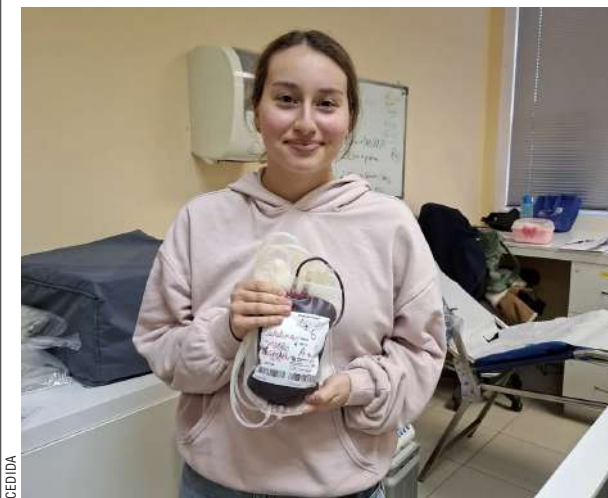
Estudiantes de la Universidad de Magallanes participaron de una jornada de donación altruista organizada por los estudiantes de Medicina de segundo año, quienes gestionaron la colecta en sus dependencias para ser entregadas al Banco de Sangre del Hospital Clínico Magallanes.