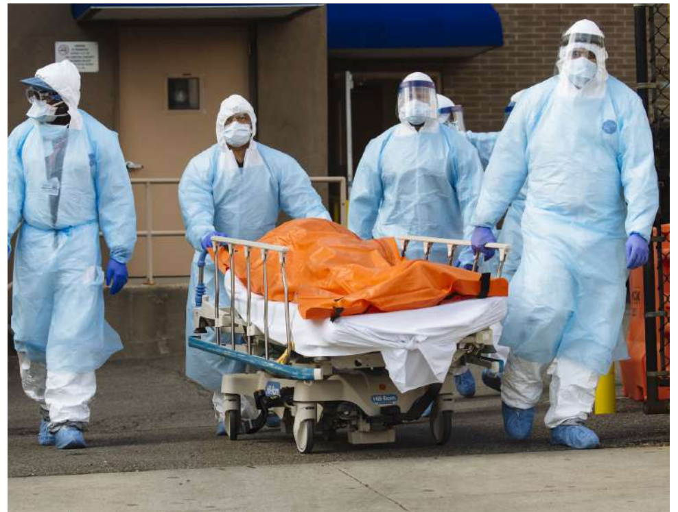
Las muertes en exceso a nivel mundial alcanzaron su punto máximo en 2021.

“En 2023, la esperanza de vida mundial de las mujeres había vuelto a los niveles previos a la pandemia, mientras que la esperanza de vida de los hombres y la esperanza de vida saludable para ambos sexos se mantienen ligeramente por debajo, lo que refleja una recuperación mundial amplia, pero desigual”, señaló Labrique.