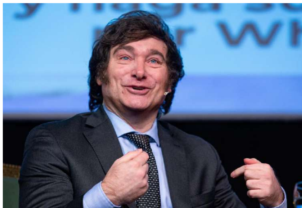
El Presidente Javier Milei celebró las cifras respecto de la inflación.

En 2006, el entonces Gobierno del peronista