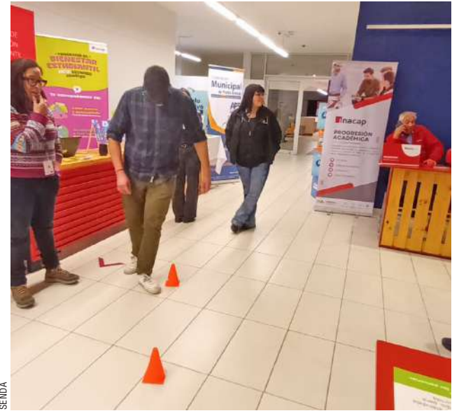
Los estudiantes conocieron la perspectiva con lentes de realidad virtual.

● A través de circuitos y dinámicas interactivas, los alumnos experimentaron de forma segura la pérdida de equilibrio y reflejos que provocan estas sustancias, buscando generar conciencia sobre los riesgos de conducir bajo sus efectos.