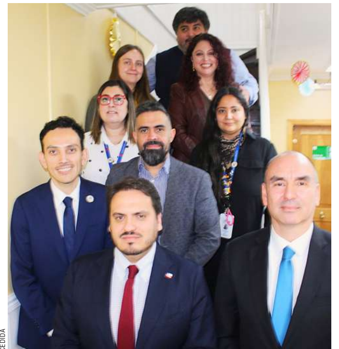
A través del trabajo de la “triada psicossociojurídica”, el programa ha logrado hitos relevantes en Magallanes desde su creación en 2019.

Su incidencia ha traspasado lo judicial para impactar en la política pública regional, facilitando incluso la generación de condiciones para la implementación de dos residencias de administración directa del Estado en la región.