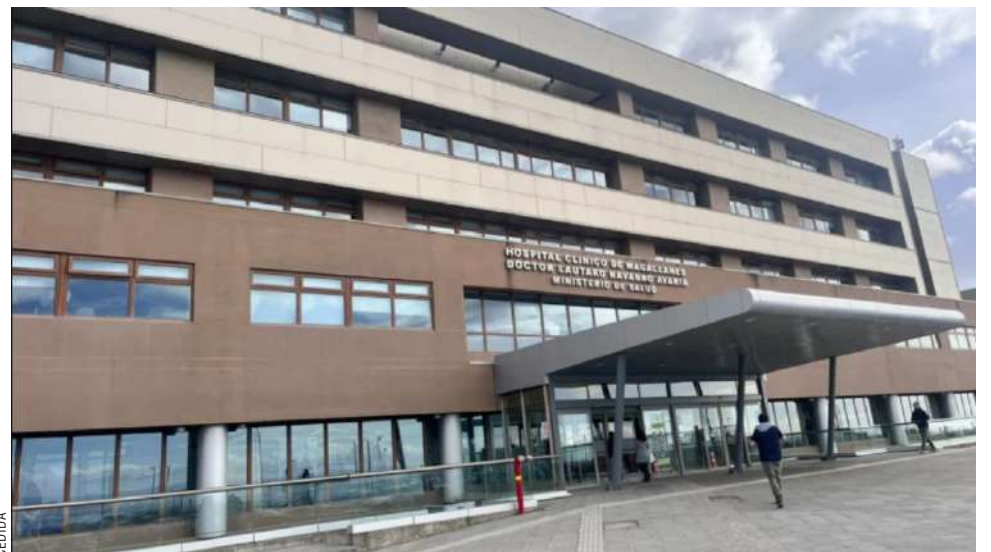
Los gremios vuelven a defender los recursos asignados para Magallanes.