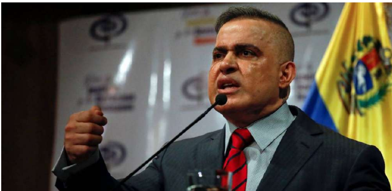
El fiscal Tarek William volvió a arremeter contra Chile por el caso Ojeda.

“Por lo tanto, no estarían teniendo refugio ni respuesta ante solicitudes que, entiendo, particularmente hizo la familia en este país vecino. Respetamos, obviamente, la decisión que vaya a tomar y, fruto de su propia reflexión, la familia del exteniente Ojeda, pero en estos momentos se encuentran de vuelta en Chile”, agregó.