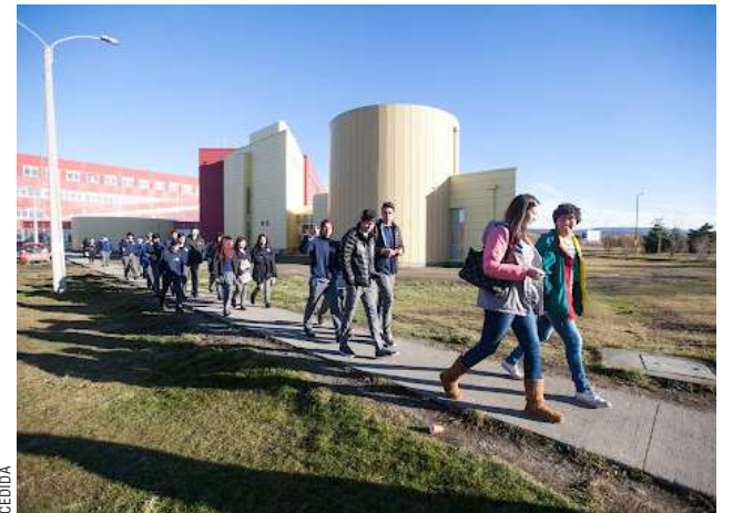
El 3,9% del total de matriculados en el nivel superior educativo representa el 0,5% del país.

La contraparte, es la situación que ocurre cuando