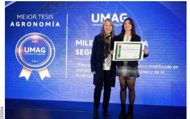
La tesis fue realizada en el marco de un proyecto financiado por FIA y ejecutado por INIA.

“Este estudio no solo proporciona una base de datos valiosa sobre las prácticas de pastoreo en Magallanes,