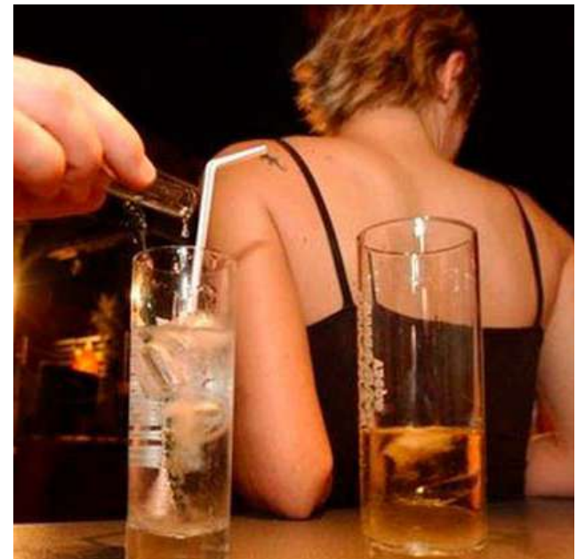
Droga y alcohol, mezcla perfecta para acometer delitos.

Según acusaron, en ese entonces se les nubló la vista y perdieron la conciencia.