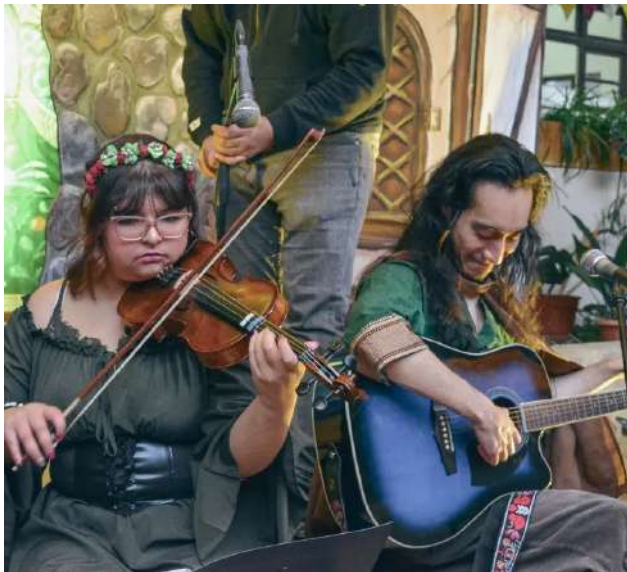
Vestidos a la época, jóvenes ofrecieron espectáculos de música medieval.

“Uno de los aspectos que más destacamos y agradecemos es la red