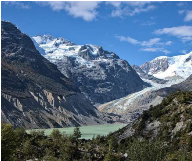
El plan es liderado por el MOP.