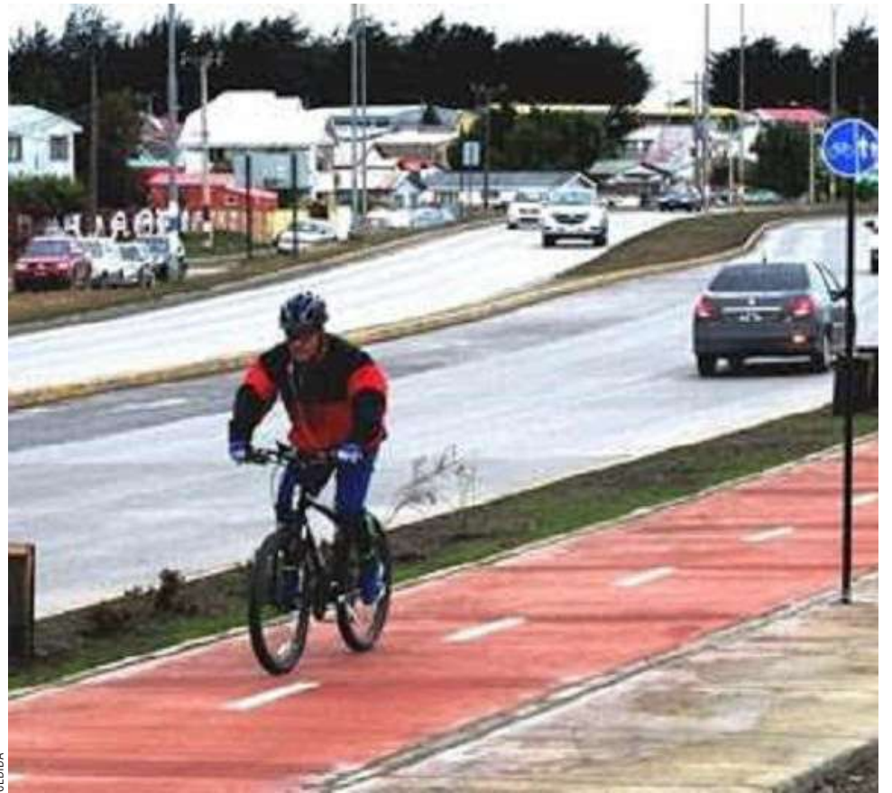
De acuerdo a lo expresado, habrá que esperar meses para verlas mejoradas.

Agregó que “la mantención se tiene que hacer en buenas condiciones, ya que nuestra ciudad por su clima hace que esto sea