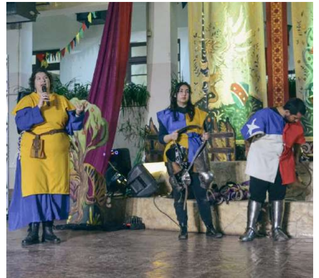
Los duelos de espadas, fue uno de los principales atractivos para los asistentes.

de apoyo y colaboración, porque todos los artistas y los elencos que se presentan en diferentes