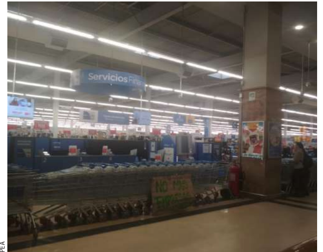
La empresa informó que desde hoy Supermercado Lider reabre en sus horarios habituales.

A su vez, la empresa declaró: “La Federación nos