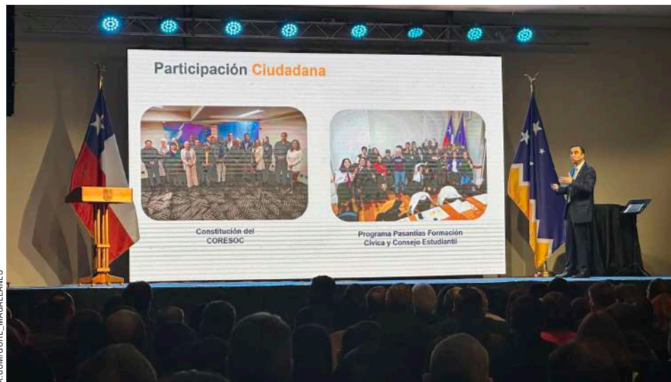
Las más altas autoridades regionales asistieron al evento del gobernador en Punta Arenas.