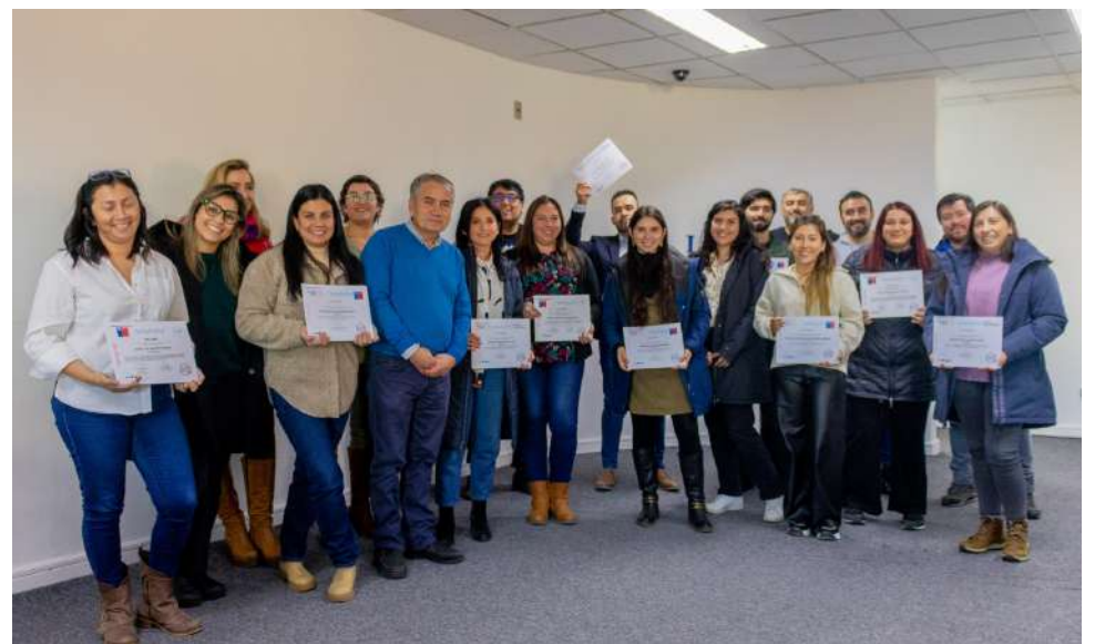
Los funcionarios recibieron sus certificados una vez finalizada la jornada de participación.

Dada la alta convocatoria del proceso de capacitación, los certificados fueron entregados a los directores de cada uno de los proyectos desplegados en la región. Algunas de las especializaciones con mayor demanda fueron la diversidad sexogenérica, así como herramientas para combatir la violencia transgeneracional y el trauma complejo, materia que estudia cómo las vulneraciones dentro de la familia impactan negativamente el desarrollo de niños, niñas y adolescentes.