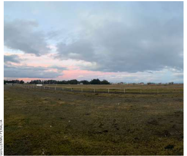
El Club Hípico se encuentra en proceso de expropiación.