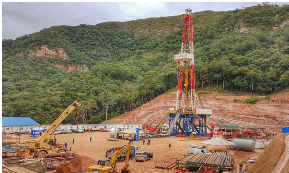
La buena noticia para Bolivia la entregó su propio Presidente Luis Arce.

El Mandatario no precisó a cuánto subirán las reservas del carburante en el país, pues la estatal petrolera YPF se encuentra en la fase de contratación de una empresa