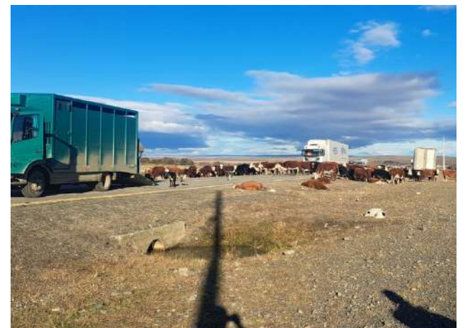
Esta fotografía circuló por las redes sociales durante la jornada de ayer, evidenciando la pérdida de los animales.

Finalmente, todos los antecedentes del caso fueron puestos a disposición de la autoridad correspondiente para determinar las responsabilidades civiles y las circunstancias exactas que desencadenaron este fatal encuentro en la ruta.