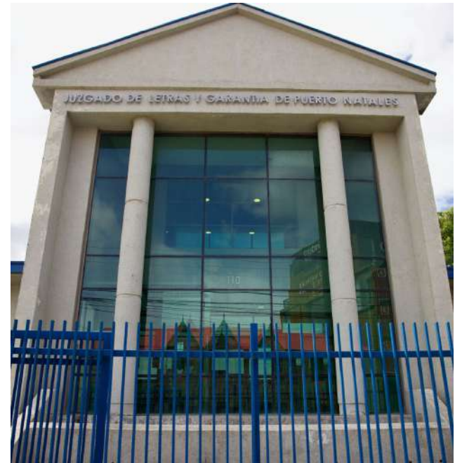
El Juzgado de Garantía de Puerto Natales rechazó emitir la orden de captura.

Finalmente, el municipio informó que ha iniciado un análisis jurídico riguroso para determinar posibles acciones legales y oficiará a las instituciones correspondientes para asegurar el total esclarecimiento de lo sucedido.