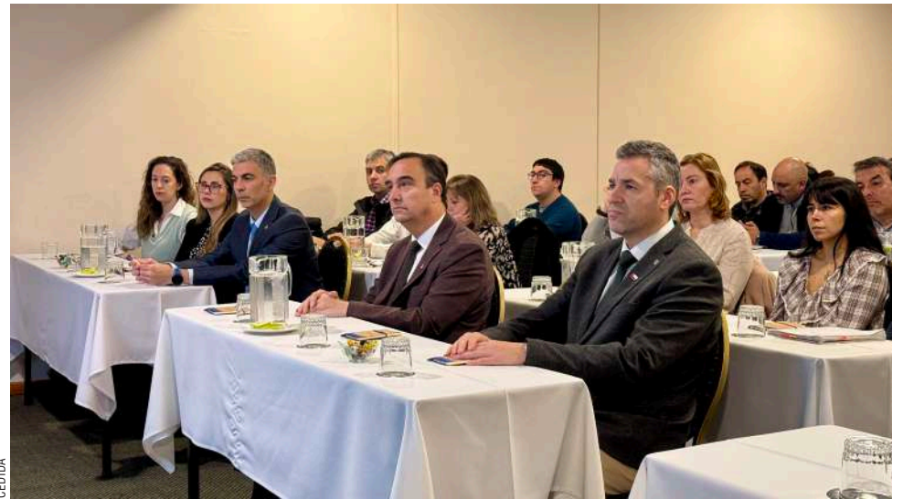
Las autoridades buscan ordenar el manejo de áridos y poner fin a la actividad clandestina.

“Los últimos años ha sido básicamente un crecimiento solamente de iniciativa privada y probablemente con falta o diversidad de ordenamiento territorial (...) Eso va a exigir que podamos tener reubicaciones del proceso cantera. Esa reubicación, sobre todo con la nueva ley, con lo que significa tanto las declaraciones de impacto ambiental como estudio de impacto ambiental y, particularmente, la identificación de los territorios con orden territorial, va a ser un tema fundamental. Estoy totalmente de acuerdo que obviamente una cantera en medio de la ciudad ya hoy día tiene que buscar una reubicación”.