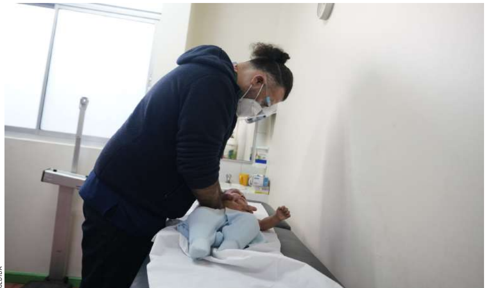
Los recursos permiten que las salas de los Cesfam estén habilitadas de 8 a 20 horas.

Añadió que estos refuerzos permitieron que las salas respiratorias mantenen-