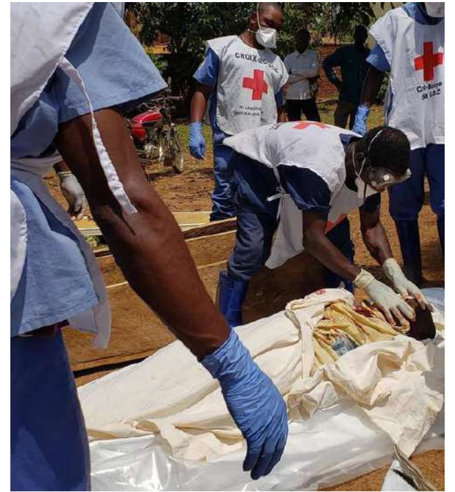
El nuevo registro de este virus comenzó a circular a finales de abril pasado.

La segunda es la vacuna “ChAdOx” desarrollada por la Universidad de Oxford que está acelerando el proceso de fabricación, mientras que la tercera, “VSV-BDBV”,