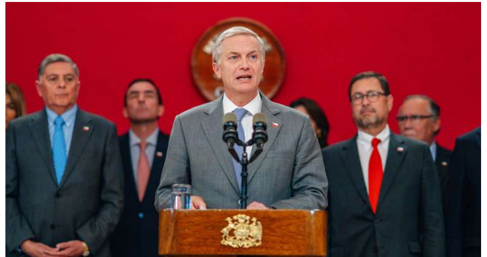
Kast dedicó sentidas palabras para las ministras salientes.