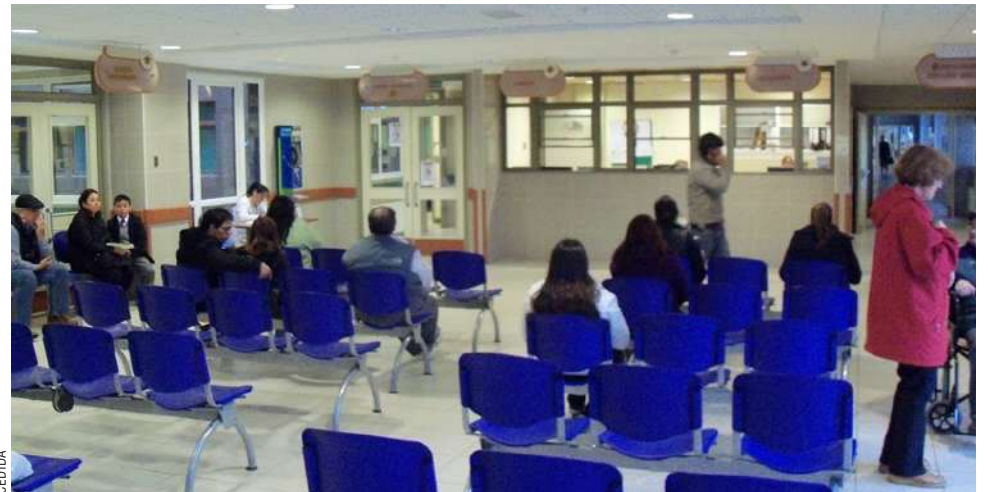
Se espera la mayor circulación de virus respiratorios en la zona en próximas semanas.

“No obstante, se proyecta un aumento tanto de las consultas ambulatorias como de la demanda hospitalaria durante las