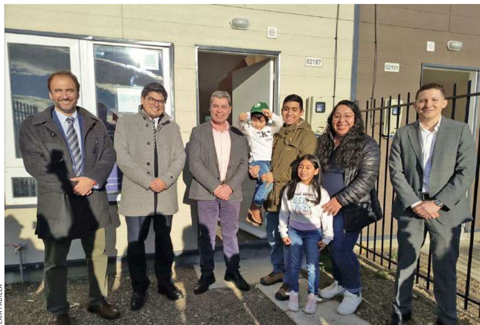
Familias de Magallanes celebran la entrega de viviendas en Valles Los Sauces.

Por su parte, la delegada presidencial, Ericka Fariás, subrayó la emoción de acompañar a las familias: