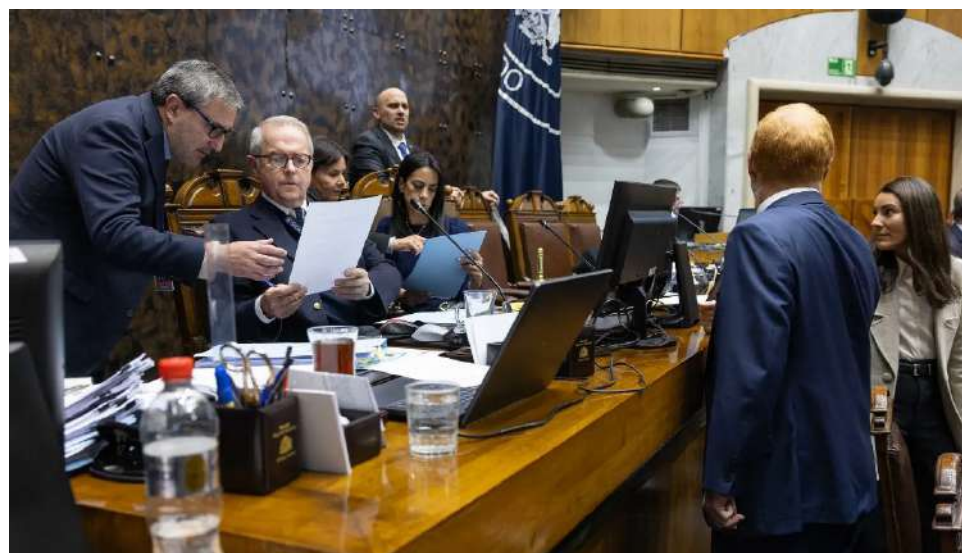
El proyecto fue despachado a su tercer trámite legislativo.

Se podrá solicitar al estudiante mostrar o vaciar el contenido de los bolsillos. Si se hallaren elementos potencialmente peligrosos, se deberá comunicar de mane-