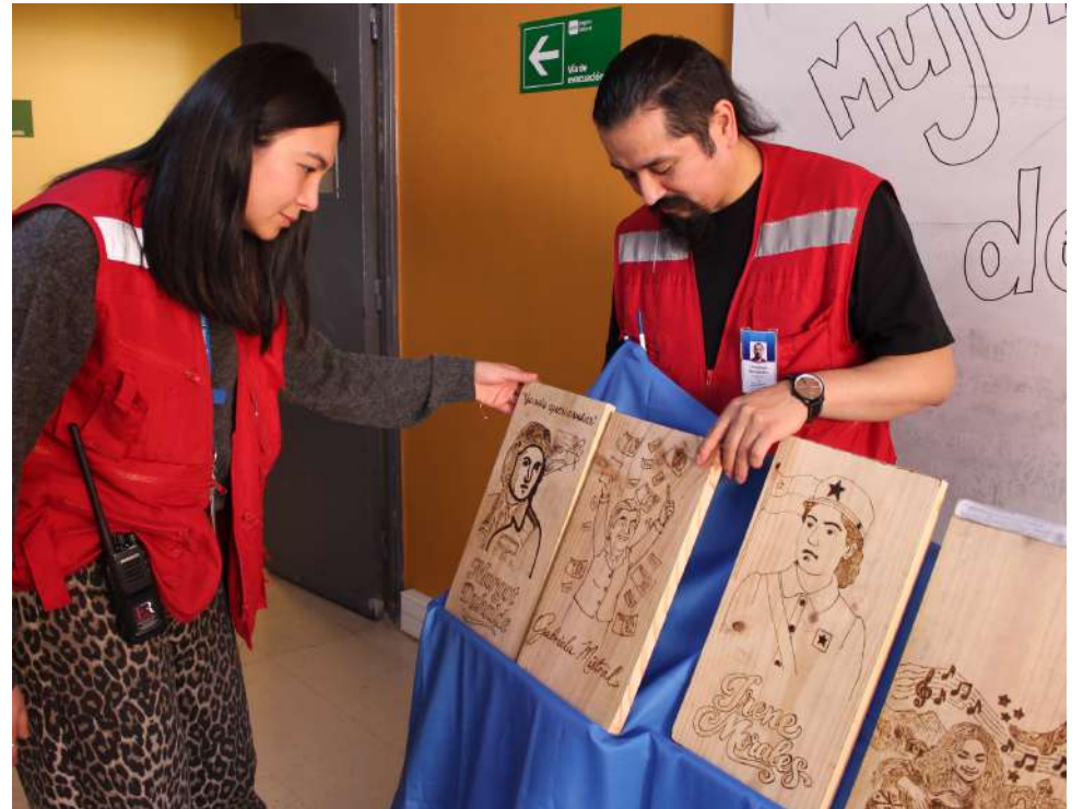
Los jóvenes participaron de las actividades que le permiten sumar para su reinserción.

El taller, que forma parte de las actividades socioeducativas en materia de género para deconstruir prejuicios y estereotipos, permitió a los jóvenes relevar la vida de 16 mujeres chilenas de distintos ámbitos, entre las que destacaron Margot Duhalde, Violeta Parra, Irene Morales y Marlene Ahrens.