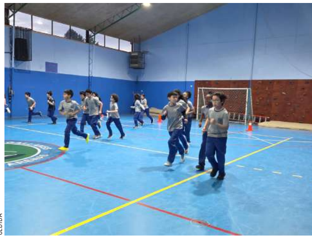
Estudiantes de la Escuela Hernando de Magallanes participaron de la instancia.