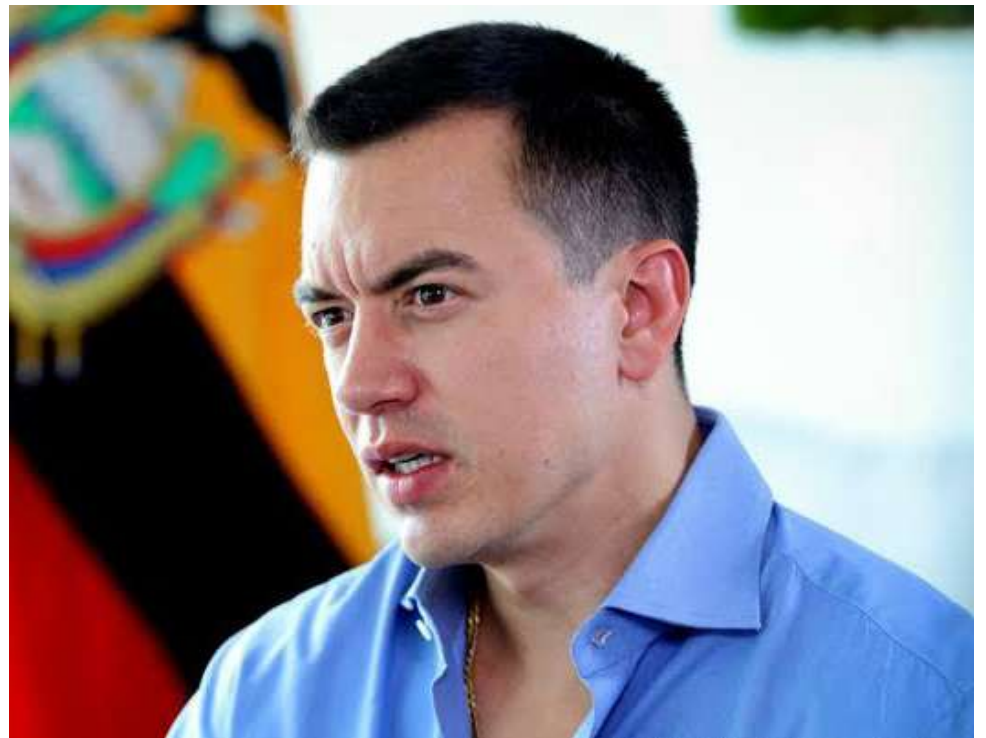
El Presidente de Ecuador, Daniel Noboa, propuso una insólita idea para la Antártica.

Al final del mencionado artículo, John Lee Anderson, lleno de interrogantes por la idea de construir una cárcel en la Antártida y si seguía sobre la mesa, señaló que Noboa “dijo que su asistente lo había investigado: Al principio, dijeron que sólo se podían tener estaciones de investigación científica”.