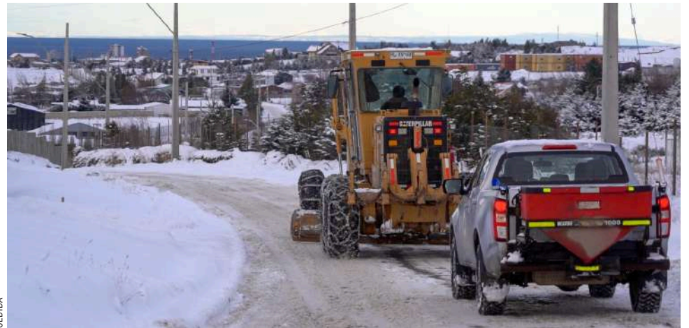
El municipio de Punta Arenas continúa con el despeje de vías de tránsito en la ciudad.

Otro punto consultado fue respecto de la central de llamados de emergencia: “Nosotros no tenemos central. Todos los llamados se realizan e ingresan a través de la línea 800-801-34, los cuales en su mayoría son por despeje de nieve o esparcido de sal. Si bien a todos los veci-