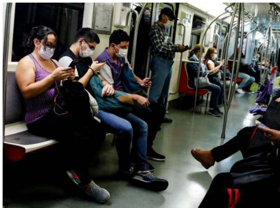
La pandemia y el estallido golpearon fuerte la calidad de la población del Gran Santiago.

En términos agregados, 12 comunas fueron las más afectadas por el aumento conjunto de la inseguridad y la pobreza, las que se ubican principalmente en la zona centro y norte del Gran Santiago. Y asimismo, 16 comunas, del centro y sur de la ciudad, concentraron los impactos negativos de una menor actividad de construcción y de comercio post estallido social y pandemia.