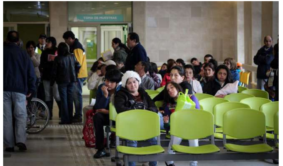
Los principales retrasos se dan en las consultas de oftalmología, hipoacusia y en detecciones del cáncer.