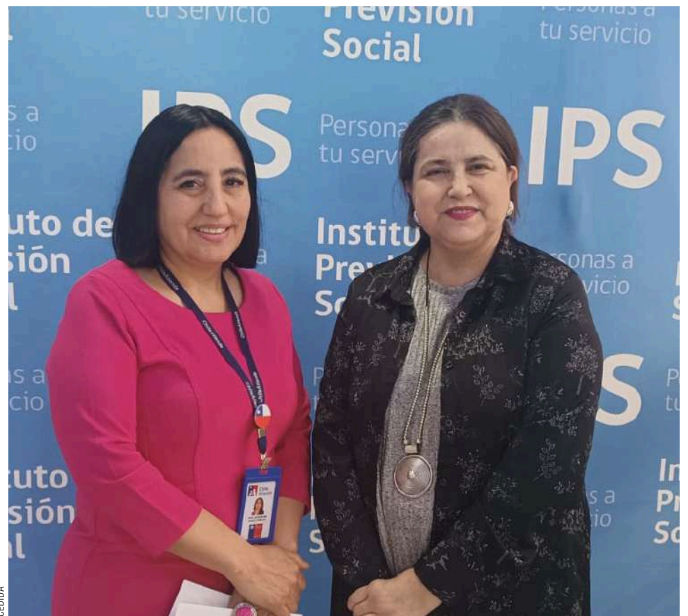
El bono fue entregado de manera automática durante el mes de mayo.

En Punta Arenas, el número total de pensionados/as beneficiarios fueron 11.591 personas; en tanto, en Puerto Natales fueron 3.085 bonos entregados; y, por último, en Porvenir, un total de 605 magallánicos beneficiados con esta ayuda económica.