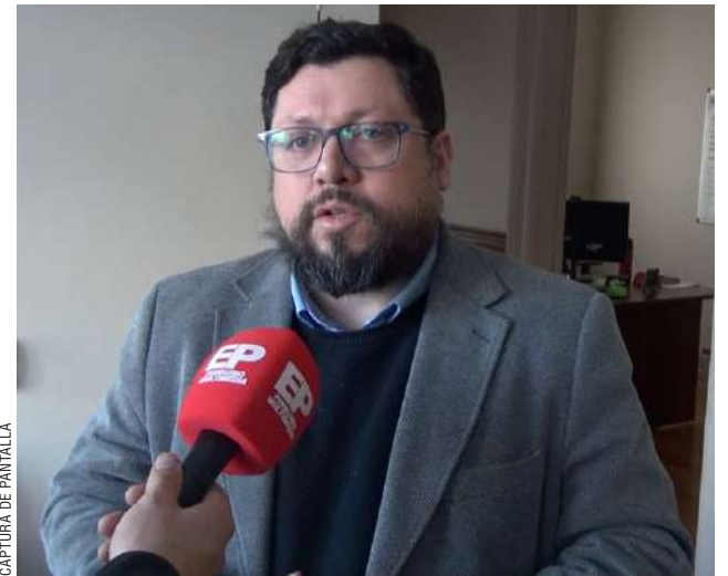
CAPTURA DE PANTALLA

Sobre gasificar el periurbano, detalló que “en los periurbanos de Monte Verde, de camino al Club Andino, Gasco está haciendo la construcción de un ducto a esa zona. También hay fondos públicos destinados para llegar con gas a Ojo Bueno,