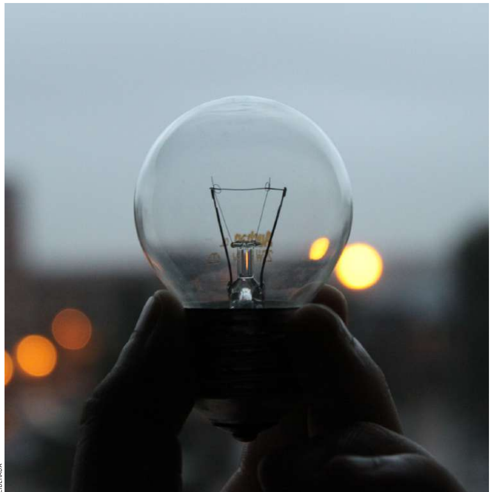
Se prevé que el alza será de aproximadamente 13% para los usuarios de Magallanes.

En cuanto a las regiones más afectadas, en Valparaíso, aquellos con gastos mensuales inferiores a $45 mil enfrentarán un incremento del 21%, mientras que en Copiapó y Puerto Montt el alza podría alcanzar el 33% y 32%, respectivamente. Para aquellos cuyos gastos superen los $65 mil, los aumentos serán del 39% en Santiago, 51% en Copiapó y 37% en Puerto Montt.