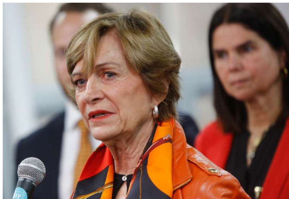
Matthei puso como ejemplo San Ramón en denuncia de financiamiento del narco a la política.

Por su parte, el fiscal nacional, Ángel Valencia, dijo no conocer el detalle de las declaraciones de la alcaldesa de Providencia, sin embargo, hizo un llamado a que "cualquier persona que tenga información acerca de hechos como los que ella señala, de posibles pagos o amenazas, lo que esperamos es que nos aporte a la justicia, porque serían situaciones graves y que, por supuesto, tenemos que investigar".