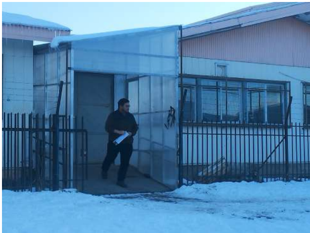
Ayer se percibía algo de inconformidad en los rostros de los postulantes.

A su vez, reconoció que la prueba de Matemáticas estaba bien, pero con la de Lenguaje solo hubo que leer