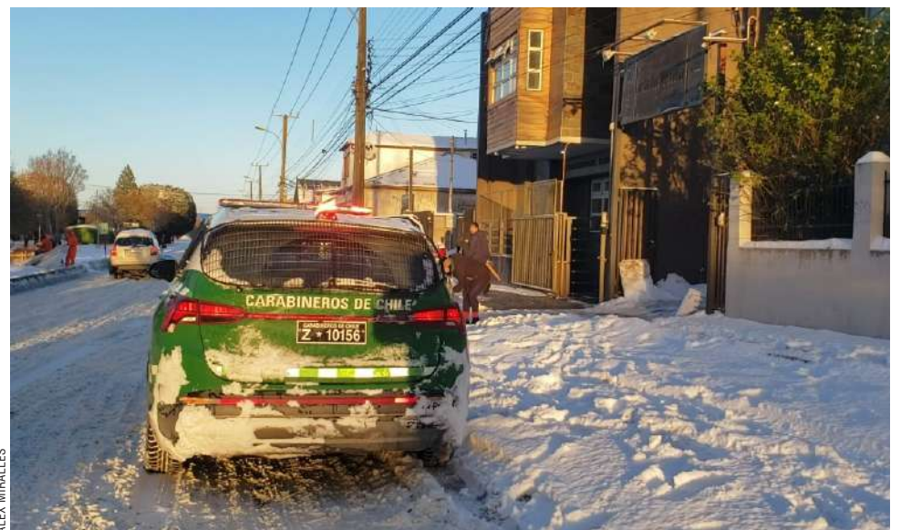
El hecho ocurrió la mañana del martes, al interior de la residencia del Hogar de Cristo.

dos hombres al interior de una residencia, de una hospedería ubicada en Punta Arenas, sin justificación alguna, con golpes de puño en el rostro de las personas, al tiempo que profería en su contra dichos de carácter homofóbico. Es por ello que se le requirió en simplificado. El sujeto admitió responsabilidad en los hechos y fue condenado, y pese a que las lesiones fueron de carácter leve, se tomaron las agravantes conocidas como Ley Zamudio (no discriminación). De esta manera, quedó sujeto a la prohibición de acercarse a las víctimas y hacer ingreso a la hospedería ubicada en el Centro de Punta Arenas”, señaló el fiscal Ricardo Torres.