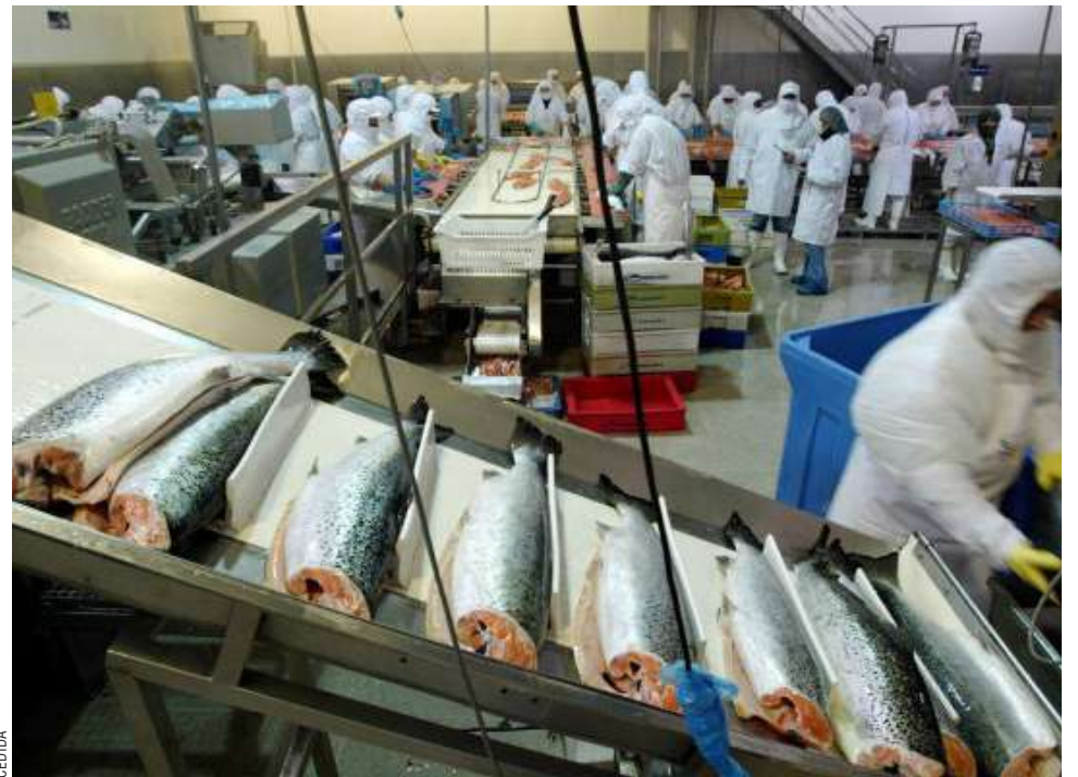
Actualmente el 91% de los colaboradores directos de AquaChile residen en la misma región donde trabajan.