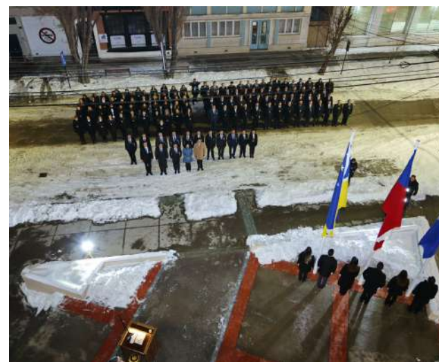
La lista solemne es un acto que realiza año a año la PDI en el frontis de su cuartel de calle Errázuriz.