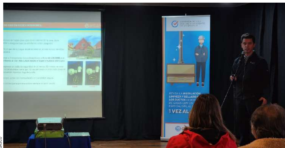
Gasco entregó diversas recomendaciones a la comunidad de Porvenir.

Dentro de las recomendaciones generales que incluye