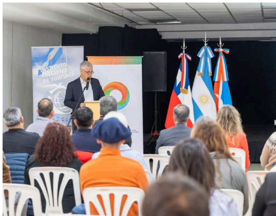
El encuentro se desarrolló en la ciudad argentina de Río Grande.

La presentación contó con la participación de autoridades provinciales, el cónsul general de Chile en Río Grande, representantes de fuerzas de seguridad, cámaras de comercio y actores del sector turístico.