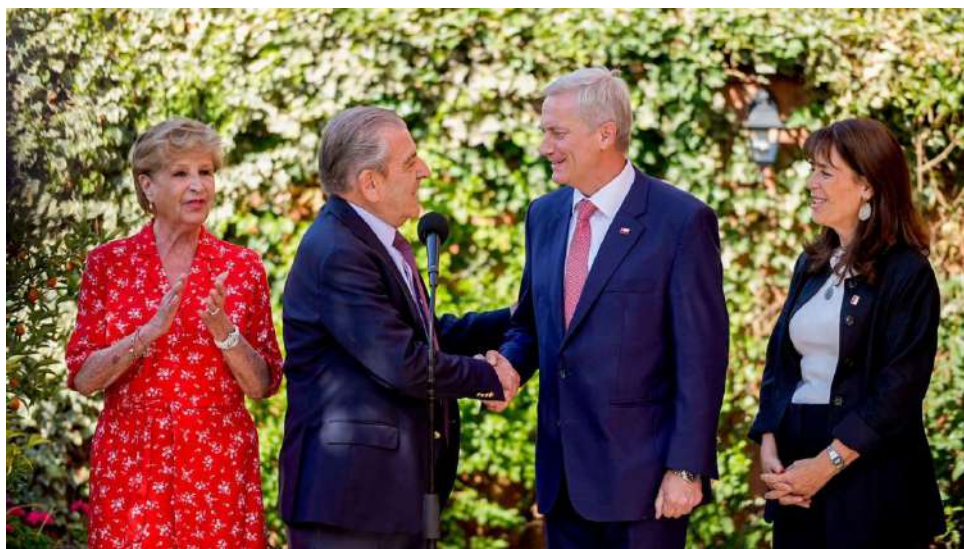
El electo Kast sostuvo una nueva reunión con el exPresidente Eduardo Frei.

Por su parte, Eduardo Frei aseguró: “Con mi señora, con mis hijas, los hemos recibido, hemos tenido una larga conversación. Ha sido muy amena, muy familiar y también mirando a Chile. Yo estoy aquí para decir que como