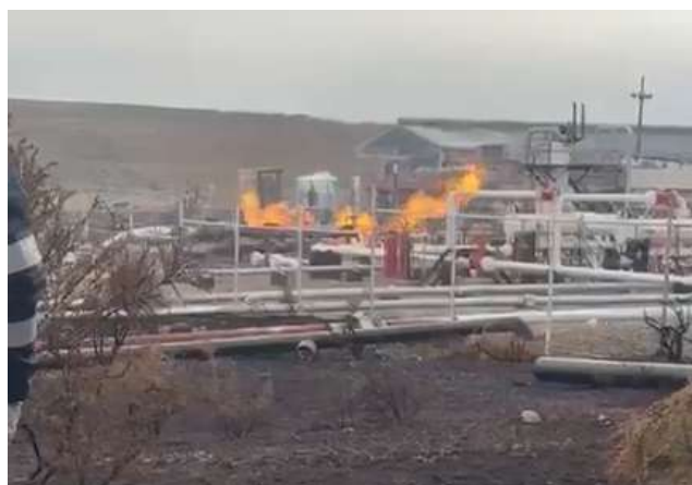
Al mediodía ya la llama que generó la emergencia bajó considerablemente en comparación a la madrugada.

El Seremi de Energía, Sergio Cuitiño, explicó la estrategia de priorización