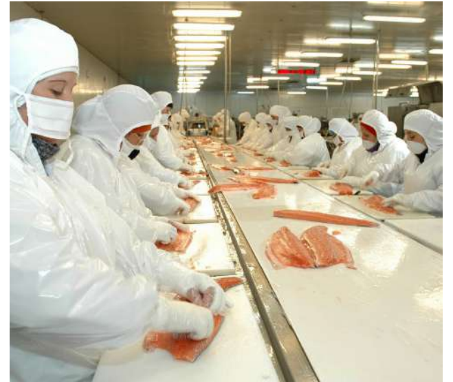
La industria del salmón cerró 2025 con una fuerte recuperación, impulsada por mejores resultados financieros de las principales empresas.

● La recuperación financiera de las principales salmoneras y el fuerte crecimiento productivo en Magallanes confirman un cierre de año positivo para la industria.