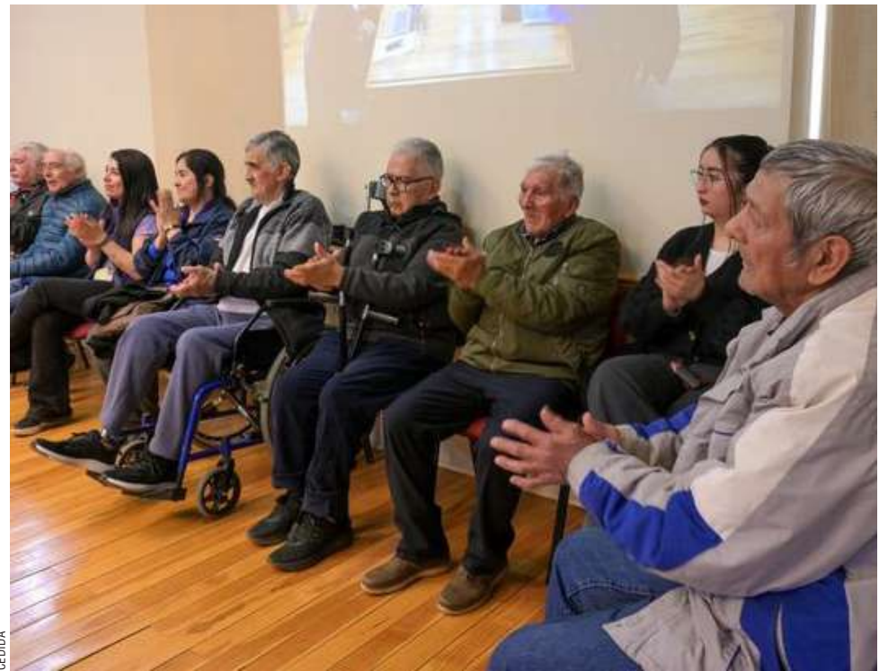
Desde que asumió las funciones, la Fundación ha surfado olas económicas.

Se espera que en los próximos días, Senama entregue la documentación de prórroga para realizar las transferencias del Fondo Subsidio Eleam.