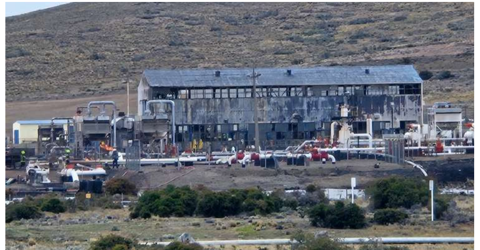
En esta condición quedó la zona de compresores en la planta Posesión, con daños estructurales.

A pesar de la magnitud del incendio, se confirmó que sólo una persona resultó lesionada. El trabajador fue evacuado de urgencia en helicóptero hacia el Hospital Clínico de Magallanes. Tras la reunión del Comité de Gestión del Riesgo de Desastres