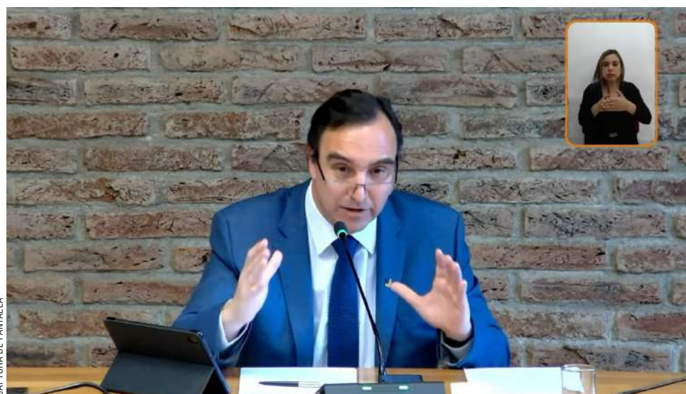
El gobernador Jorge Flies aseguró ante el Consejo que la idea ya se había conversado con los alcaldes, lo cual fue desmentido por la Amumag.

Asimismo, el oficio requiere clarificar los procedimientos aplicables en caso de estimarse que el gobernador proporcionó