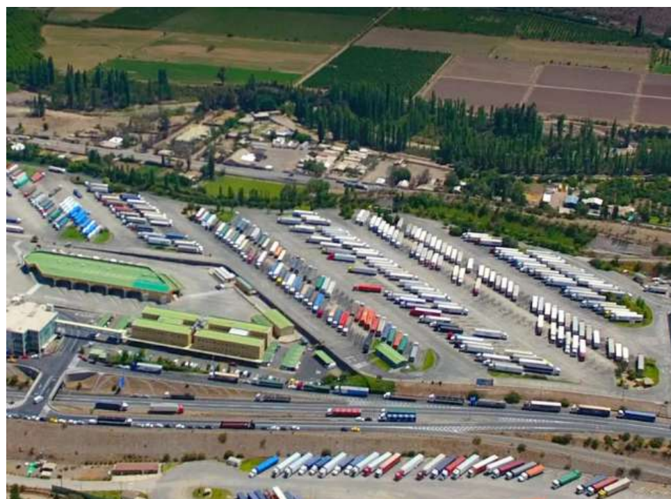
El resulta constituye un alivio temporal para las empresas del sector tras varios meses de alzas acumuladas.

Con estas variaciones, el Índice de Costos del Transporte alcanzó 108,62 puntos en noviembre de 2025, mientras que el índice sin combustibles se situó en 114,31 puntos. Las cifras reflejan un escenario de alivio parcial para el sector transporte, aunque los costos continúan acumulando incrementos a lo largo del año.