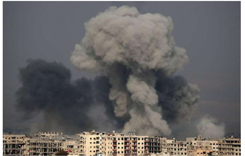
La ofensiva abarcó más de 70 objetivos en el centro de Siria, para lo cual se utilizaron aviones, helicópteros de ataque y artillería.

Según un funcionario estadounidense anónimo citado por el diario The New York Times, decenas de presuntos emplazamientos del EI en varios puntos del centro de Siria fueron atacados con cazas de combate, helicópteros de ataque y salvas de artillería y se espera que los bombardeos duren varias horas.