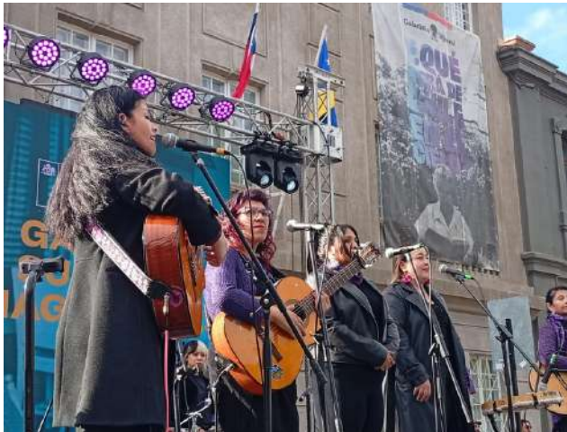
“Mousai” interpretó un inédita canción que relevó el paso de Mistral por Magallanes.