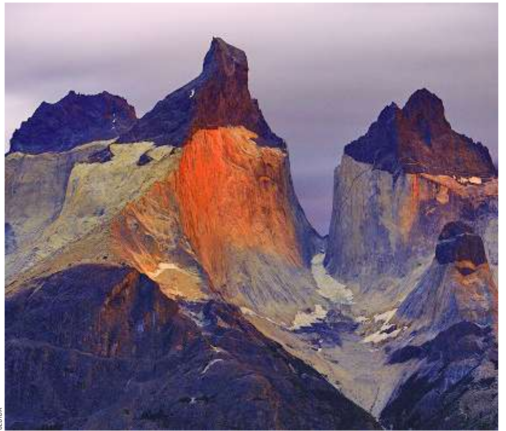
La octava maravilla del mundo podría recibir menos turistas el próximo año debido a la fuerte alza de precios en la entrada al parque.