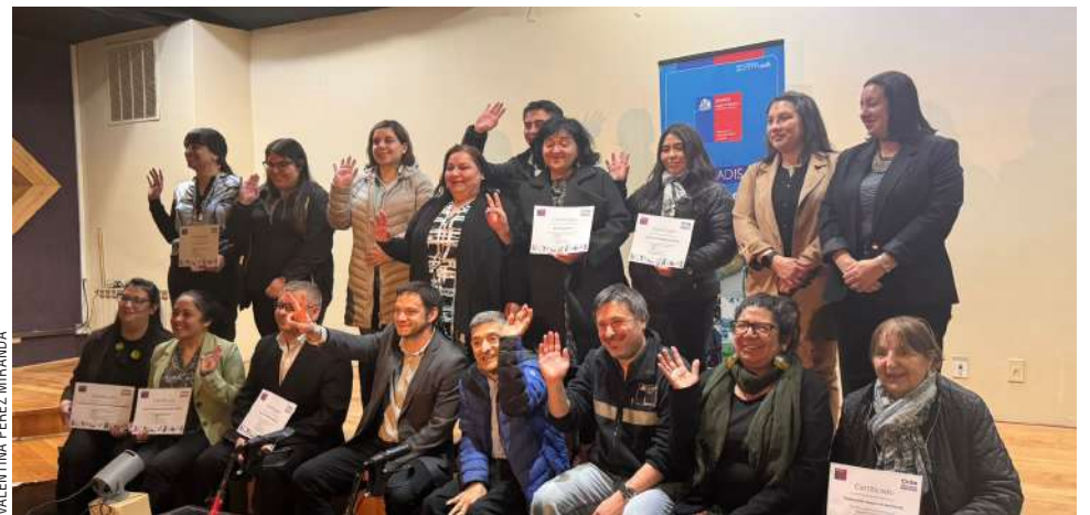
Sonrisas, compromiso y trabajo colaborativo marcaron la entrega simbólica de fondos para iniciativas de inclusión en la región.

En el Programa de Desarrollo Inclusivo Territorial se adjudicaron dos proyectos por $41.252.562 cada uno, ejecutados por el Servicio de Salud