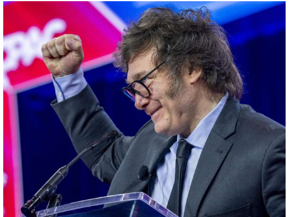
Milei celebró las cifras dadas a conocer durante las últimas horas en Argentina.

"Éste es el primer paso de un plan de lucha. Sigamos escucharnos, sigan los que están a nuestras espaldas sin escucharnos, y se encontrarán con la profundización de este plan de lucha. ¡Terminaremos en un paro nacional en todo el país!", amenazó el dirigente, que planteó que la reforma laboral recortará derechos, debilitará la negociación colectiva y profundizará la desigualdad social.