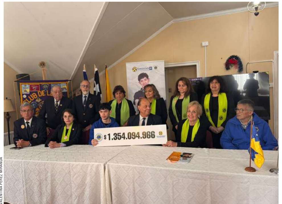
Emoción y alegría para los integrantes del Club de Leones deja el logro de esta gran cruzada solidaria.