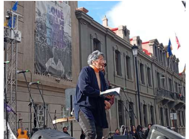
La actriz Yaya Vargas relevó el trabajo literario de la poetisa.