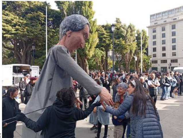
La muñeca gigante de Gabriela fue recibida por niños y adultos en la plaza.

● La Plaza de Armas de Punta Arenas se transformó en un escenario al aire libre, donde ocho proyectos musicales regionales y una intervención de danza rindieron tributo a la poeta.