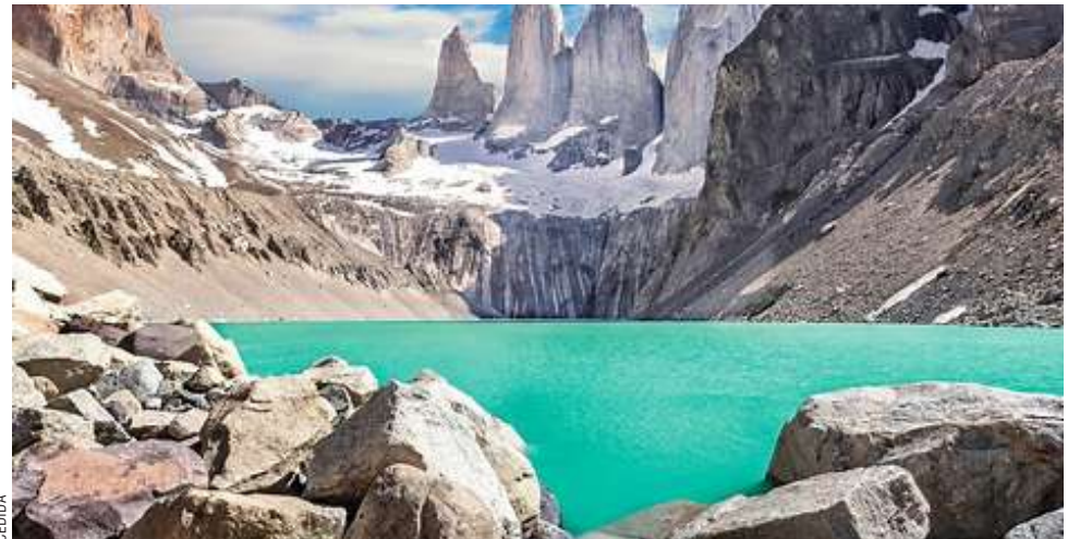
Los guardaparques se mantuvieron movilizados por varios días en Torres del Paine.

Otro de los puntos clave del acuerdo es la autorización del pago de horas extraordinarias a todo el personal de jornada transitoria, desde diciembre hasta el término de la temporada. Esta medida responde a la alta demanda de trabajo que implica la temporada alta de visitantes y busca reconocer el esfuerzo adicional que realiza el personal en este periodo. Asimismo, se implementará un sistema de trazabilidad y control de accesos, que permitirá monitorear de manera más eficiente el flujo de visitantes y mejorar la seguridad en los senderos y circuitos del parque.