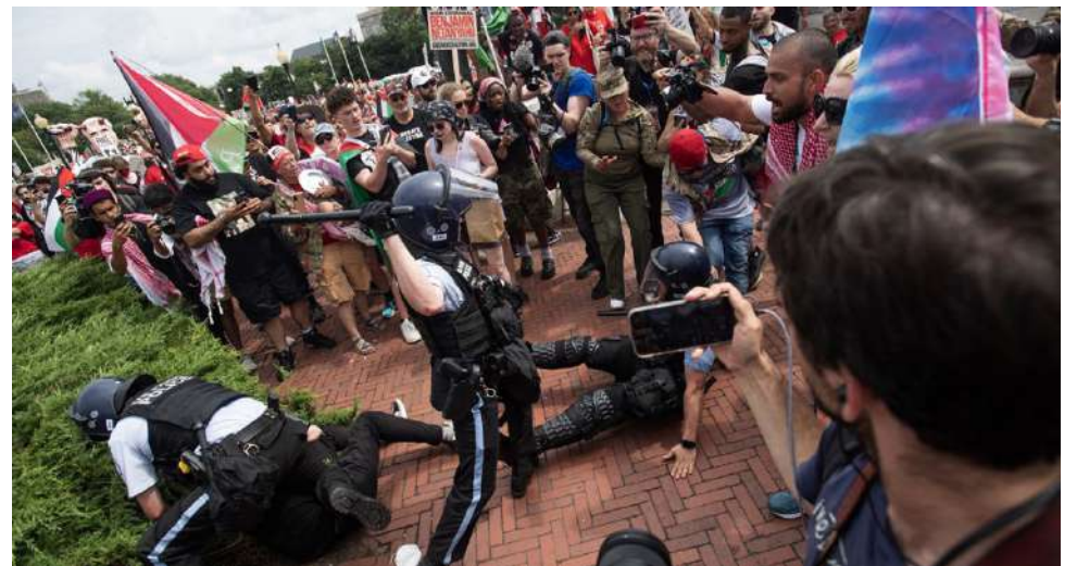
Hubo al menos 200 detenidos en masivas protestas en el Capitolio en rechazo a la visita de Netanyahu a EE.UU.

Los firmantes se comprometieron a mantener la implementación de estos acuerdos “para acabar con la división” entre ellas, que se lograron gracias al rol me-