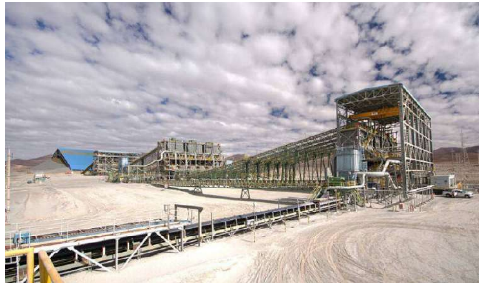
En 1992 se dictó una ley que permitió a Codelco asociarse con privados.

Freeport-McMoRan señaló que esperan que el proceso de permisos tarde alrededor de tres años, y que la construcción tome otros cuatro. Así, la operación comenzaría en 2033, con una estimación de 750 millones de libras de cobre al año, equivalentes a 340 mil toneladas de mineral, además de unos 9 millones de toneladas de molibdeno por ejercicio. Freeport tiene sede en Phoenix, Arizona, y opera en distintas partes del mundo.