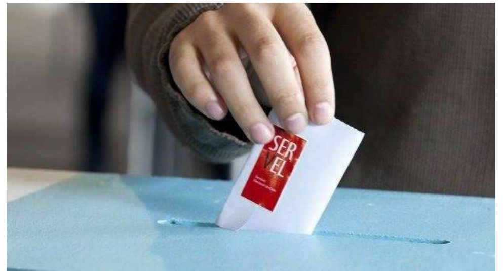
Los tiempos se acortan de cara a las elecciones de octubre próximo.