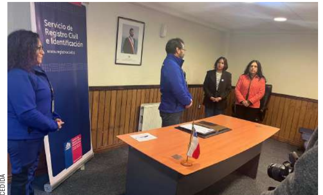
El Registro Civil, un servicio necesario en el desarrollo del país.

En el mismo sentido, Aranda indicó que “nosotros