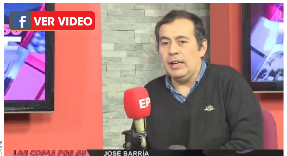
El candidato independiente a la Gobernación Regional participó en el programa “Las Cosas por su Nombre”.