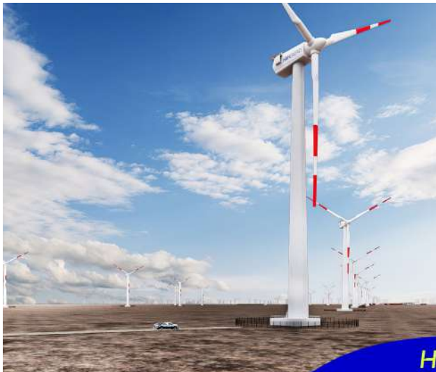
Un vasto parque eólico generará la energía limpia necesaria para el proceso.