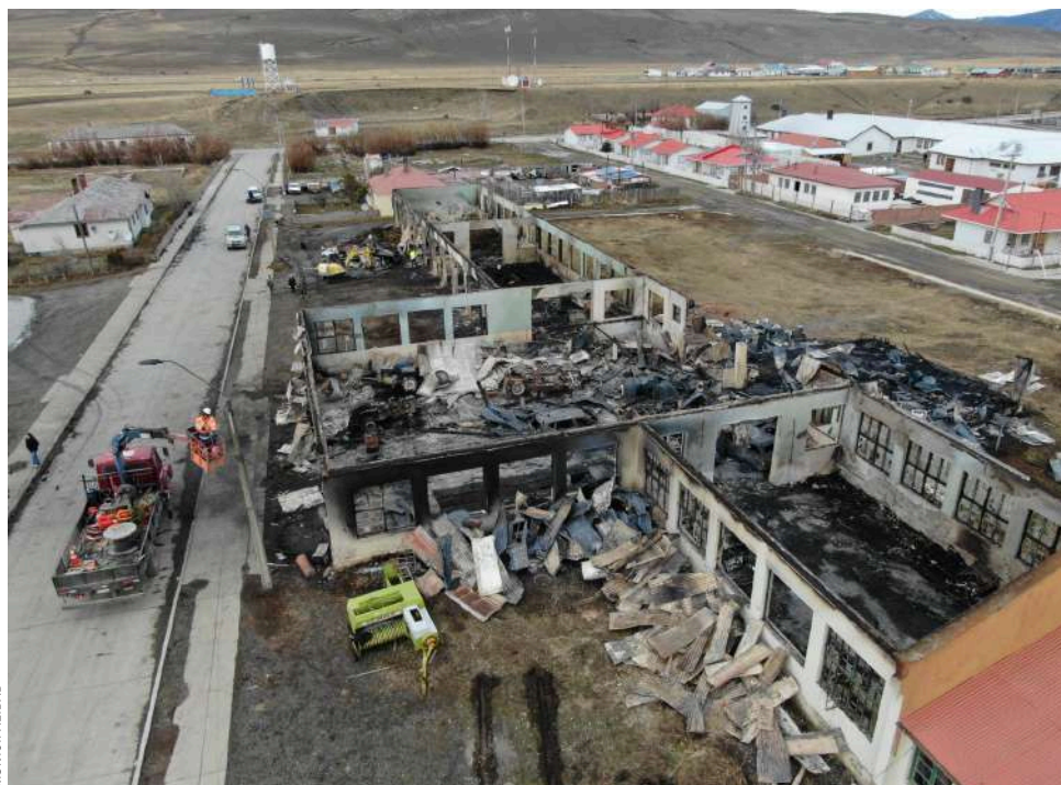
Este es el desolador panorama que dejó el incendio en la localidad de Cerro Castillo.

Finalmente, la alcaldesa se comprometió en seguir trabajando junto a su equipo en la restauración del entorno afectado en la localidad. “Quiero enfatizar y, que no quede duda, que esta alcaldesa va a trabajar para poder hermosear nuevamente esta villa y rescatar por supuesto la infraestructura histórica y patrimonial”.