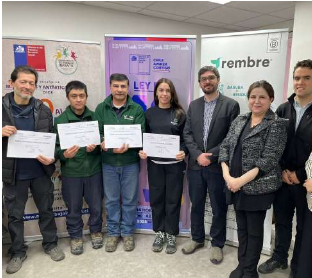
Dentro del grupo está la primera recicladora de base certificada por ChileValora en la región.