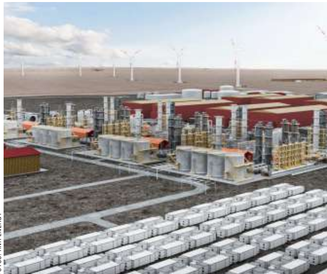
El corazón del proceso es la planta que elaborará el amoníaco verde que será exportado al mundo.

● Su valor asciende a 11 mil millones de dólares y es el mayor proyecto de inversión ingresado jamás en la historia de Chile al Sistema de Evaluación Ambiental.