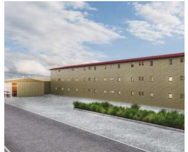
El campamento estará dotado de entre mil a tres mil camas y contará con agua y alcantarillado.