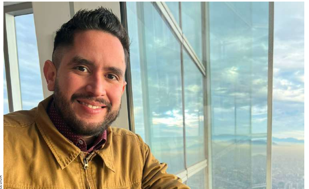
Suárez se mostró a favor de la votación en Chile de extranjeros “mientras cumplas los requisitos legales”.

Con la multa, prefiere no profundizar, sino que sea un tema más bien de chilenos. “Pero nosotros como venezolanos no nos tienes que estar presionando para que votes; nos gusta expresar la opinión y no hacerlo solo a través de redes sociales, sino también a través del voto”, concluyó.