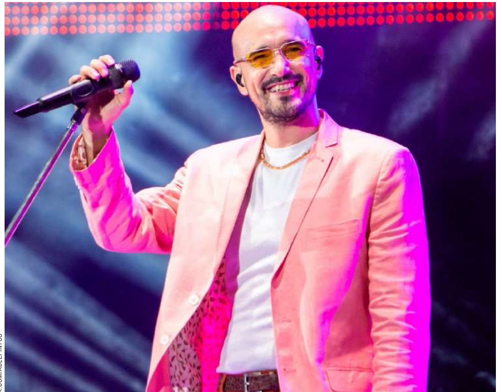
El cantante Abel Pintos será uno de los platos fuertes del evento.

Una buena noticia para los fanáticos de Abel Pintos, Daniela Mercury y Chequeño Palavecino.