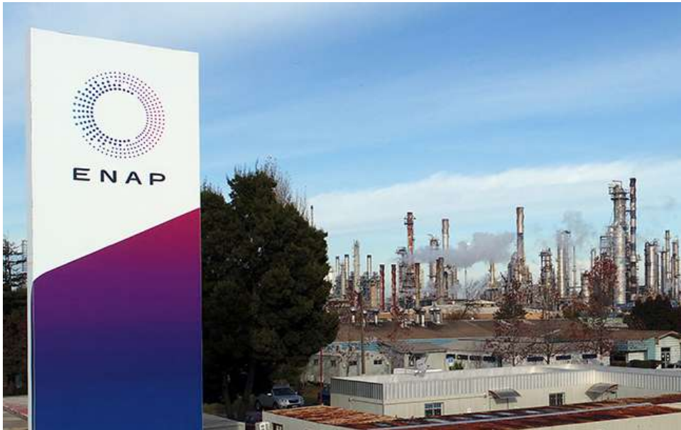
El libro de ofertas alcanzó los $4.800 millones, con la participación de cerca de 250 cuentas, lo que representa una sobredemanda de ocho veces el tamaño de la emisión.