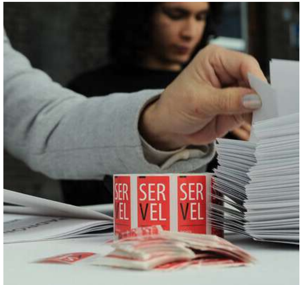
Otro aspecto que el Gobierno busca reponer es el feriado irrenunciable para los comicios de octubre, eliminado en la Cámara Alta.

Cabe destacar que existen normas que ya fueron aprobadas en la tramitación de este proyecto, como por ejemplo el voto con lápiz pasta azul, el uso de dos cámaras secretas por mesa y el fin de la ley seca.