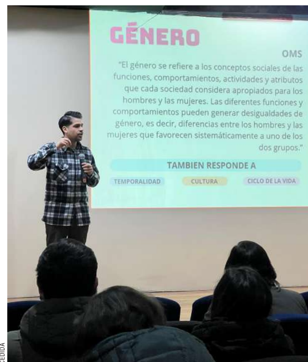
Un aspecto de la jornada desarrollada el pasado martes.

Se puede revisar más del trabajo de esta organización de la sociedad civil en: https://www.instagram.com/liberando.colores/ .