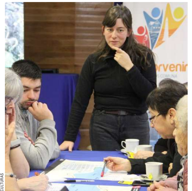
La comunidad planteó su opinión respecto de los lugares que deben ser considerados en la Ruta de la capital fueguina.

levantamiento de información nos permite validar esta propuesta vinculada a la identidad y cultura local”.