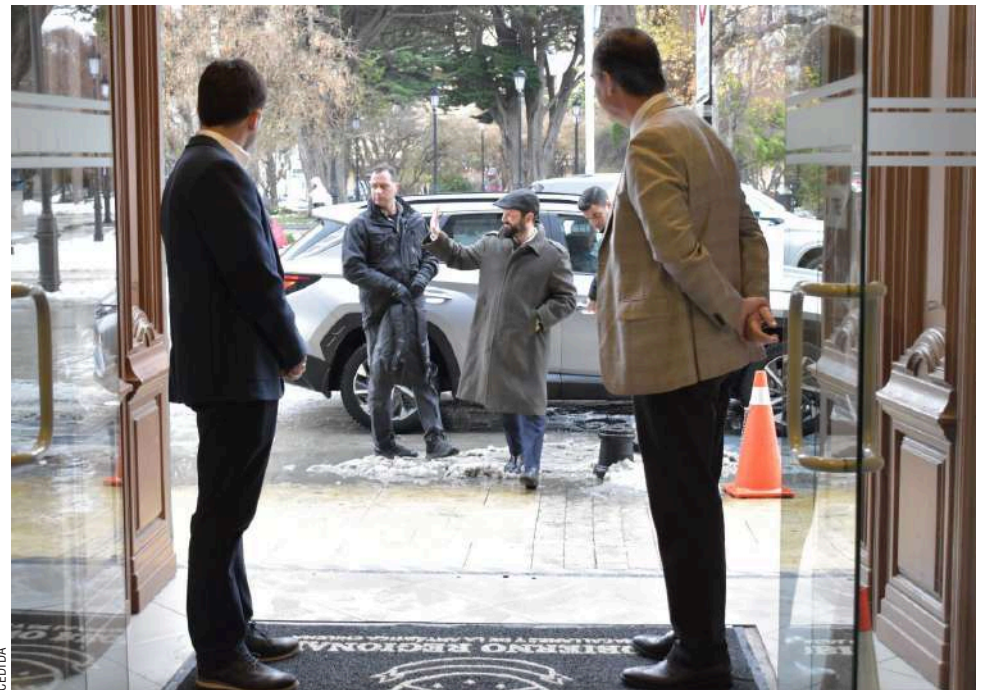
El Presidente Gabriel Boric se reunió ayer con autoridades regionales, comunales y parlamentarios.

“Pudimos conversar del trabajo que estamos haciendo y que está muy avanzado del Plan de Zonas Extremas y lo que está siendo sensibilizado con Subdere y el Ministerio de Hacienda, para posteriormen-