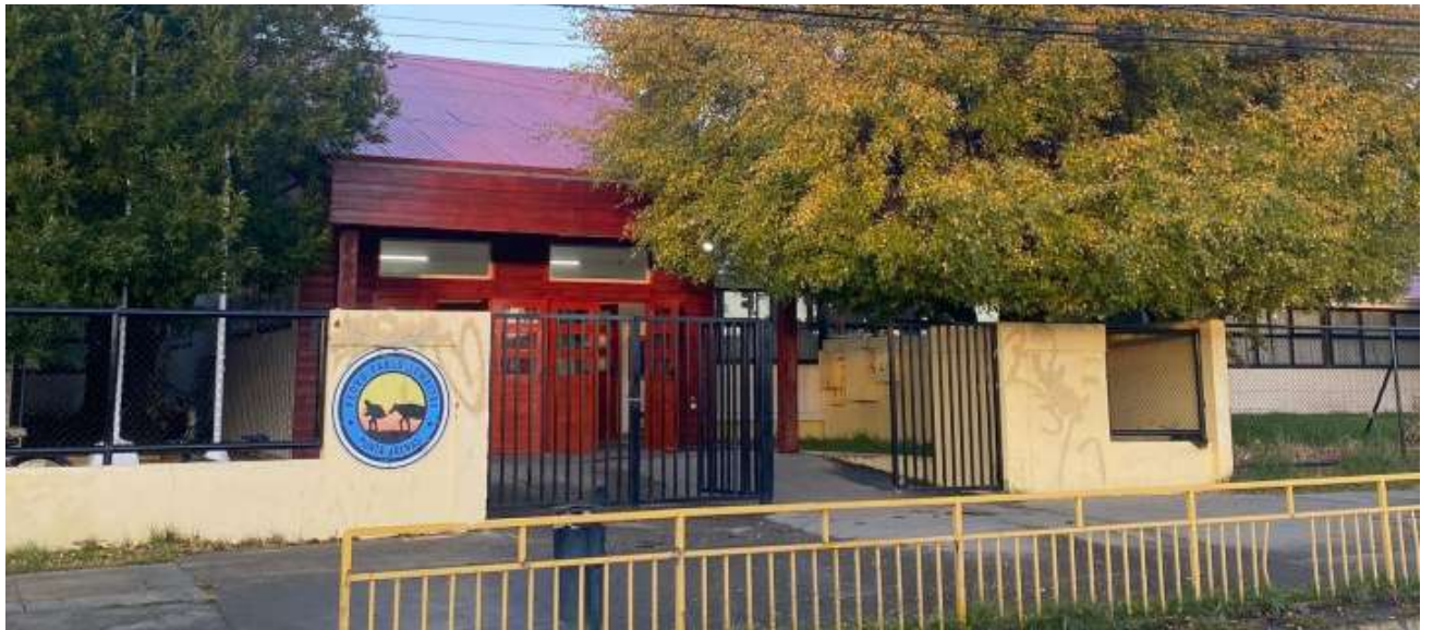
En Punta Arenas se espera la nueva edificación de la Escuela Pedro Pablo Lemaitre.

La construcción de una nueva Escuela Pedro Pablo Lemaitre, que concenre a la enseñanza básica y media en un solo lugar, en la sede ubicada en ca-