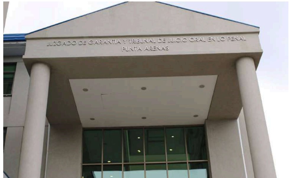
En el Juzgado de Garantía de Punta Arenas se realizó la audiencia del sujeto que fue condenado ayer en la mañana.

“El año 2022 la niña tenía doce años, sufrió por un pariente, el imputado, que es su tío que estaba acá en la ciudad, un abuso sexual en reiteradas oportunidades. La llevó a actos de connotación sexual, la hizo masturbarse y que lo masturbara, situaciones descritas en la acusación. La Fiscalía y el querellante pedían una pena alta, pero con las atenuantes se le dio una pena de cuatro años, con una libertad intensi-