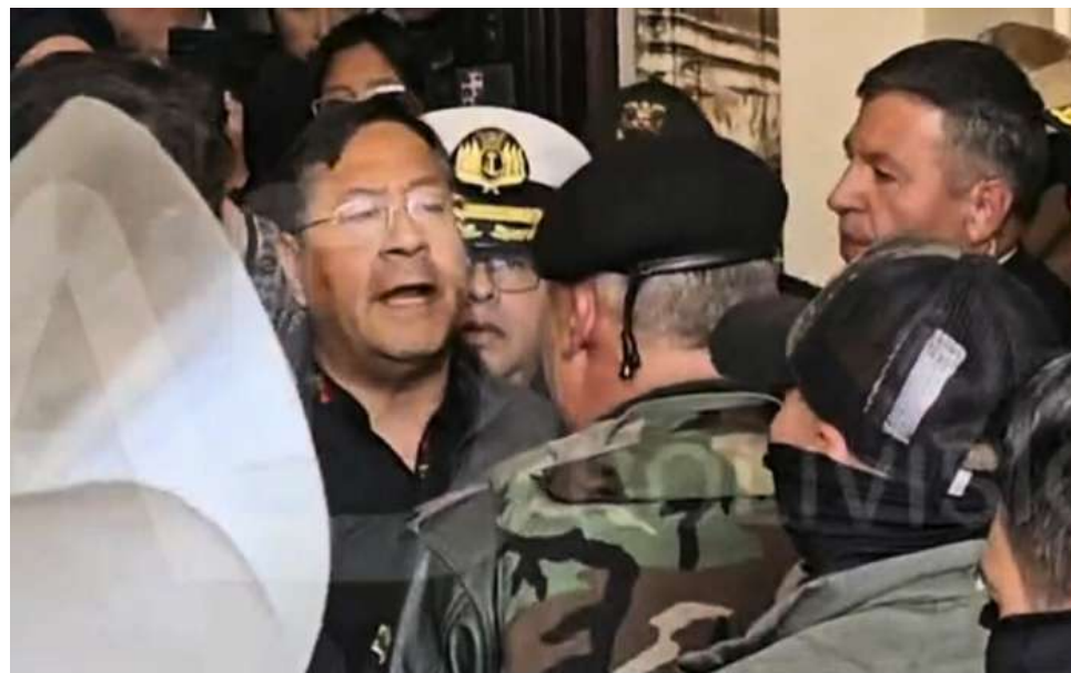
La tensión incluyó un cara a cara entre el Presidente y el líder de la insurrección.