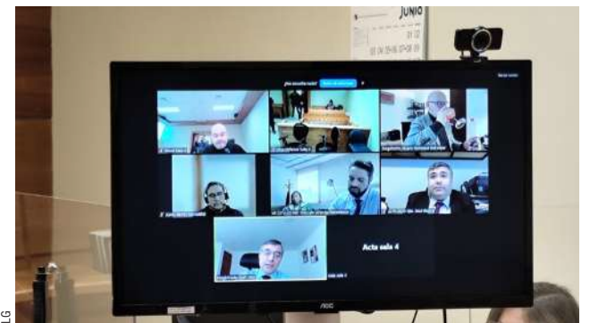
Los imputados y la defensa comparecieron vía Zoom a la audiencia.

La Fiscalía sostuvo, además, que otro de los delitos tiene que ver con un contrato falso de compra y venta, que hicieron entre los imputados. "Los cargos tienen razón con un contrato simulado, donde las personas involucradas, los imputados, simularon la venta en forma prendada de un bien, que previamente se adquirió, para simular la inexistencia de este bien, sacarlo de su patrimonio y no poder hacerse con las herencias de los afectados. Esta venta no se concretó,