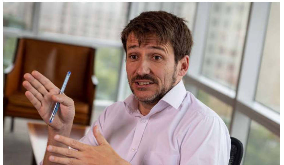
Pardow se refirió a las fórmulas que se exploran para extender el subsidio por el alza en las cuentas de la luz.

Al igual que el ministro de Hacienda, Mario Marcel, Pardow intentó dejar claro que, en estos momentos, los recursos para aumentar la ayuda no existen. En ese sentido, subrayó que “lo que sí está claro, es que, en términos estructurales, y lo dice el Consejo Fiscal Autónomo, espacio de gasto no hay. Cualquier gasto adicional tiene que salir de alguna parte. Lo que no hay es espacio presupuestario sin usar”.