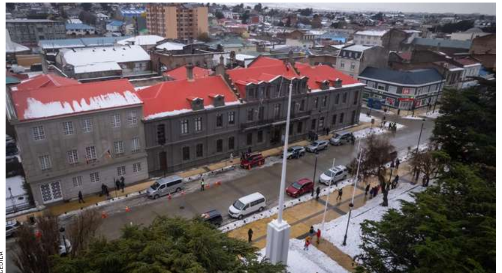
El Mandatario encontró ayer a su ciudad natal totalmente nevada.

Agregó que “es necesario saber cómo ha impactado el aporte de energía de ENAP a través del Parque Eólico Vientos Patagónicos ubicado en Cabo Negro, que se interconectó a la red de distribución aportando 10 mil MW (megawatts), cuya única energía que consume es el viento. Este aporte alimenta a 15 mil hogares en nuestra ciudad; este proyecto tuvo un costo de 22 millones de dólares, de los cuales 5 millones de dólares fueron aportados por el Gobierno