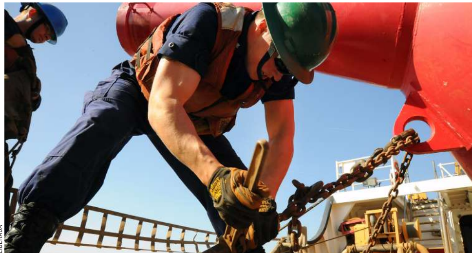
Los desocupados, según los últimos datos del Gobierno Regional, fueron de más de seis mil.

Información de la misma DT dio cuenta que en el tramo enero-abril 2024, los trabajadores con aviso de término de contrato en la Región de Magallanes llegaron a 8.930 (de un total de 923.422 a nivel país). Los últimos datos de la Secretaría Regional Ministerial (Seremi) del Trabajo en Magallanes consignaban que había en el último mes más de seis mil desocupados, lo que, en el cruce de datos, dio cuenta de una recuperación en el ámbito laboral.