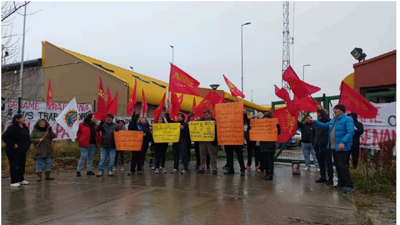
Los manifestantes durante la jornada en las afueras del Centro de Internación Provisoria, en el sector Río de los Ciervos.

En paralelo, los representantes de los funcionarios del