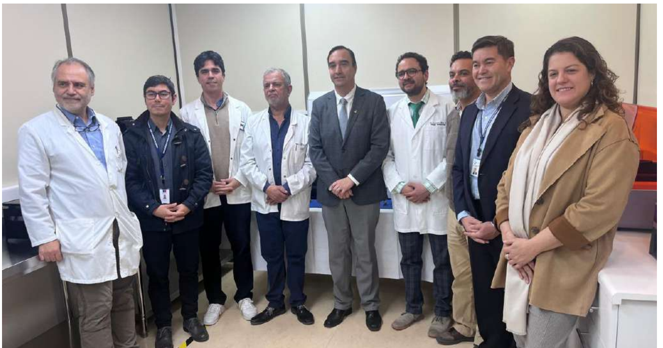
Autoridades participaron del lanzamiento de este importante laboratorio de maxilofacial.

El Laboratorio de Cirugía Virtual Maxilofacial está equipado con tecnología de vanguardia que permite la planificación quirúrgica en 3D, proporcionando una precisión sin precedentes en