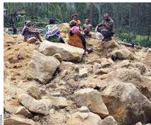
El Centro Nacional de Desastres elevó a 2.000 el número de presuntos sepultados en una carta a la ONU publicada ayer.

“No todo el mundo está en la misma casa al mismo tiempo, así que hay padres que no saben