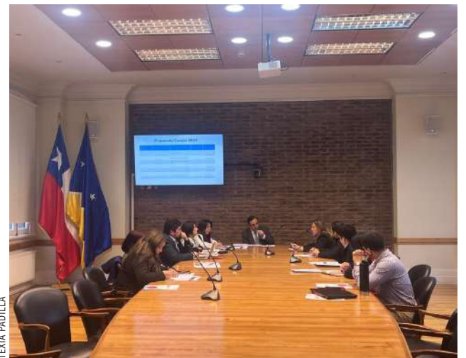
Sesión de Consejo Regional de Magallanes

“Así también el Observatorio de Magallanes realizó una presentación en cuanto a los perfiles de los técnicos, operadores y profesionales que se necesitan en hidrógeno verde. En general están completando una cantidad muy importante de información y de encadenamiento cuando el Sence ha propuesto los cursos acordados”. Flies agregó que “los equipos, tanto de los trabajadores a través de su consejera de la CUT y del ámbito privado, como es la Cámara Chilena y la Agrupación de Turismo, terminando el curso entregan la lista de los nombres de las personas que participen para