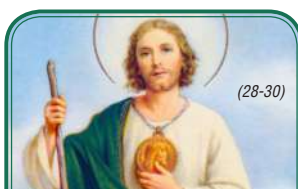
Milagroso San Judas tadeo

Santo Apóstol San Judas, fiel siervo y amigo de Jesús, la iglesia te honra e invoca universalmente, como el patrón de los casos difíciles y desesperados. Ruega por mí, estoy sólo y sin ayuda. Te imploro hagas uso del privilegio especial que se te ha concedido, de socorrer pronto y visiblemente cuando casi se ha perdido toda esperanza. Ven en mi ayuda en esta gran necesidad, para que pueda recibir consuelo y socorro del cielo en todas mis necesidades, tribulaciones y sufrimientos, particularmente (haga aquí su petición), y para que pueda alabar a Dios contigo y con todos los elegidos por siempre. Te doy las gracias glorioso San Judas, y prometo nunca olvidarme de este gran favor, honrarte siempre como mi patrono especial y poderoso y, con agradecimiento hacer todo lo que pueda para fomentar tu devoción. Amén. (I.P.C.)