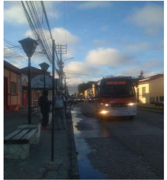
En Punta Arenas, los microbuses están ganando cada vez más terreno en la locomoción colectiva.