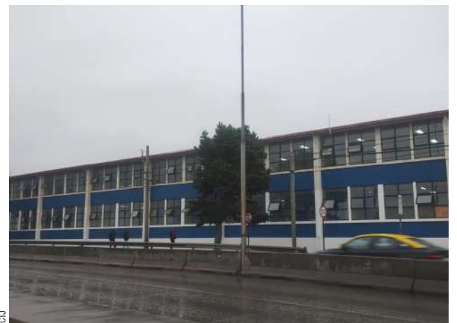
Gracias al aporte de la comunidad educativa y al SLEP, poco a poco el liceo cuenta con nueva fachada, recuperando sus colores institucionales.

El atletismo ha sido la disciplina que ha sacado cuentas alegres para el liceo. El reciente fin de semana tres estudiantes se destacaron por sus resultados en la