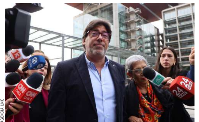
A las 9 horas de este miércoles llegará el alcalde de Recoleta, Daniel Jadue (PC), al Centro de Justicia, para enfrentar su formalización por el “caso Farmacias Populares”.

“Es una expresión espontánea, que, como tiene un tiempo, tendrá un nivel de coincidencia y coordinación para estar expectantes a cómo va a cursar la formalización que harán en la Fiscalía a Daniel Jadue. Una vigilia es que se queda esperando expectantemente, no tiene más nada que no sea esa relación del concep-