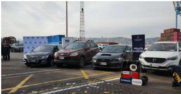
Cabe mencionar que por este hecho, hay 9 detenidos en el país que quedaron en prisión preventiva.

Se inició entonces un proceso de entrega controlada internacional de la carga