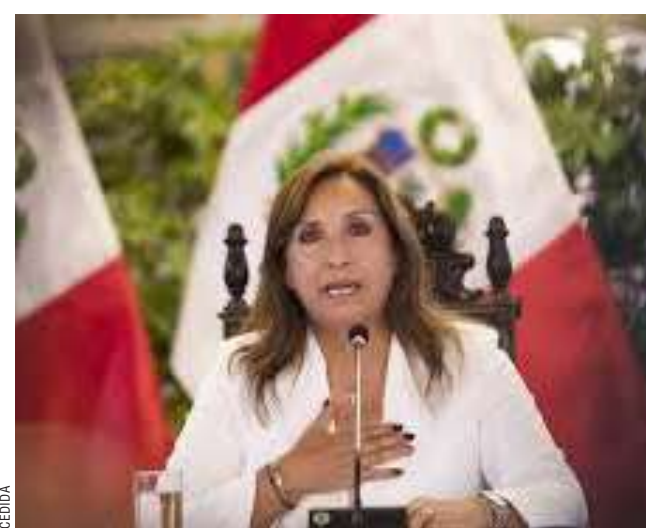
La Presidenta de Perú, Dina Boluarte, habla durante una conferencia de prensa en el palacio de gobierno.

La percepción sobre el Congreso no es mejor. Mientras el 91% aseveró que reprochaba su desempeño, el 6% lo respaldó, dejando en