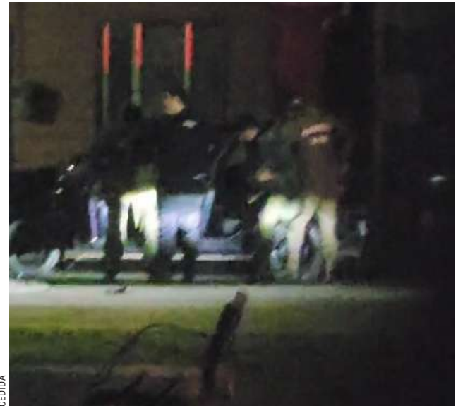
Carabineros practicó los exámenes de alcohol y drogas, arrojando en ambos positivo.

Los antecedentes fueron puestos en conocimiento del fiscal de