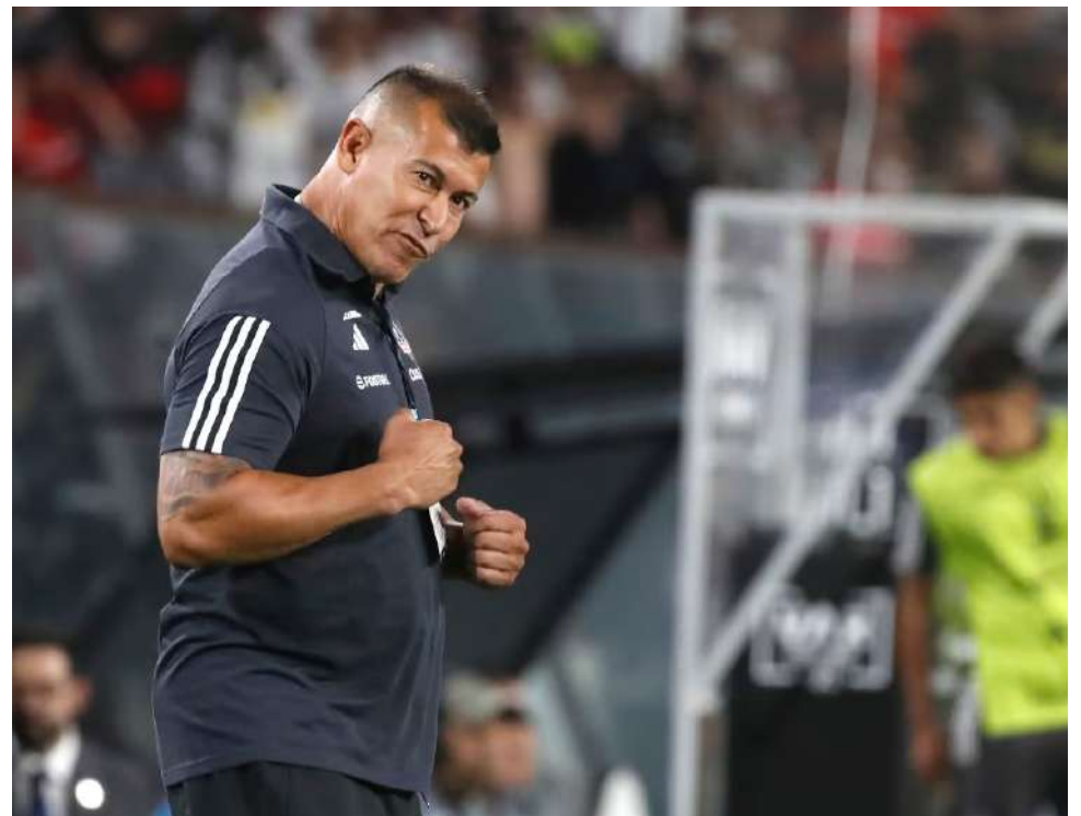
Lo del miércoles puede significar un antes y un después para Almirón en Colo Colo.

El partido clave entre Colo Colo y Cerro Porteño por la Copa Libertadores se jugará este miércoles 29 de mayo a partir de las 21:30 horas, (de Magallanes), en el estadio La Nueva Olla de Asunción.