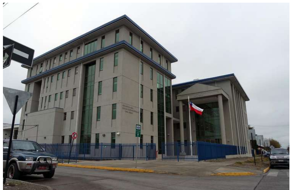
En el Tribunal Oral en lo Penal de Punta Arenas se desarrolla el juicio.

El juicio continuará durante esta jornada, esperando que cerca del mediodía pueda llegar a su término luego de la exposición de las pruebas respectivas, recordando que el imputado se encuentra privado de libertad, en calidad de imputado en prisión preventiva.