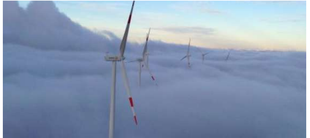
La construcción del parque eólico se enmarca dentro de un plan de descarbonización que lleva adelante TotalEnergies.

Actualmente, estas instalaciones funcionan generando su propia electricidad por medio de