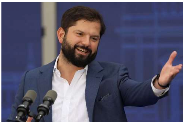
El Presidente Gabriel Boric citó a la sesión especial haciendo uso de su facultad.

Finalmente, se proyecta que a eso de las 20:30 o 21:00 horas del miércoles, la reforma de pensiones ya debiese estar en condiciones de ser ley de la República, a no ser que un elemento se vaya a comisión mixta.