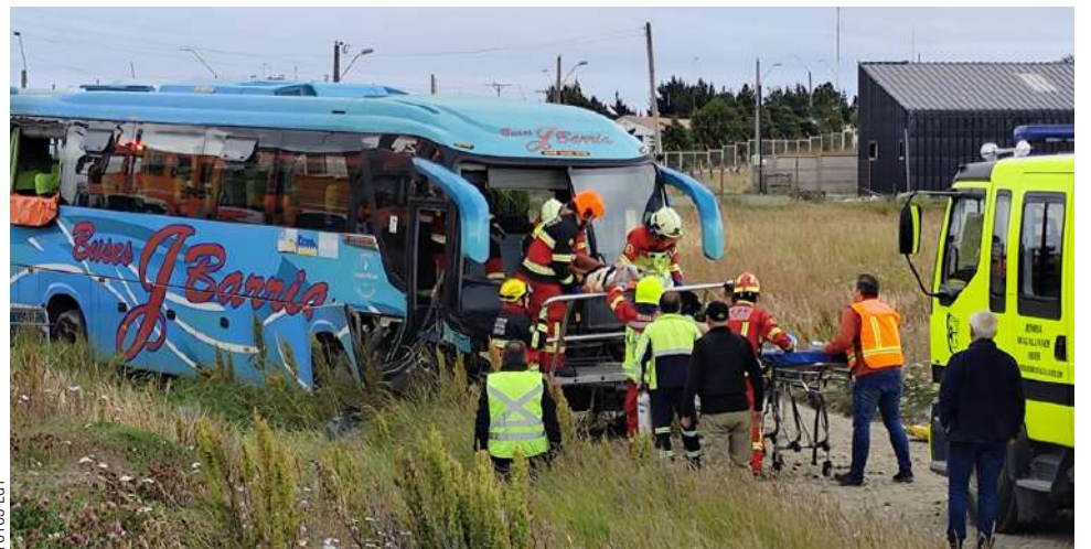
El conductor evitó volcar la máquina, evitando así una mayor tragedia.

En el exterior, un grupo de voluntarios de Bomberos se encargaba de separar a los pacientes, de acuerdo a la magnitud de las lesiones, mientras que el conductor del Terrano fue inmovilizado debido a sus