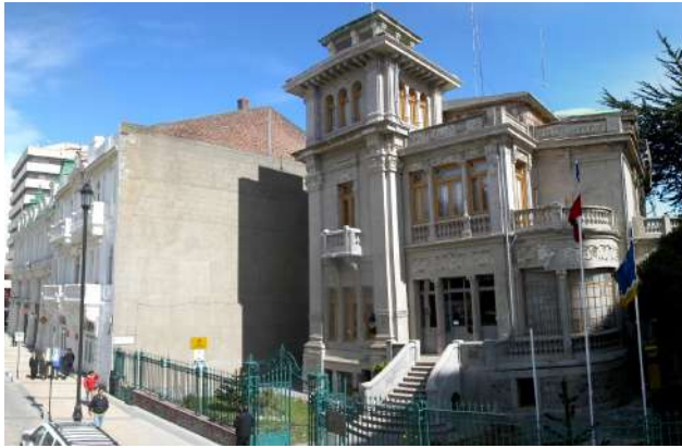
El municipio de Punta Arenas aparece destacado dentro del informe de probidad.

El informe 2024 del Consejo para la Transparencia evaluó aspectos clave, como