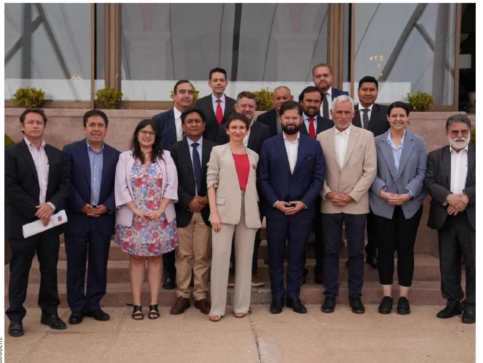
Las autoridades tras el encuentro en Cerro Castillo, Valparaíso.