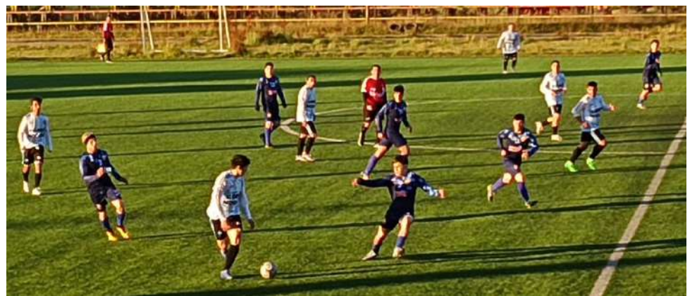
Sokol derrotó a Magallanes 3 a 1 y se mantiene como puntero del certamen.