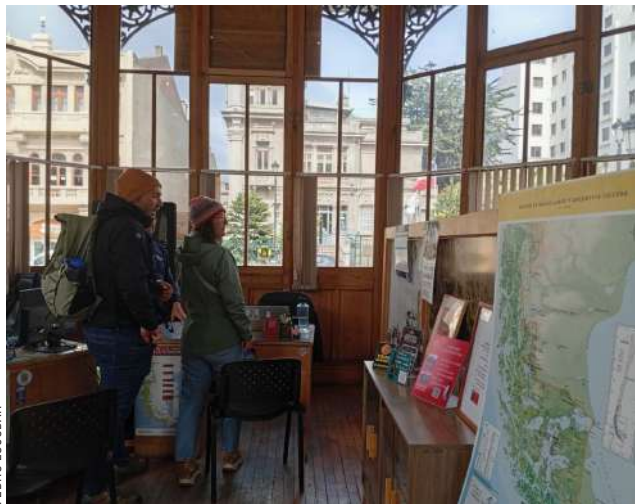
La oficina comunal de información turística recibe constantemente turistas.

● Todas las estadísticas muestran un importante aumento de turistas a la región de Magallanes, en el inicio de este año.