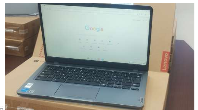
Equipos cuentan con la tecnología de Google para fines educativos.

En los próximos días, los establecimientos educativos ubicados en Puerto Edén, Cerro Sombrero y Punta Arenas también recibirán sus propios computadores portátiles.