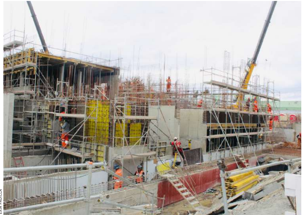
Autoridades visitaron ayer las obras del nuevo Cesfam 18 de Septiembre.