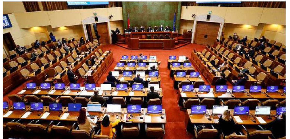
La sesión está fijada para hoy a las 10:00 horas en la Cámara de diputados.

La sesión de hoy miércoles será desde las 10 de la mañana hasta las 6 de la tarde, solamente debate, tres minutos por parlamentario, todos podrán hacer