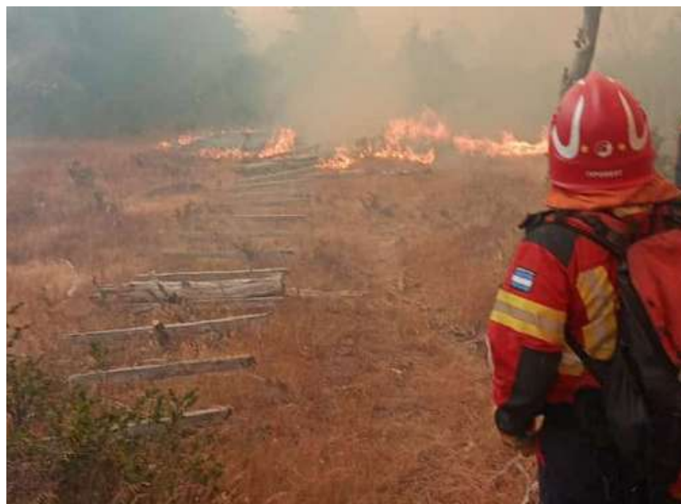
Los brigadistas continúan en el área para poder cesar el incendio de proporciones.

Por último, las autoridades restringieron zonas por razones de seguridad y el despliegue de vehículos, por esa razón, permanecerá cerrado el camino desde Los Rápidos al Circuito Cascada los Alerces y solo se permitirá la circulación de vehículos autorizados de instituciones oficiales.