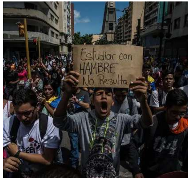
A nivel regional, el informe señala que el hambre afectó a 41 millones de personas en América Latina y el Caribe en 2023.

La medida, que rompe las normas, se produce tras la reasignación de varios altos funcionarios de carrera de distintas divisiones, a pesar de que tradicionalmente los fiscales de base permanecen en el Departamento de Justicia durante todas las administraciones presidenciales y no son castigados por su participación en investigaciones delicadas.