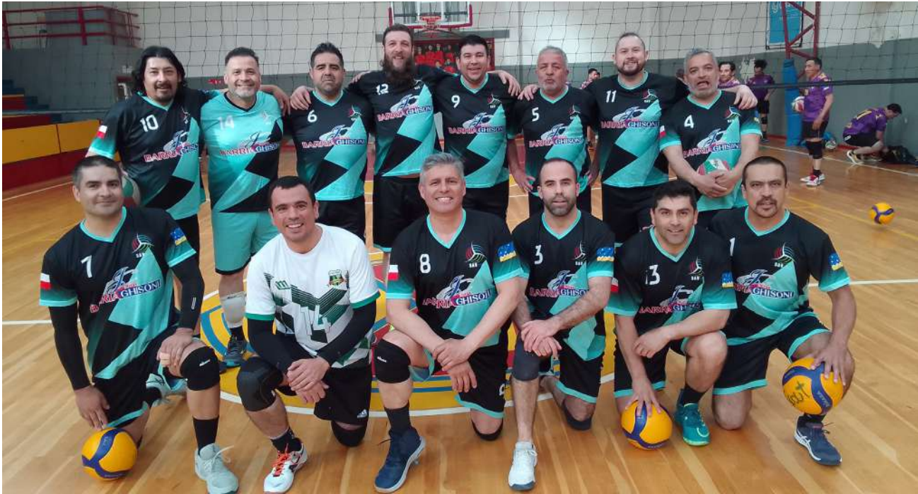
El equipo del Club Deportivo Buses Barría.