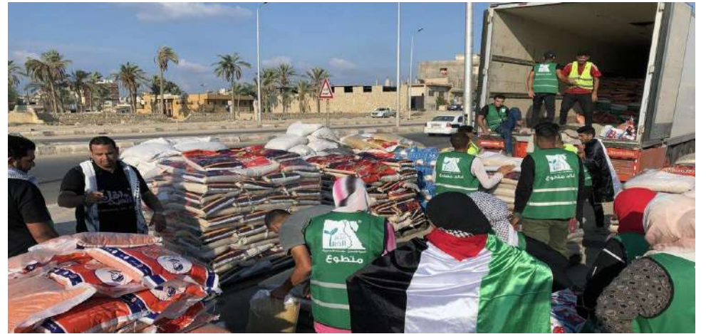
Aseguran que en 80 días solo han entrado 19.764 camiones de ayuda de los 48.000 que debían acceder (un 41 por ciento).

Consultado por EFE, el organismo militar israelí que supervisa la entrada de ayuda en Gaza, el COGAT,