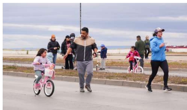
Se completaron ocho versiones del programa en 2025, sumando cerca de 800 participantes.

ma tanto en la comunidad como en el turismo. “Es súper importante este servicio porque le da la posibilidad a los papás de compartir con sus hijos y también a los turistas de conocer la ciudad de una forma entretenida y rápida. La ciclovía y estas instalaciones han cambiado la vida