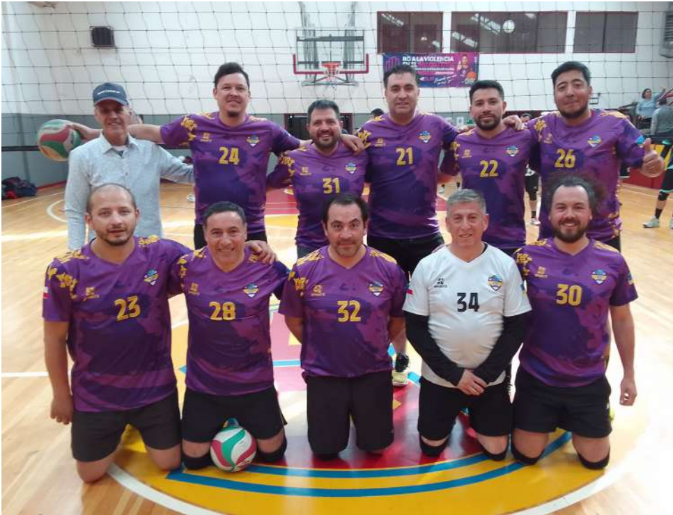
El Club Deportivo Unión.