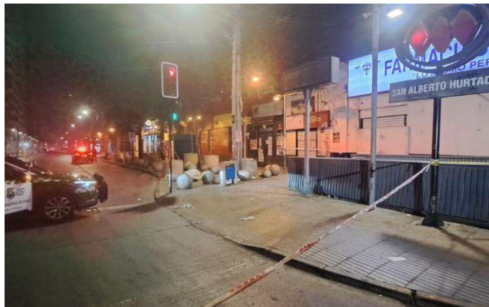
Se pudo determinar que se percutaron más de 30 disparos, ya que en el sitio del suceso se halló esa cantidad de vainillas.

Con todo, precisó que en el lugar se encontró “una gran cantidad de vainillas, estamos hablando de más de 30 en este sector donde estamos, y también en otro sector que es casi donde termina la cuadra, en donde las personas habrían sido abatidas”.