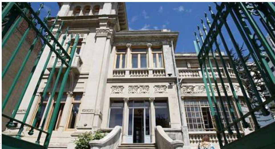
El dictamen de Contraloría, emitido en noviembre, ordenó regularizar los nombramientos de cargos directivos.

Asimismo, el jefe comunal destacó que la gestión municipal fue reconocida este año por el