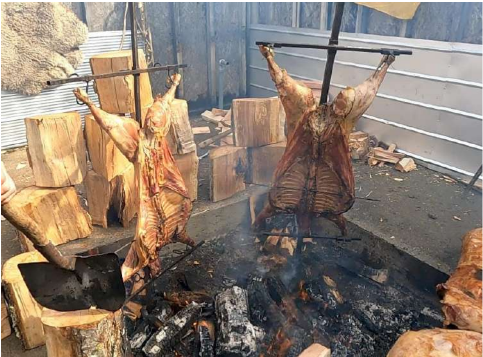
La actividad se realizará el próximo 7 de febrero en la Comuna de Porvenir, en Tierra del Fuego.

Para más información, los interesados pueden consultar las bases oficiales disponibles en los canales de difusión del municipio.