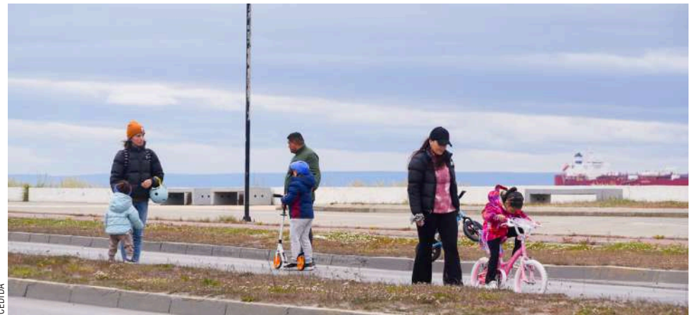
El 11 de enero comienza la nueva temporada de “La Costanera es Tuya”.