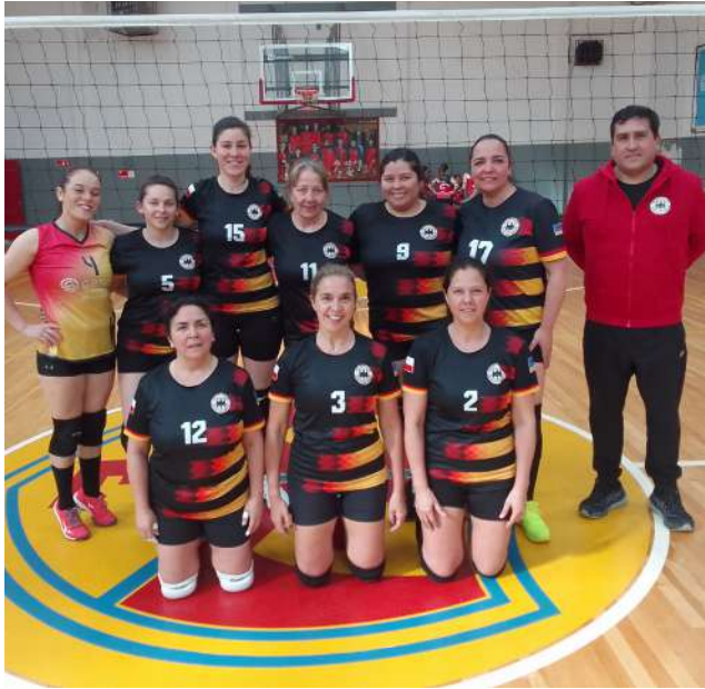
Club Deportivo Alemán.