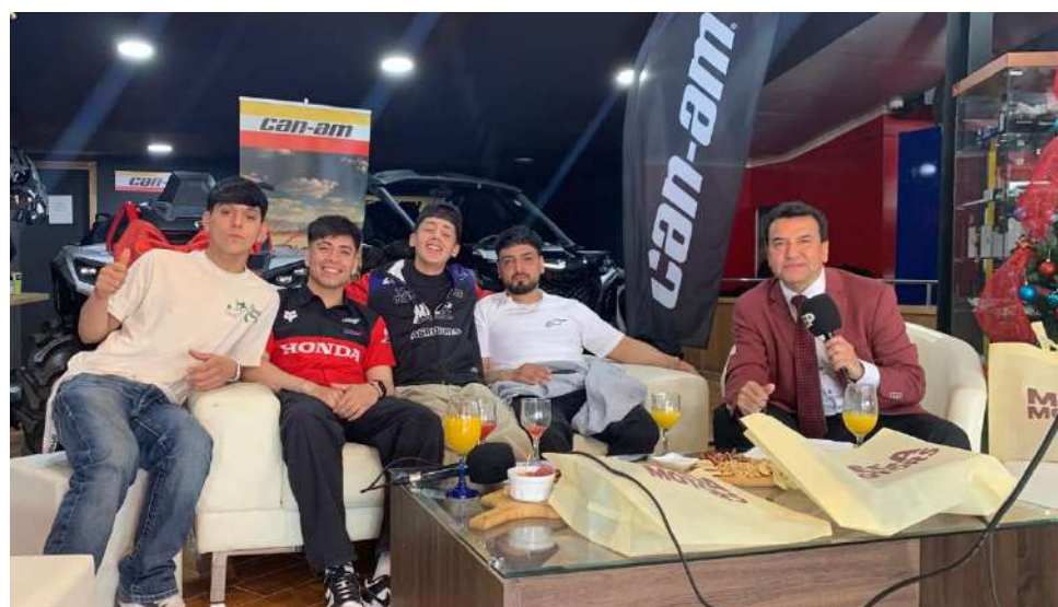
En la gráfica, los cuatro destacados pilotos de ATV y Moto que estuvieron en Megamotors y para “Pasión Deportiva en Navidad”.

Para el destacado piloto de moto y quien fue participe y protagonista de la carrera argentina “Vuelta Tierra del Fuego”, esta temporada las lesiones lo han tenido distante de los podio. Sin embargo, en las posibilidades que ha tenido este año quiere sumar minutos en el enduro y cross