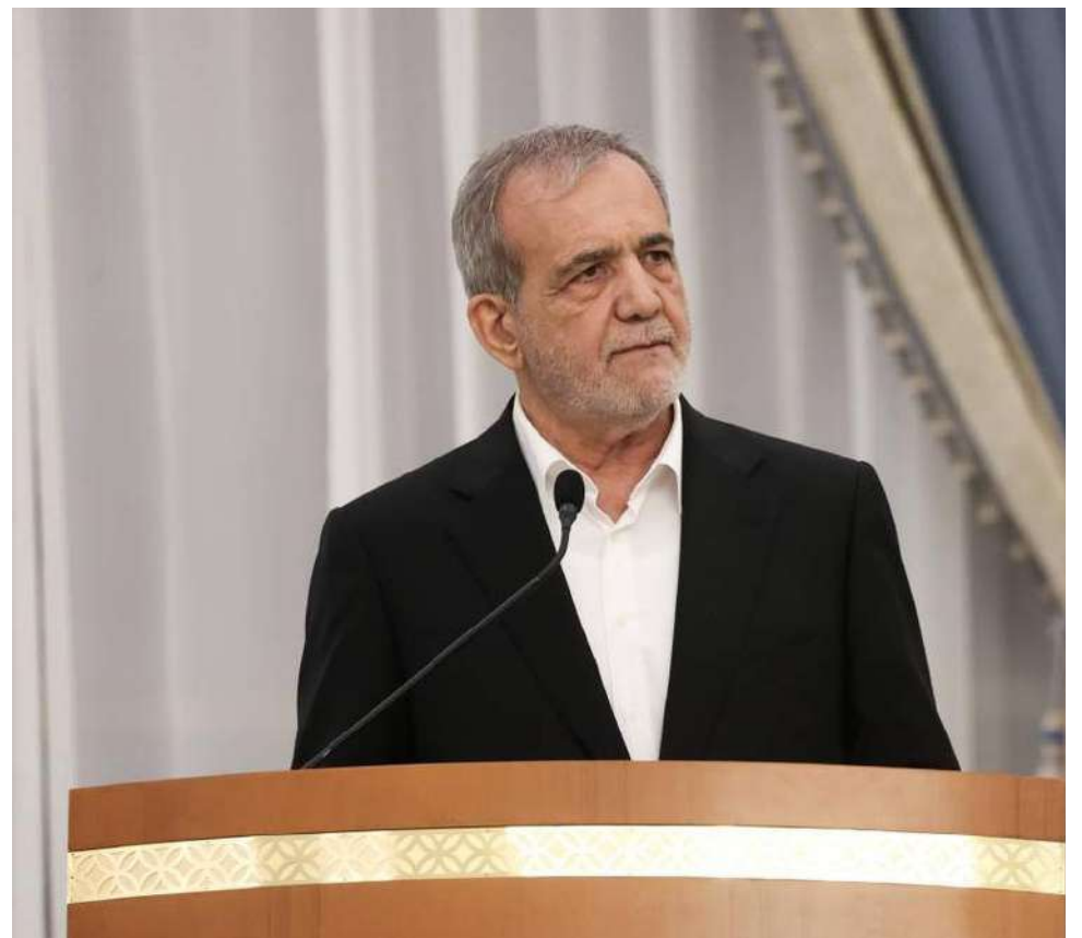
El Presidente de Irán, Masud Pezeshkian, dijo que su país está cercado.

Con el estallido de la guerra, las negociaciones nucleares entre Teherán y Washington quedaron estancadas y la República Islámica se niega a reanudarlas por lo que considera demandas excesivas de EE.UU., que pide el cese de enriquecimiento de uranio, la limitación del alcance de misiles iraníes y el fin del apoyo de Irán a milicias regionales como Hizbulá del Líbano o Hamás palestino.