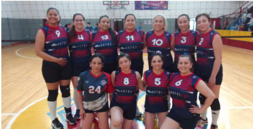
En la gráfica, el elenco de Británico "B", campeón del voleibol femenino.

● El certamen +35 años, organizado por Canadela Punta Arenas, se llevó a cabo en las instalaciones del gimnasio del Club Español.