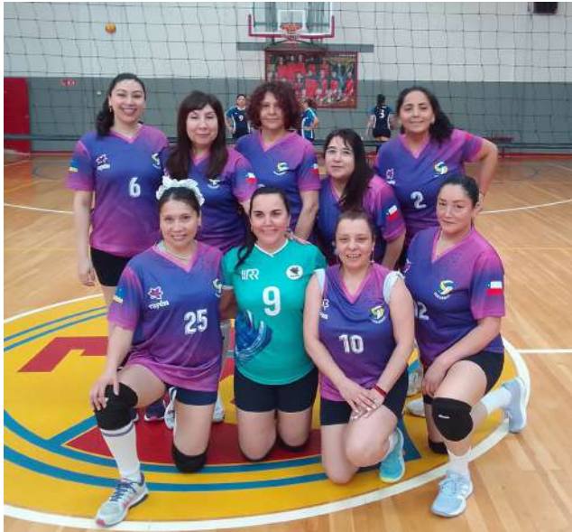
Club Deportivo Rayén.