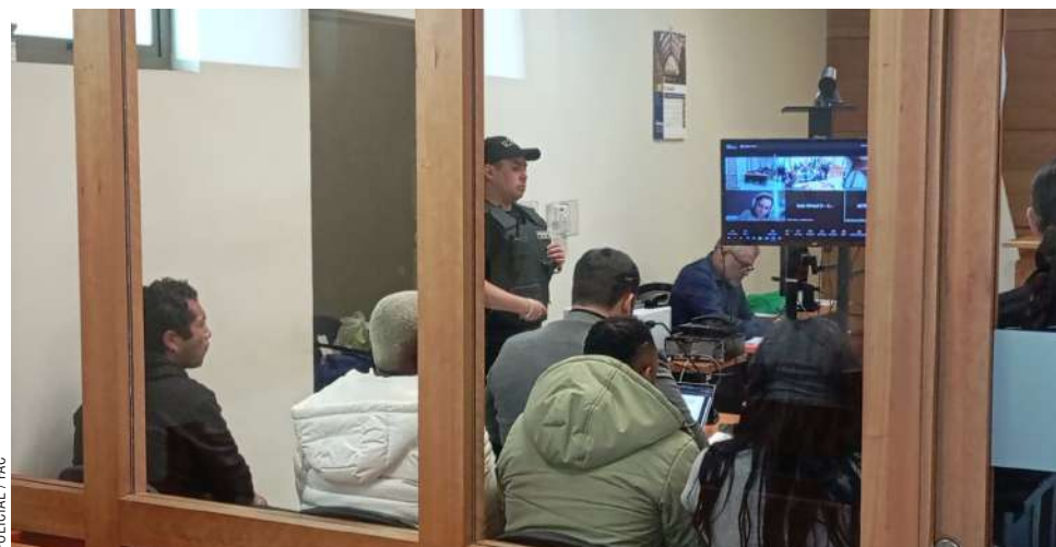
Los imputados, dos hombres y una mujer de nacionalidad colombiana y un ciudadano chileno, fueron detenidos por narcotráfico.

Tras confirmarse el contacto, los oficiales procedieron