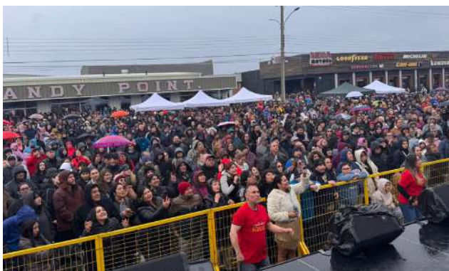
El público disfrutó de shows en vivo durante la lluviosa tarde.