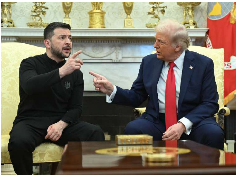
Trump conversó con Putin sobre Ucrania a pocas horas de su encuentro con Zelenski en Florida.

Los asesores de Trump han barajado previamente la idea de ofrecer a Ucrania garantías de seguridad similares a las de la OTAN, lo que significaría en teoría que los miembros de la alianza responderían militarmente si Rusia volviera a atacar.