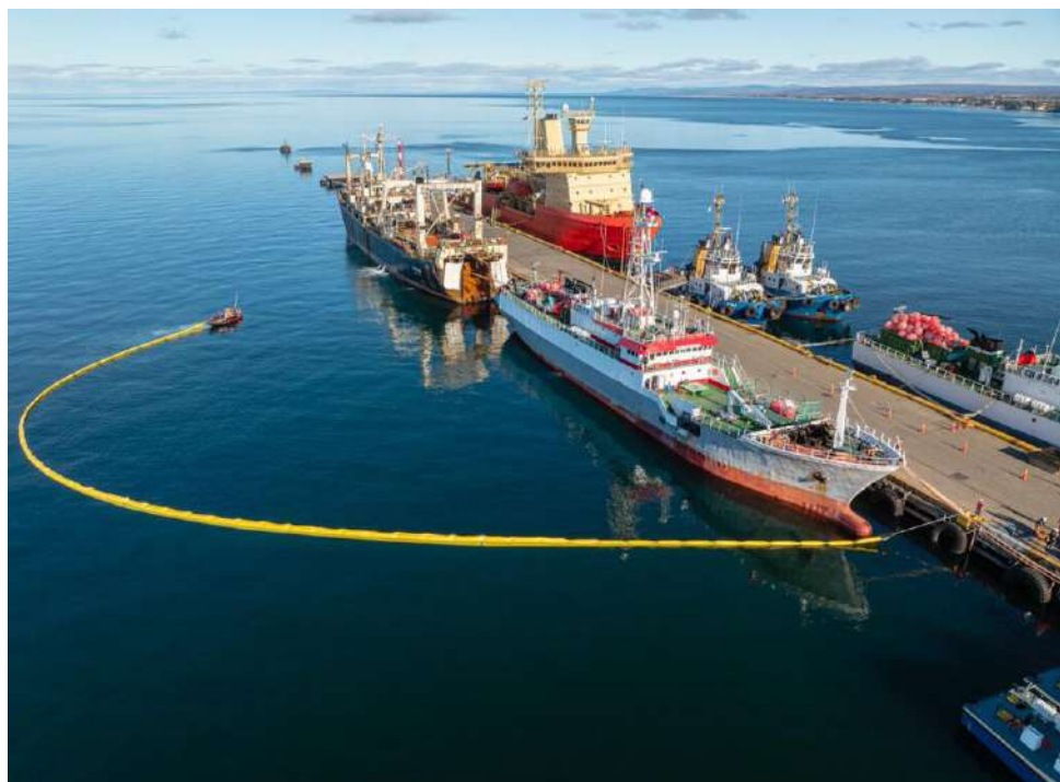
Punta Arenas es eje logístico para la cooperación científica entre Chile y otros países.

● La capital de Magallanes se perfila nuevamente como plataforma clave para la cooperación científica internacional, en el marco de las conversaciones para una eventual misión antártica conjunta en 2026.