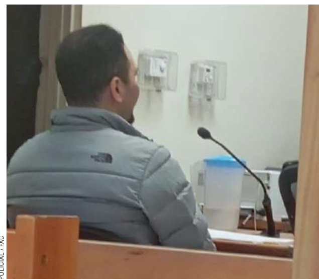
POLICIAL / FAC

Junto a esto, se le impuso la prohibición absoluta de contacto con la víctima y la obligación de