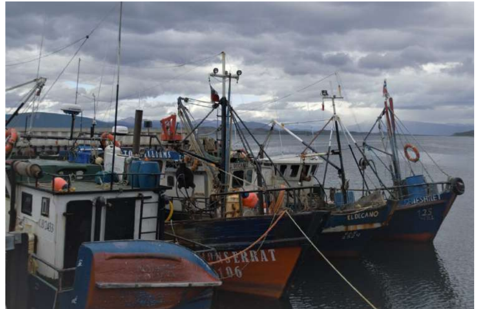
Las cifras evidencian una fuerte presencia de la actividad pesquera artesanal.

En este contexto, los datos del RPA permiten dimensionar no solo la magnitud de la pesca artesanal en Magallanes, sino también su relevancia social y económica para las comunidades costeras. La alta concentración de inscripciones en determinadas categorías y provincias da cuenta de