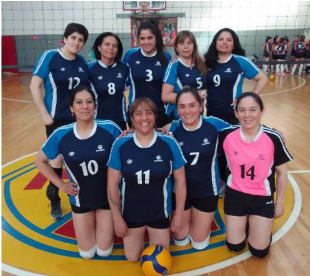
Club Deportivo Amigas.