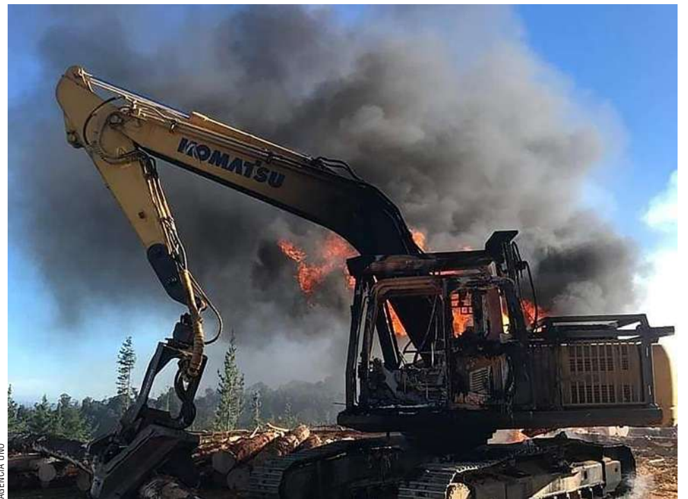
En las últimas horas se han registrado una serie de ataques incendiarios en la Región de La Araucanía.

En el lugar se encontró un panfleto del cual, hasta el momento, se desconoce su mensaje.