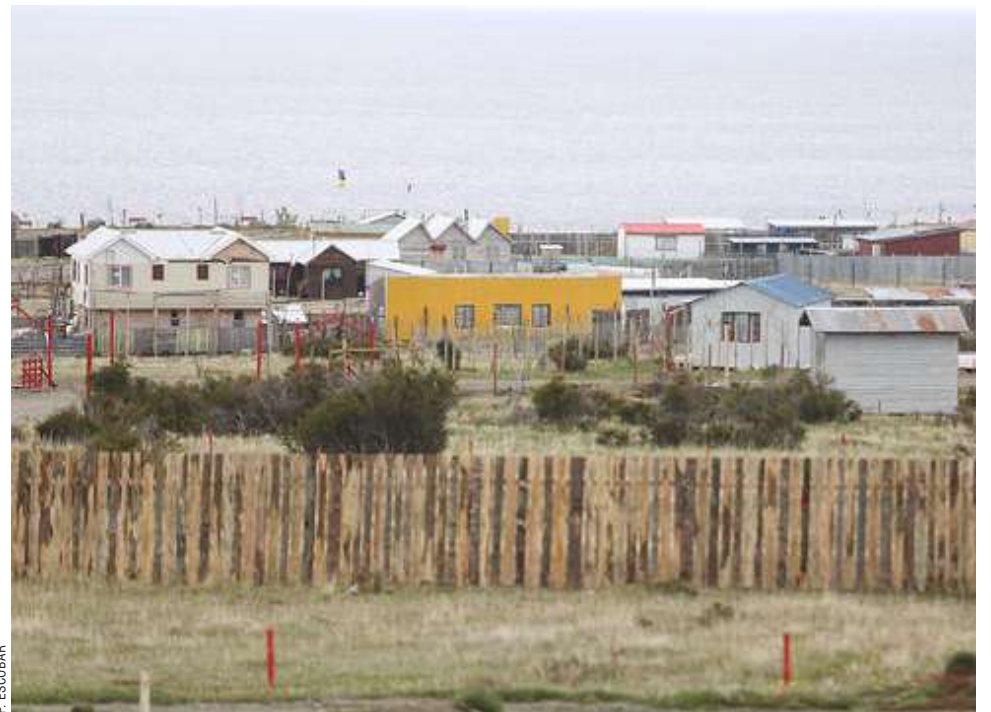
El asentamiento se ubica en el kilómetro 32 de la Ruta 9 Sur. Los terrenos fueron subdivididos en loteos de menos de media hectárea.

Aunque arriesga una pena carcelaria, el individuo podría cumplir su condena en libertad. Le benefician las atenuantes de colaboración sustancial al esclarecimiento de los hechos —por someterse al abreviado— y de irreprochable conducta anterior. El resultado se conocerá el viernes, cuando se lea la sentencia.