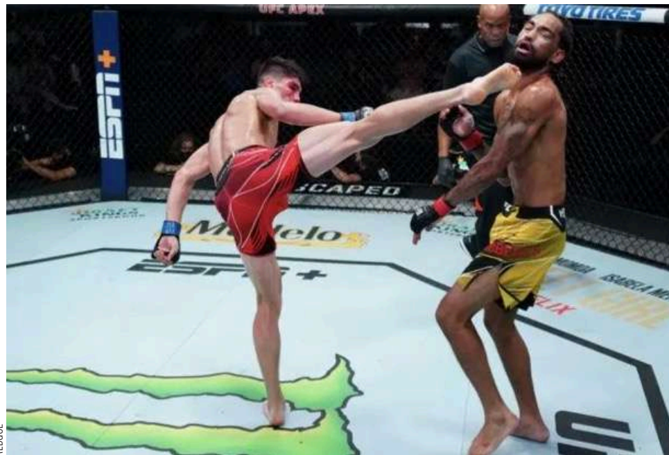
El deportista nacional Ignacio “Jaula” Bahamondes con su patada giratoria ha dado la vuelta al mundo, en su triunfo en la UFC.

Finalmente dejó un mensaje a todos los fanáticos de nuestro país y el continente. “Quiero mandar un saludo a toda la gente de Chile y Latinoamérica. Me siento muy bendecido por esta oportunidad que me dan de representarlos. Espero les haya gustado la presentación”.