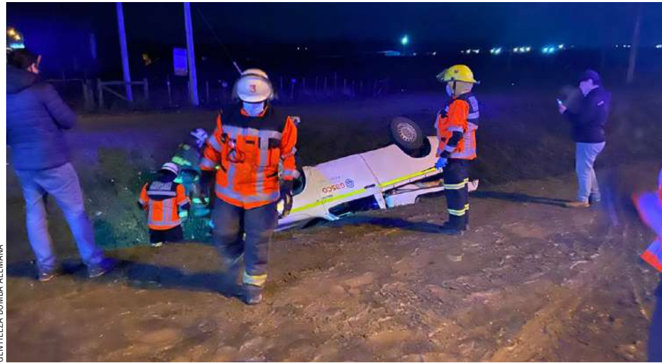
La camioneta quedó a un costado de la Ruta 9 Norte tras el accidente.

De igual forma, el Centro Regulador del SAMU despachó una ambulancia de atención avanzada, para que procediera a la atención del herido, quien se encontraba fuera del vehículo, luego de haber salido por sus medios desde el interior.