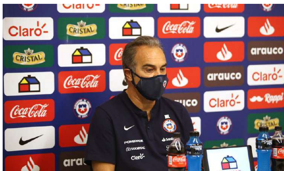
Martín Lasarte analiza varios casos antes de dar la nómina oficial para la fecha triple, entre ellos Alexis Sánchez.