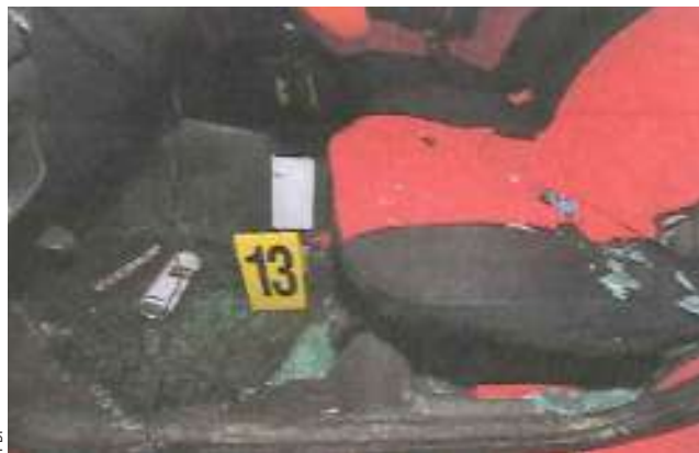
El joven fue condenado solo por manejo en estado de ebriedad con resultado de daños.

reclusión nocturna. Por ello lo sentenciaron a 154 días bajo la vigilancia del Centro de Reinserción Social de Gendarmería.