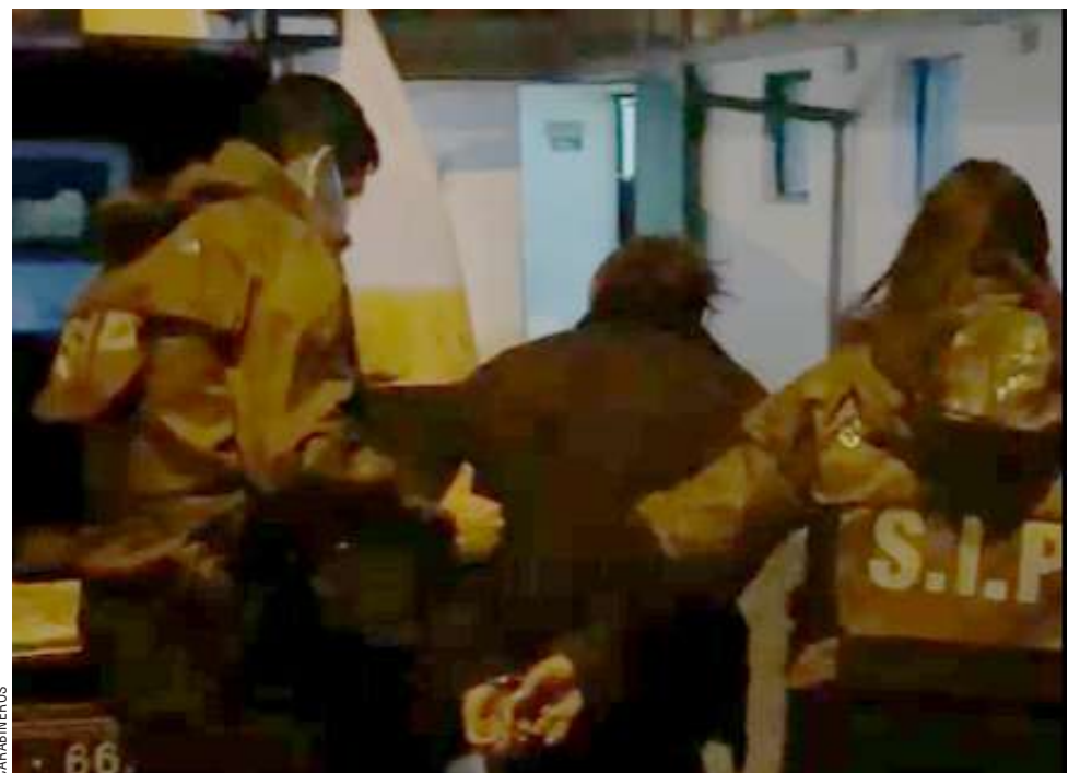
El individuo fue trasladado a la Primera Comisaría de Carabineros por personal del SIP.

Por esa causa el imputado tiene la prohibición de asistir a manifestaciones.