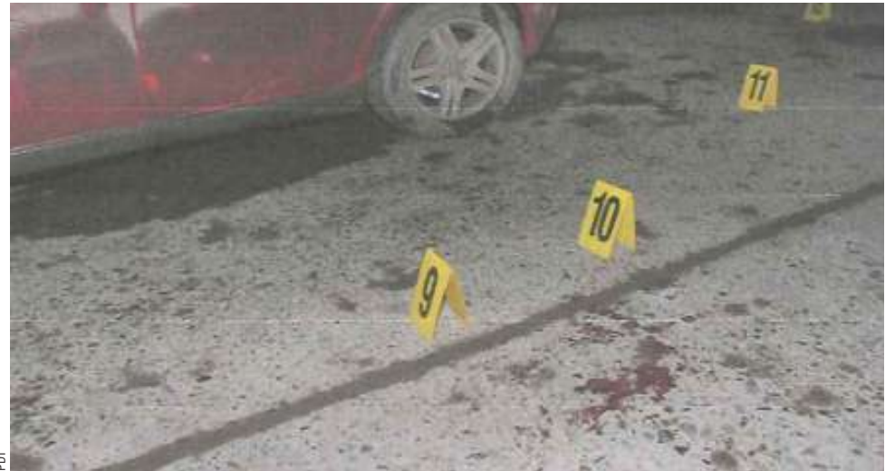
La Brigada de Homicidios de la PDI hizo diligencias en el sitio del suceso. El funcionario constató heridas de carácter grave.

En un procedimiento abreviado, el joven —que cumplió con arresto domiciliario nocturno y arraigo regional desde el control de su detención— admitió su responsabilidad en los