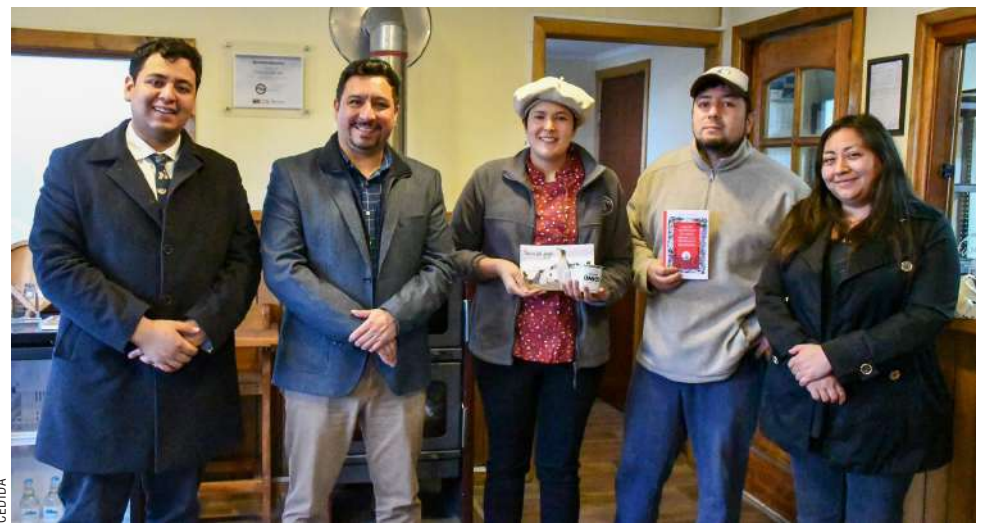
Autoridades visitaron el emprendimiento gastronómico establecida en Puerto Williams.