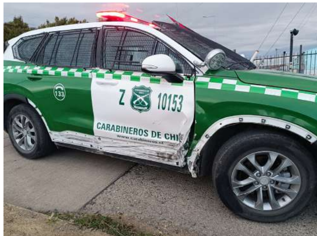
La patrulla que participó de persecución sufrió daños por el choque del vehículo particular.

El conductor del vehículo, además, dio positivo por consumo de alcohol y drogas por cocaína.