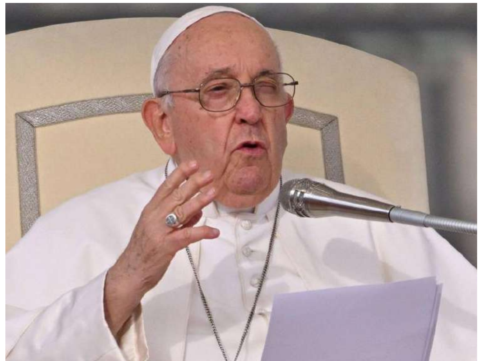
“La guerra es siempre un absurdo y una derrota”, ha señalado el Papa Francisco.

El Papa Francisco se ha referido en muchísimas ocasiones a lo que ocurre con la situación en Oriente Medio, señalando que “Hoy, rocas pesadas, demasiado pesadas, cierran las esperanzas de la humanidad: la roca de la guerra, la roca de las crisis humanitarias, la roca de las violaciones de los derechos humanos, la roca de la trata de personas y otras”.