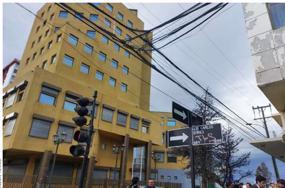
Esquina de calle Bories con Croacia en pleno centro de Punta Arenas.

Agregó que por todo estos, “se ha trabajado para presentar el lunes el proyecto al gobernador. Eliminar los cables le da un valor agregado a esta ciudad, hace el lugar un poco más peatonalizado”.