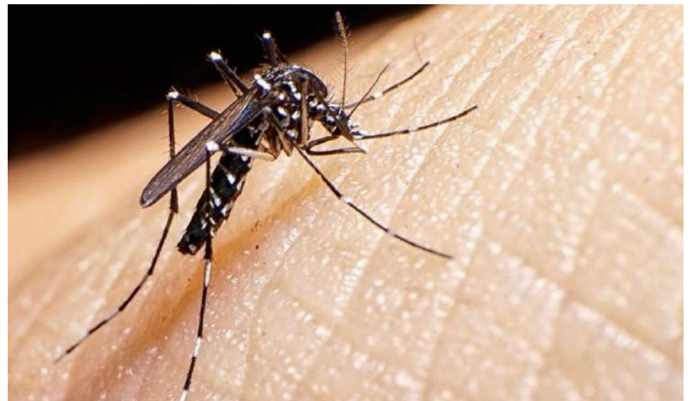
En la mayor parte de los casos, el dengue causa síntomas leves y se cura en una o dos semanas, pero en casos infrecuentes se agrava y puede causar la muerte.

ponjas húmedas o arena. Es importante limpiarlos por si quedan huevos de mosquito adheridos. 4) Desmalezar