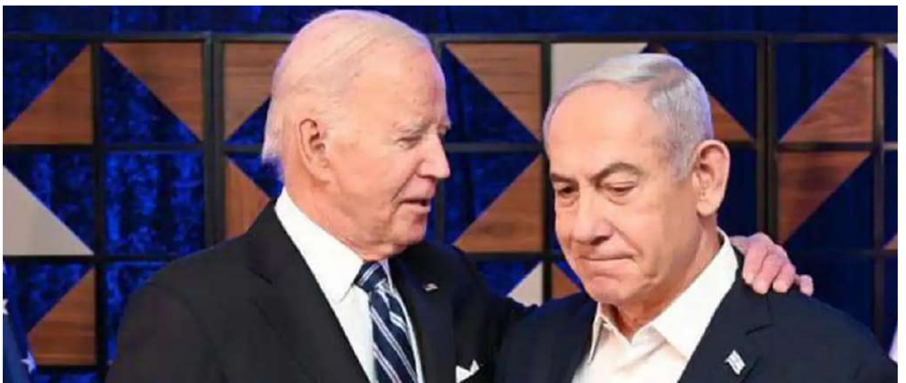
Biden y Netanyahu se comunicaron telefónicamente a las pocas horas del ataque iraní a Israel,

Por su parte, Biden le dijo al primer ministro israelí, Benjamin Netanyahu, durante una llamada hecha el sábado que Estados Unidos no apoyará un contraataque israelí contra Irán, según medios locales, algo que la Casa Blanca matizó la mañana de domingo. “El Presidente fue