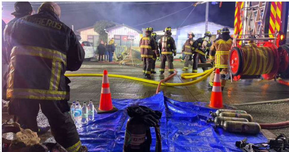
Al lugar llegaron siete compañías de Bomberos para sofocar las llamas.

lidad, más aún, poniendo en riesgo sus vidas.