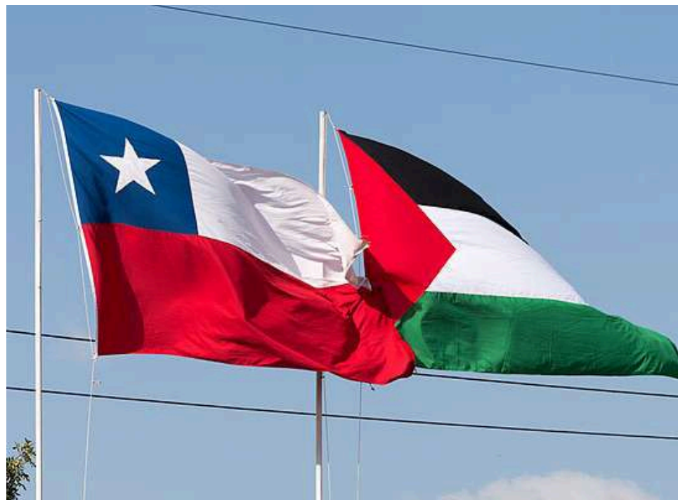
Chile alberga una de las comunidades palestinas más grandes fuera del mundo árabe.

Por su parte, el mandatario actual Gabriel Boric, es un reconocido defensor de la causa palestina, que ha condenado duramente desde el inicio tanto los ataques de Hamás como la ofensiva israelí en Gaza.