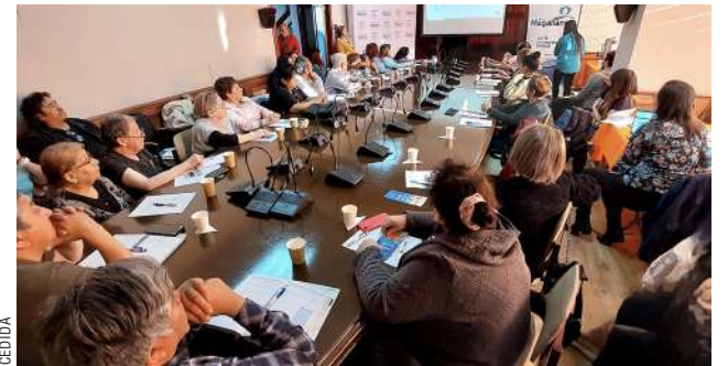
En la instancia se dieron cita más de 40 dirigentes sociales.

La idea es presentar proyectos que apunten al mejoramiento de espacios comunitarios (mejoramiento de baños, cierres perimetrales,