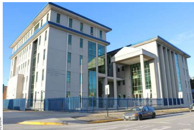
La condenada no arriesga pena de cárcel efectiva por el delito de malversación de fondos públicos.