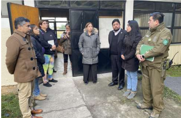
A una semana del incendio, autoridades visitaron la Escuela Lemaitre para mejorar seguridad.