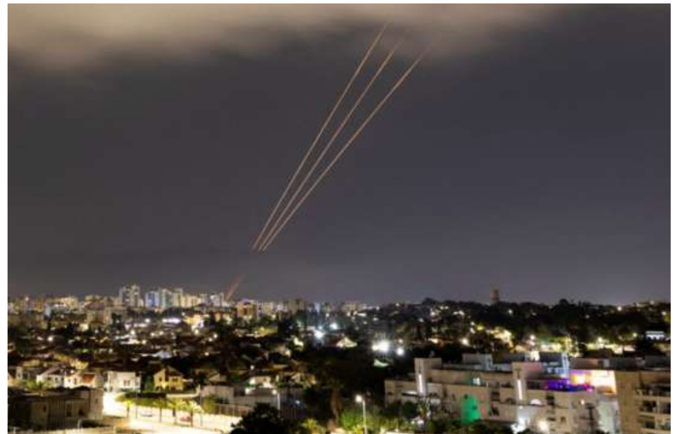
Hasta ayer aún no estaba claro el alcance del ataque de Israel a Irán.

"Es en parte solidaridad con Israel, como es el caso de Estados Unidos, pero también es quizás un