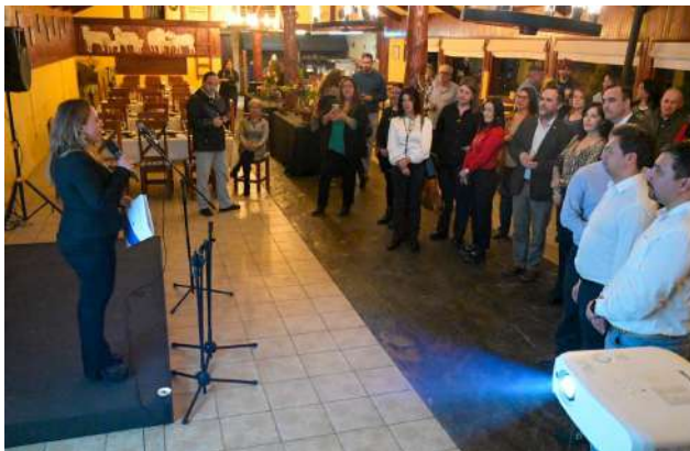
La presidenta de la Cámara Austro Chile destacó la importancia que el turismo regional pueda desarrollarse durante todo el año.

El evento de lanzamiento contó con la participación de autoridades regionales, en especial del gobernador Jorge Flies, quien anunció importantes medidas de apoyo al sector; medios de comunicación y representantes del sector turístico, transformándose en una oportunidad única para fortalecer lazos y crear un espacio de encuentro tras el periodo post pandemia.