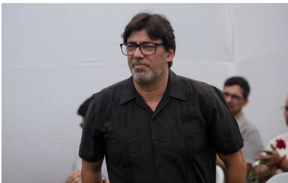
Jadue pretendía participar de un evento internacional al que fue invitado por Nicolás Maduro.