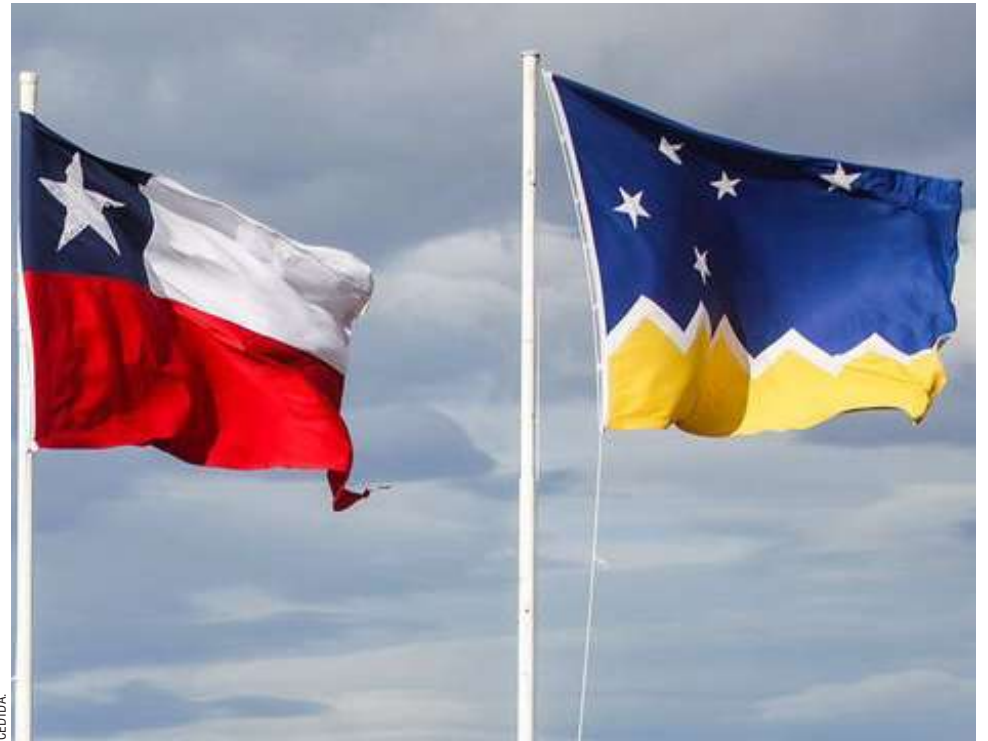
Las elecciones generales se llevarán a cabo el domingo 27 de octubre.

Podrán renunciar a su cargo a contar del inicio de las campañas, o bien solicitar permiso sin goce de sueldo.