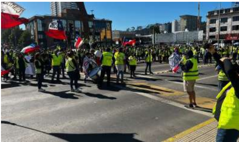
El gremio aseguró que estas paralizaciones están afectando una parte importante de las cadenas logísticas de la macrozona central y del Biobío.

“Este tipo de disrupciones afecta seriamente nuestra imagen país, nuestra competitividad a nivel internacional y la confianza que han depositado en nuestros servicios portuarios y logísticos los miles de clientes alrededor del mundo”, agregó. Lo anterior, continuó, “es particularmente grave ante el