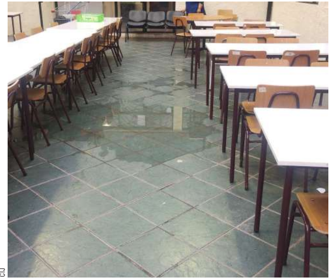
El agua filtrada en el comedor. Una escena que da cuenta de lo imprevisible de la situación.

Desde el servicio educativo explicaron que una vez iniciada la emergencia durante la noche del jue-