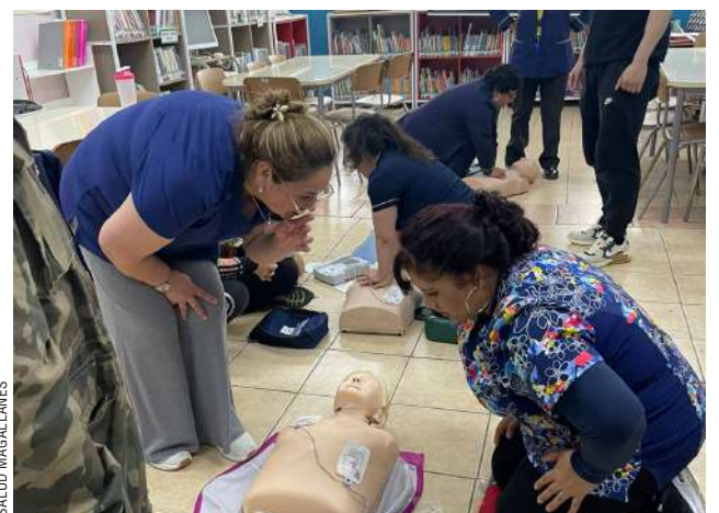
La instancia se llevó a cabo capacitando a los docentes en aspectos teóricos y prácticos.

En situaciones de emergencia, los primeros auxilios pueden marcar la diferencia entre la vida y la muerte, es por ello, que la labor realizada por el equipo SAMU es fundamental para la salud de los estudiantes y va en directo beneficio de la comunidad.