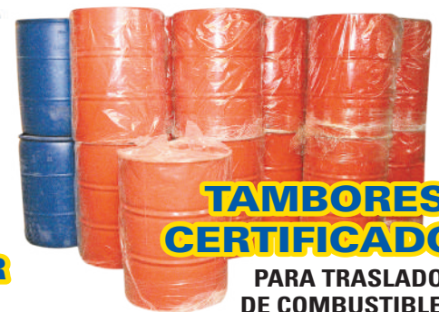
TAMBORES CERTIFICADOS PARA TRASLADO DE COMBUSTIBLES

ZENTENO 99 ☎ 61 2 216695 📞 +56 9 67596732 📍 Ferreteria San Marcos 📧 ferreteria.sanmarcos 📧 ferreteria@comercialsanmarcos.cl 🌐 www.comercialsanmarcos.cl