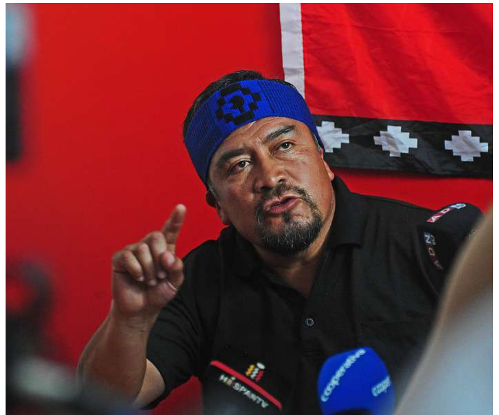
El Tribunal de Temuco dictó veredicto condenatorio contra el líder de la Coordinadora Arauco Malleco por una serie de delitos ligados a violencia rural.