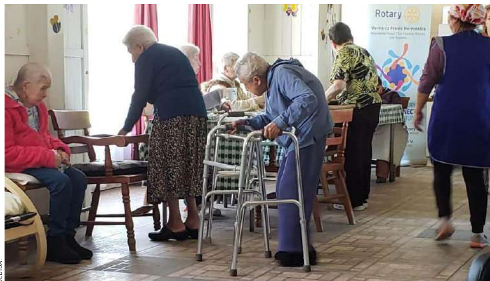
La familia busca justicia por el maltrato que recibió la mujer de 83 años.

Se precisa que al llegar al hospital, los médicos descubrieron una serie de condiciones preocupantes, incluida una úlcera por presión de gran tamaño en la zona sacra, desnutrición severa,