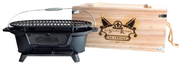
PARRILLA MARCA LA CRÉOLE