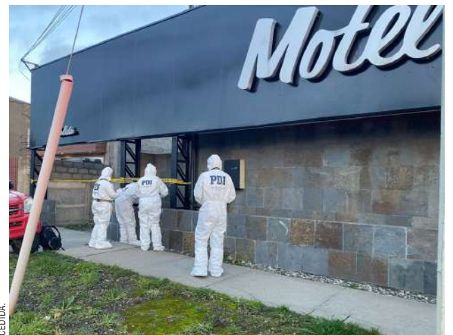
El hecho se registró la madrugada del sábado.

*Fotos referenciales. Estos productos son exhibidos en nuestra sala de ventas con sus respectivos valores.