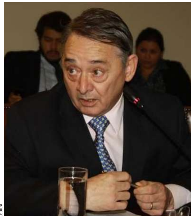
Acuerdos por concejales tiene la DC en todas las comunas de la región.

“No está nada afiatado, no hubo el tiempo suficiente para llegar al acuerdo de los gobiernos regionales. Lo mismo pasa con los consejeros. Solo está listo el pacto por los concejales”, cerró el también ex diputado.