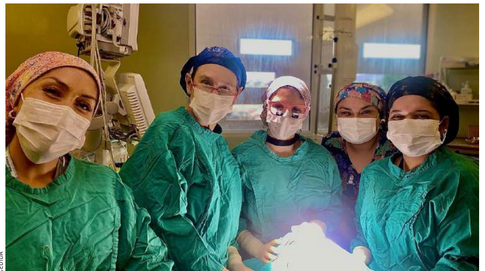
Durante el año pasado se realizaron al rededor de 12 intervenciones, por medio de las dos rondas (mayo y noviembre).

La primera cirugía parte alrededor de los seis meses, teniendo otra a los nueve meses y algunas otras entre los cuatro, diez y once años. En algunos casos es necesario realizar unas cirugías ortognáticas para corregir algunas imperfecciones.