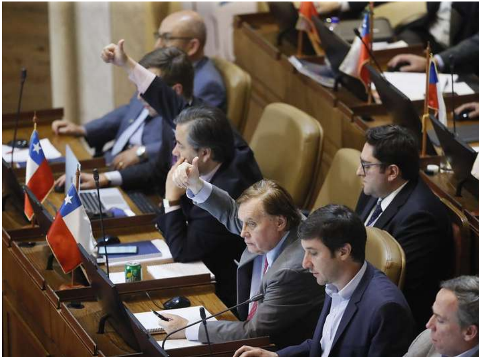
La derecha en bloque apoyó la moción, a pesar de que varios diputados de Chile Vamos criticaron un "amateurismo" detrás de ella.

La derecha en bloque apoyó la moción, a pesar de que varios diputados de Chile Vamos criticaron el "amateurismo" de sus impulsores, quienes la presentaron menos de 24 horas después de la elección.