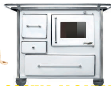
COCINA ALCAZAR MUEBLE