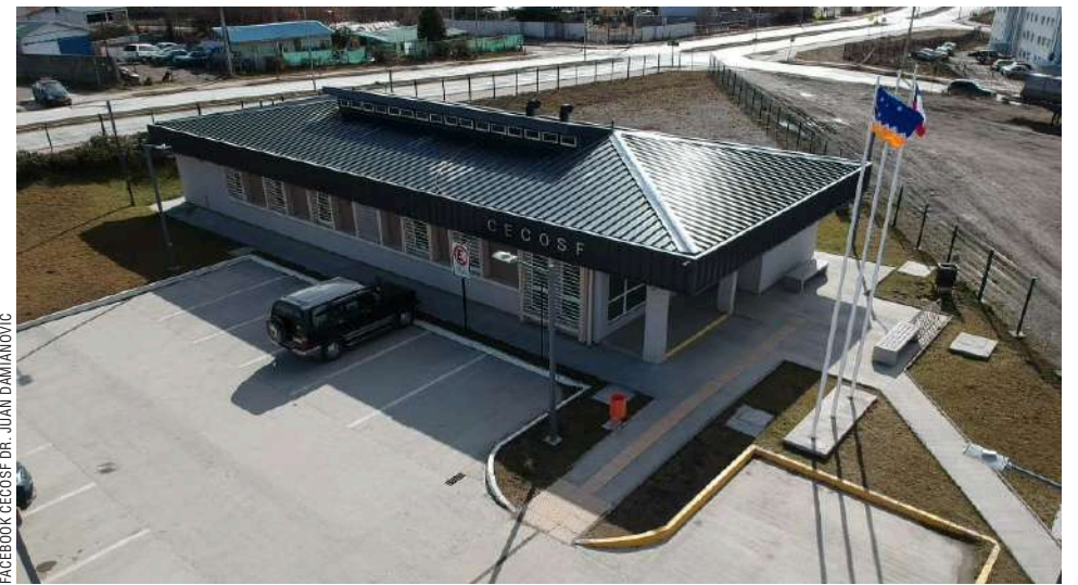
El recinto de salud celebró su séptimo aniversario el pasado 21 de marzo.

Para cualquier duda, las personas pueden contactarse al número 612269730 o al correo "contacto.cecosfdamianovic@cormupa.cl".