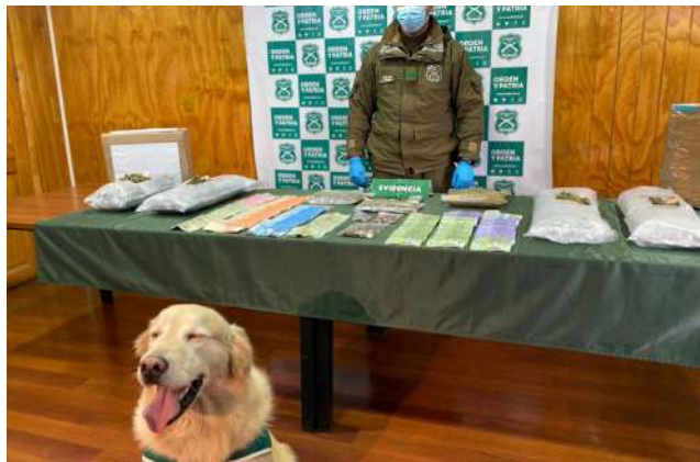
Parte del trabajo que ha realizado Carabineros en el último mes.

● El acto conmemorativo se desarrollará en la Plaza de Armas Benjamín Muñoz Gamero de Punta Arenas a partir de las 11:00 horas.