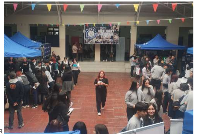
La actividad se desarrolló en el patio central del liceo.