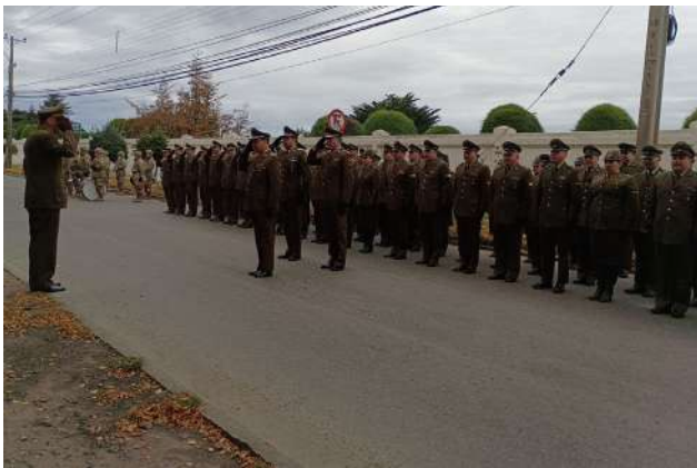
El desfile de aniversario será a las 11:00 horas en la Plaza de Armas.