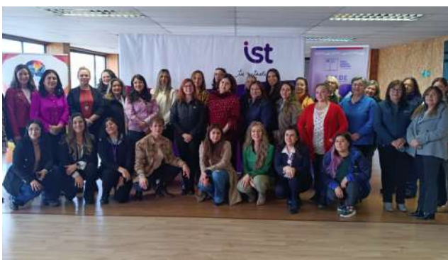
Varias mujeres fueron parte de la presentación de la nueva ley, que busca también ser un beneficio para ellas.