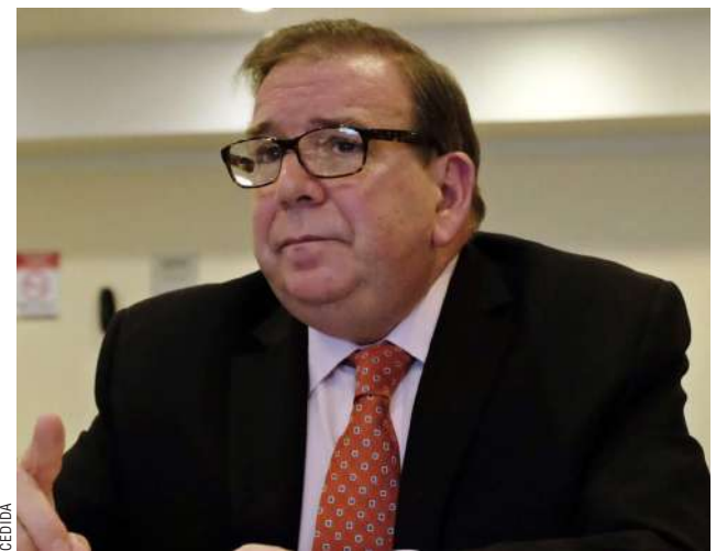
El candidato presidencial de la oposición venezolana, Edmundo González Urrutia.

“Hoy hablar de extrema derecha y de estos radicalismos de centro y de izquierda, somos un poco desacostumbrados. Yo me ubico y respeto mucho a dirigentes como al que acaba de mencionar, el presidente Lacalle Pou. No tengo nada en contra de otros candidatos como