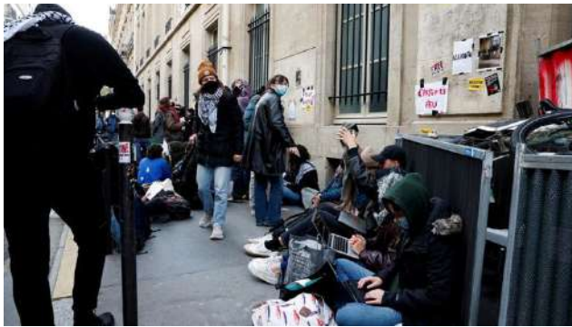
Estudiantes bloquean la entrada en apoyo de los palestinos en Gaza.