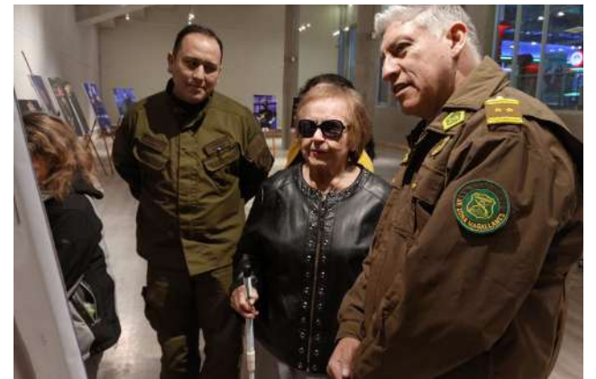
Diversas actividades se desarrollaron en la semana con motivo del aniversario.