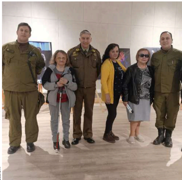
Este sábado se efectuará la ceremonia de investidura en la Plaza de Armas.

● El compromiso es fortalecer los lazos con la comunidad promoviendo una cultura de respeto y equidad.