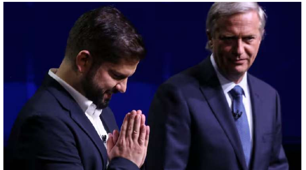
Kast habló de “woke”, un término que hoy es peyorativo para quienes fracasan con su despertar progresista.

Por su parte, el titular de la Secretaría General de la Presidencia, Álvaro Elizalde,