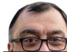
César Cifuentes presidente regional PRI

En la sociedad actual, es preocupante observar la falta de conciencia entre la juventud respecto a la importancia de los procesos electorales y la educación cívica. Conversaciones con jóvenes revelan un gran desconocimiento sobre las próximas elecciones y las funciones de los cargos a elegir. Este vacío en la formación cívica dentro de las instituciones educativas contribuye a mantener a la población en la ignorancia sobre asuntos cruciales para el país.