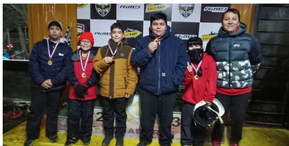
En la gráfica, los pilotos de la categoría menores, quienes recibieron una medalla de reconocimiento “Recasur, Pasión Deportiva y Ligas Magallanes”.

E n una fría jornada que contó con todas las condiciones climáticas magallánicas, es decir, frío, sol, viento y lluvia, e incluso agua nieve, se vivió ayer la fecha promocional del Torneo de Karting, denominada “Copa Recasur”.