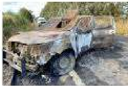
Comoción en Chile. Una emboscada, una ráfaga de tiros y tres policías

The Washington Post, uno de los medios internacionales más reconocidos del mundo también cubrió la muerte de los carabineros, destacándolo como “Assailants ambush and kill 3 police officers in southern Chile, shaking the country” (Asaltantes emboscan y matan a 3 policías en