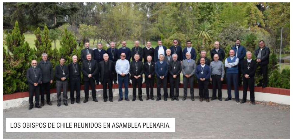
LOS OBISPOS DE CHILE REUNIDOS EN ASAMBLEA PLENARIA.

4. En medio de las múltiples problemáticas y desafíos que constatamos en nuestro país, queremos aportar una palabra de esperanza mirando a Jesucristo y su Evangelio. Reiteramos lo que señalamos en la Declaración del 14 de marzo de este año, junto a muchas confesiones religiosas: “El grave problema de la inseguridad a que se ha visto enfrentada la ciudadanía, que afecta a todos los sectores sociales sin distinción, es un flagelo de consecuencias impredecibles.