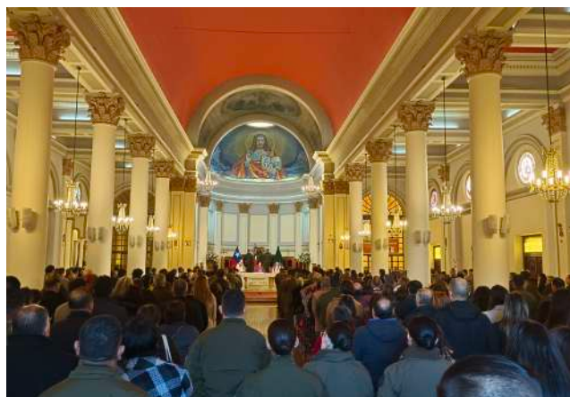
Cientos de magallánicos llegaron hasta la Catedral de Punta Arenas para brindarles su apoyo a Carabineros de Chile.

Mientras las investigaciones continúan su curso, el legado de estos valientes carabineros perdurará en el corazón de una nación que no olvida su sacrificio y que se aferra a la esperanza de un futuro libre de violencia y terrorismo.