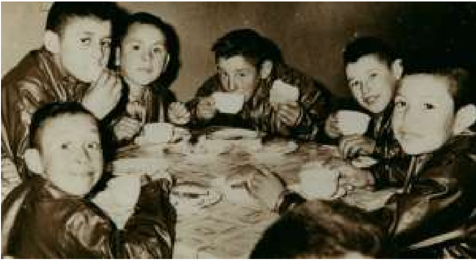
Niños miembros de la fundación disfrutando de una comida.

forma de mirar, relacionarse e interactuar con la realidad infantil, reconocida internacionalmente, por tanto, los programas y proyectos se circunscribieron a privilegiar el derecho a vivir en familia. En consecuencia, los hogares de menores se transformaron en espacios solo para aquellos que no tienen parientes que asuman su protección.