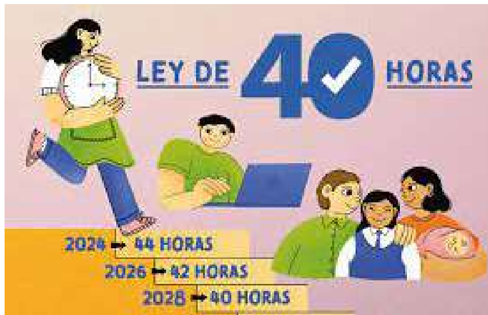
EL PASADO VIERNES 26 DE ABRIL COMENZÓ A REGIR LA LEY DE LAS 40 HORAS, DISMINUYENDO LA JORNADA LABORAL DE 45 A 44 HORAS.

Hasta antes de la reforma, la ley contemplaba cuatro causales de exclusión de limitación de jornada de trabajo: los trabajadores que presten servicios a distintos empleadores; los gerentes, administradores, apoderados con facultades de administración y todos aquellos que trabajen sin fiscalización superior in-