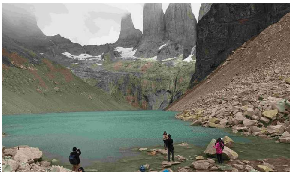
Visitantes Torres del Paine.

● Buscan garantizar la seguridad de los visitantes ante la nueva temporada de invierno.