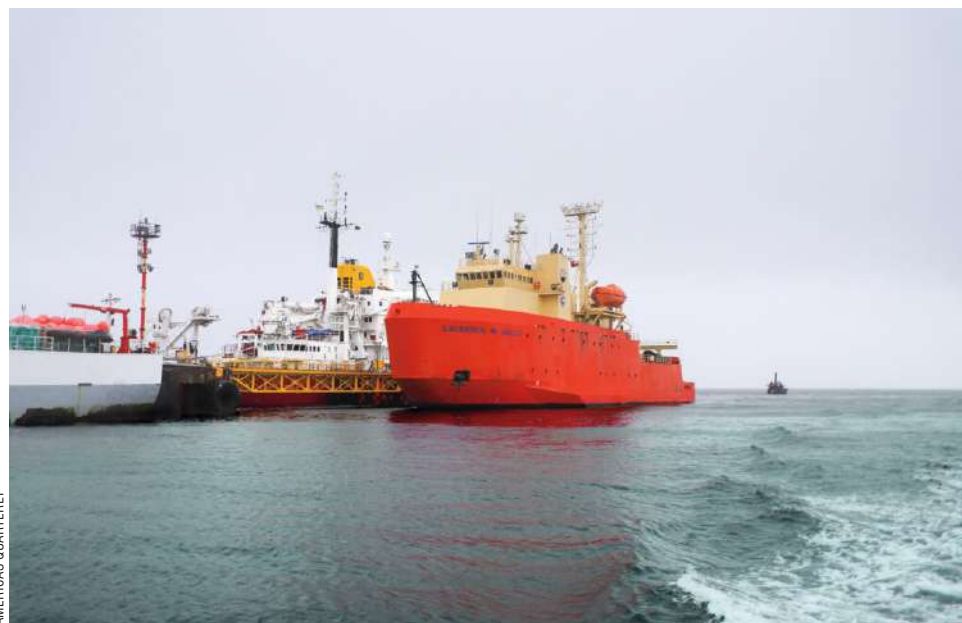
EL ARTÍCULO ADVIERTE LA PRECARIEDAD LOGÍSTICA QUE ENFRENTA MAGALLANES PARA HACER FRENTE A LOS ENORMES RETOS QUE SE VISLUMBRAN.

25% creció el tráfico marítimo en enero y febrero, respecto del año pasado.