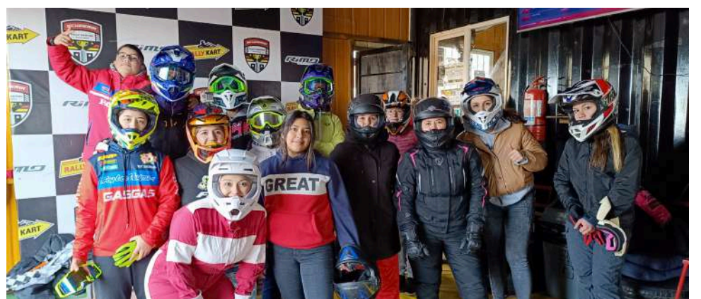
El público tuerca de las motos y otros deportes, asistieron al certamen y disfrutaron con el pasar de los karting.