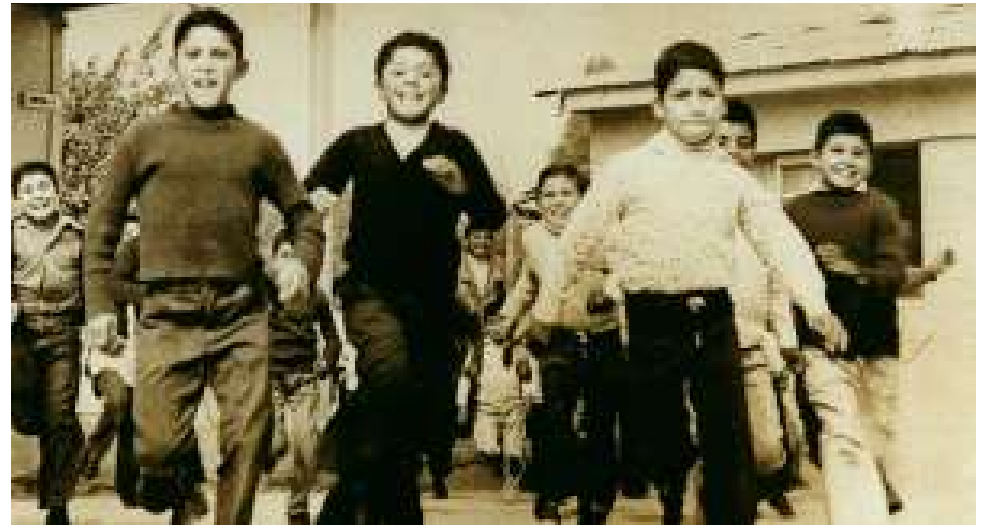
Carabineros de Chile, preocupados desde décadas por la infancia.

La necesidad de trabajar proactivamente ante los variados problemas que afectan a la infancia, en particular a las conductas de riesgo: maltrato y abusos sexuales, entre otros, llevó a crear en agosto de 2009, un Centro de Prevención Ambulatorio