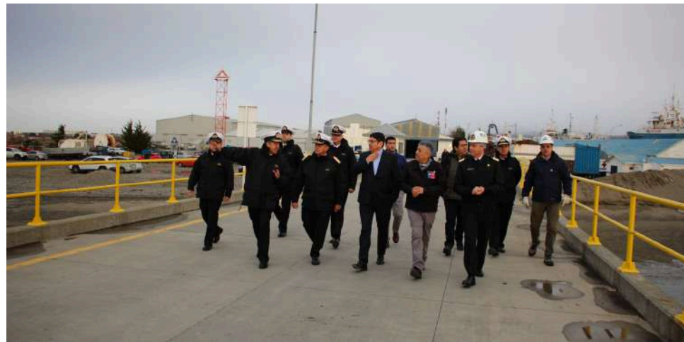
Tercera zona naval