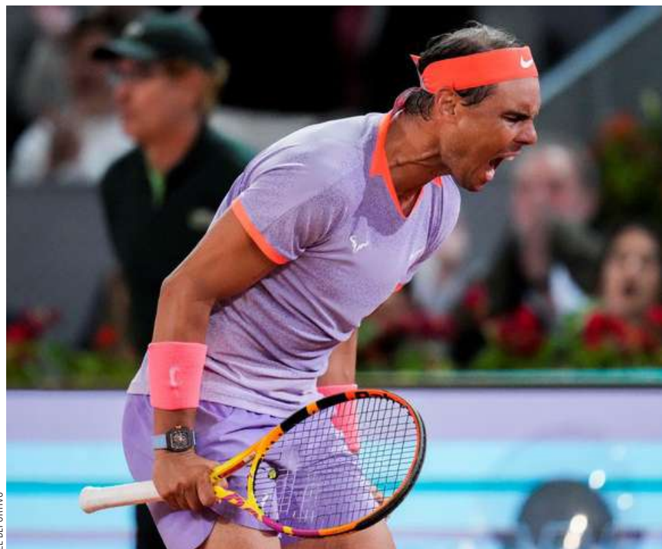
Rafael Nadal festejó ante Álex de Miñaur en Madrid.

En ese sentido, agregó que “para mí ganar dos partidos seguidos ahora es importante. Lo bueno es haber luchado y haberlo hecho bien, paso a paso y vamos a ver cómo me recupero”, concluyó.