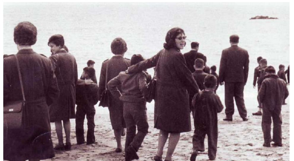
Carabineros de Chile y la infancia.

En 1963 Carabineros de Chile tenía hogares de menores en Santiago, Valparaíso y Concepción, los cuales contaban con el apoyo de la comunidad que donaba bienes y recursos, para financiar esta labor. El 10 de octubre de 1963, mediante Decreto Supremo N° 2.940 del Ministerio de Justicia nace Fundación Niño y Patria: “Entidad privada de beneficencia al servicio del Estado, marcando con ello un hito a nivel institucional debido a la relevancia que alcanzó esta labor en beneficio directo de los niños, niñas y adolescentes más vulnerables de nuestra sociedad”, señala 50 años al cuidado de la infancia, publicación realizada