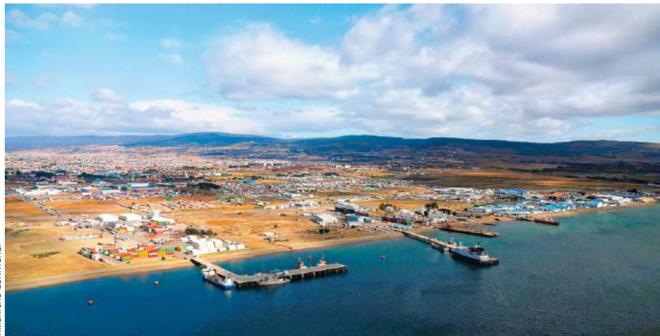
EL PUERTO DE PUNTA ARENAS APARECE DESDE LO ALTO EXPECTANTE ANTE LOS VERTIGINOSOS CAMBIOS QUE SE DIBUJAN EN EL HORIZONTE.

Sin embargo, cuando se abrió el Canal de Panamá en 1914, la economía local se debilitó. Pero Magallanes se aferró a su relativa prosperidad, especialmente tras el descubrimiento de petróleo en la década de 1940. La petrolera nacional Enap sentó las bases de la cultura local durante generaciones. Pero la mayor parte de los hidrocarburos acabaron en Argentina, país con el que Chile estuvo a punto de entrar en guerra en 1978 por la disputa de unas islas en el Cabo de Hornos. A lo largo de la Ruta 255, que bordea el Estrecho, aún pueden verse búnkeres militares y advertencias sobre minas