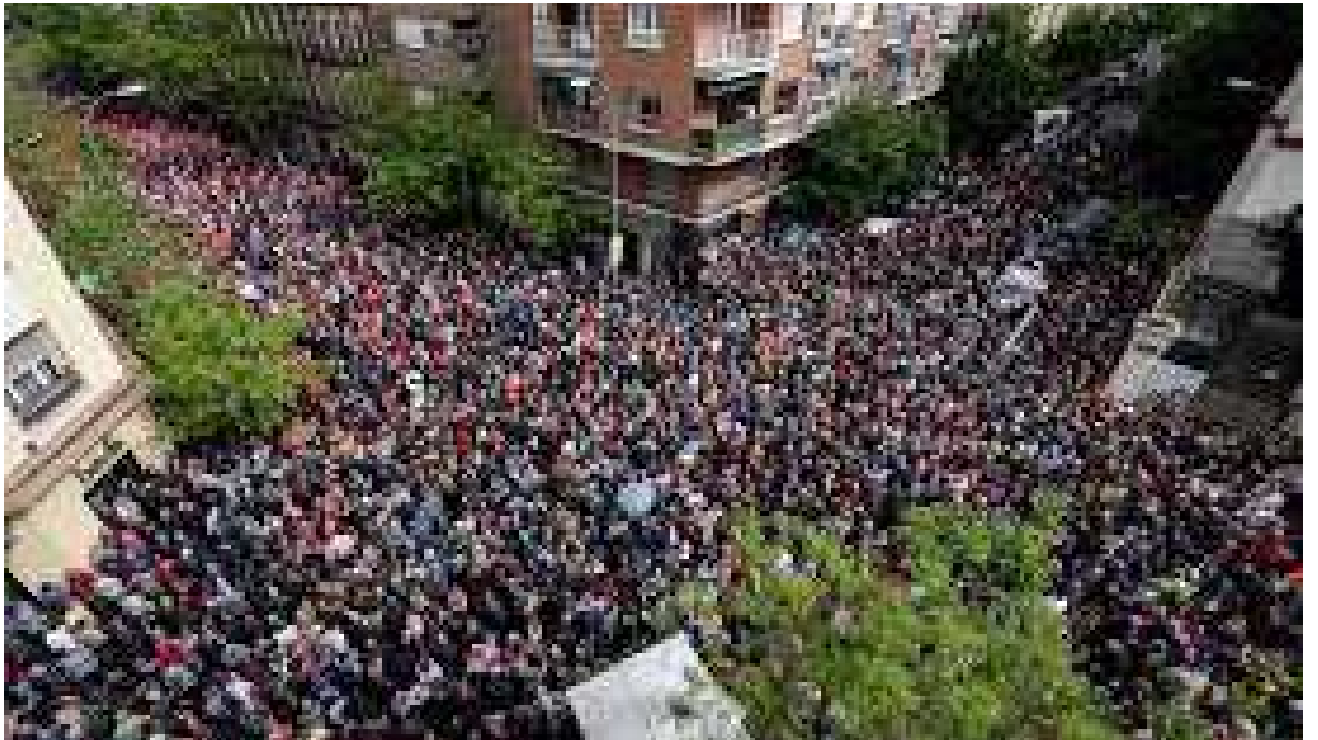
La gente se reunió fuera de la sede del Partido Socialista Obrero Español (PSOE) para mostrar su apoyo a Pedro Sánchez.

En la reunión del órgano socialista, transmitida en abierto de manera inédita, la vicepresidenta del gobierno y ministra de Hacienda y vicesecretaria general del PSOE, María Jesús Montero, le ha pedido a Sánchez que no dimita y ha trasladado el apoyo del partido a su mujer Begoña Gómez a la que se ha intentado “destruir”.