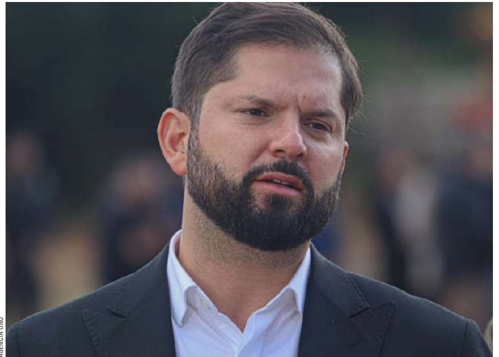
El Presidente Gabriel Boric, llegó hasta el lugar de los hechos en la Región del Bío Bío.

En ese sentido, aclaró que "hoy para poder enfrentar esta situación no tienen