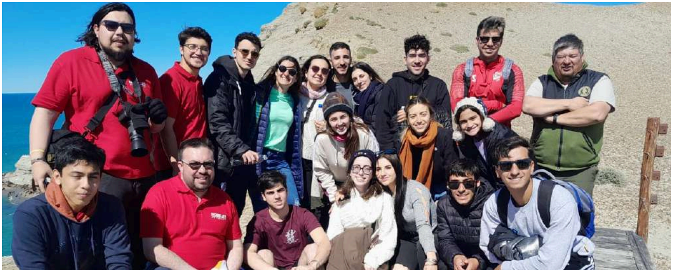
Algunos de los miembros de la ONG, en uno de los encuentros en que participaron.