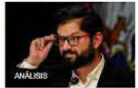
“El peor escenario”. El atentado contra los carabineros expone el

Medios de comunicación de otros países reaccionaron a la muerte de los tres carabineros en el sur de Chile.