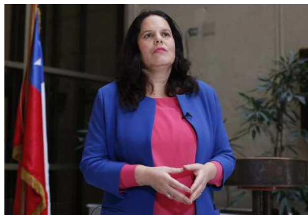
La ministra de defensa, Maya Fernández, dio a conocer el reforzamiento de medidas en materia de seguridad.

En ese sentido, informó que se incrementará “la actividad operativa” en la zona, así como los patrullajes terrestres y aéreos y la “presencia de más vehícu-