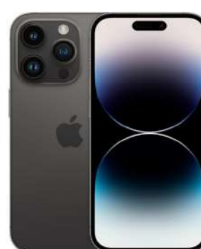
IPHONE 15 PRO