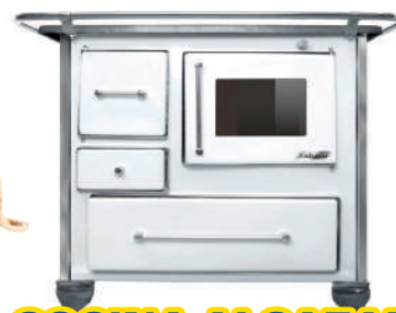
COCINA ALCAZAR MUEBLE