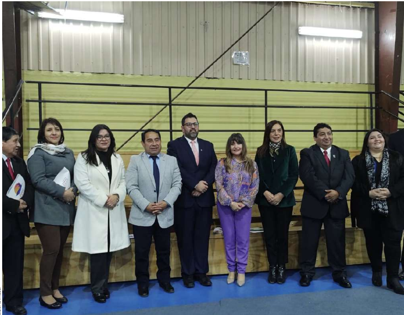
Concejo Municipal de Puerto Natales.

● En tanto, los asistentes reconocieron la labor de la Dirección de Desarrollo Comunitario.