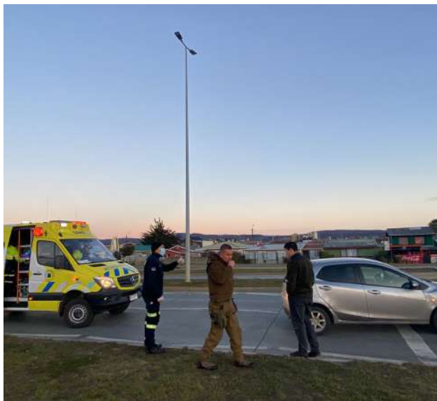
Colisión de dos vehículos menores en Costanera.