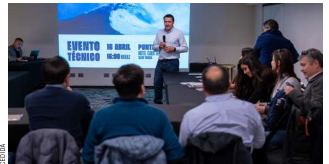
Con éxito se desarrolló el comité de salud de peces en el que participó la Asociación de Salmicultores de Magallanes.

Explicó que, considerando que la reducción en el lapso de engorda ha sido permanente en la región, sería interesante un acercamiento con la autoridad para evaluar un cambio regulatorio que permita disminuir la extensión