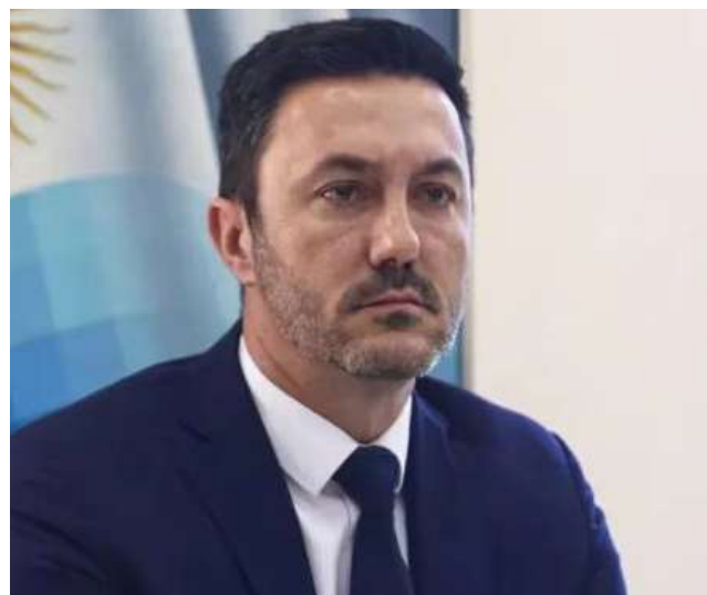
Ministro de defensa argentino, Luis Petri.