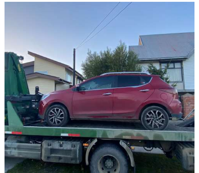
Otro accidente ocurrió en calle Armando Sanhueza.