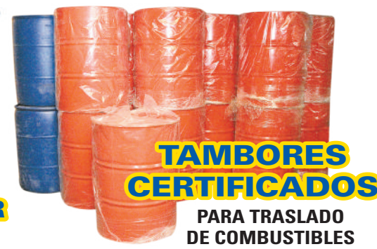
TAMBORES CERTIFICADOS PARA TRASLADO DE COMBUSTIBLES

ZENTENO 99 61 2 216695 +56 9 67596732 Ferreteria San Marcos ferreteria.sanmarcos ferreteria@comercialsanmarcos.cl www.comercialsanmarcos.cl