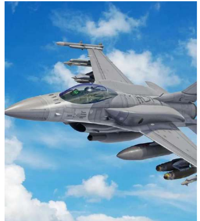
El F-16 lleva dos tanques subalares de 370 galones, que garantizan dos horas y media de autonomía en combate.

Dinamarca ha donado otros 19 ejemplares de las aeronaves F-16 a Ucrania, en guerra con Rusia desde febrero de 2022.