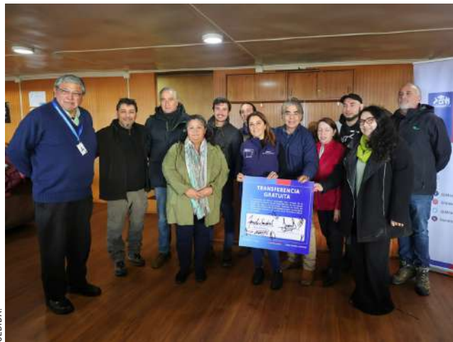
La entrega de las concesiones dio comienzo a la visita de la ministra a Magallanes.