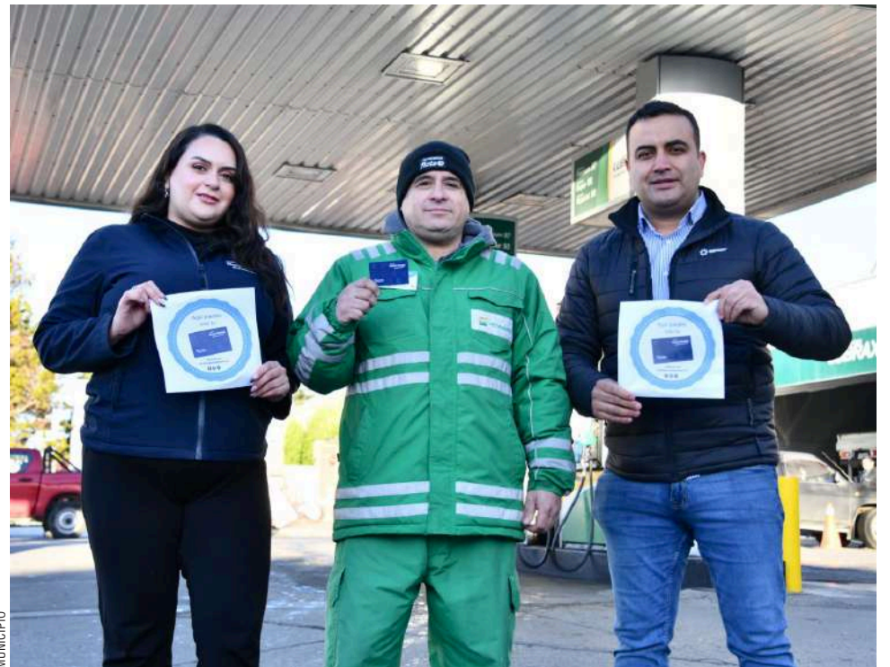
Petrobras de Diagonal Don Bosco entrega un nuevo beneficio con la Tarjeta Punta Arenas.

Las personas interesadas en solicitar la tarjeta, pueden acceder a la página web del municipio, inscribirse en la APP Arenas o ir directamente a la Oficina de Atención al Vecino en Av. Independencia N°840 de 08:00 a 13:00 hrs.