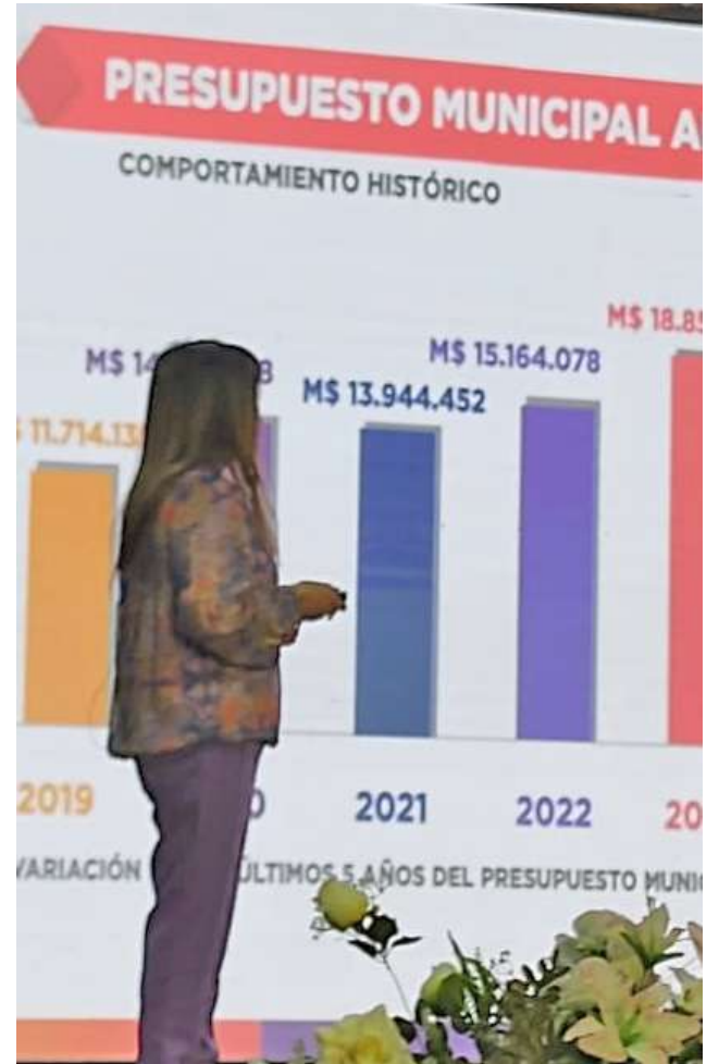
La alcaldesa dio cuenta de la inversión sectorial del municipio.