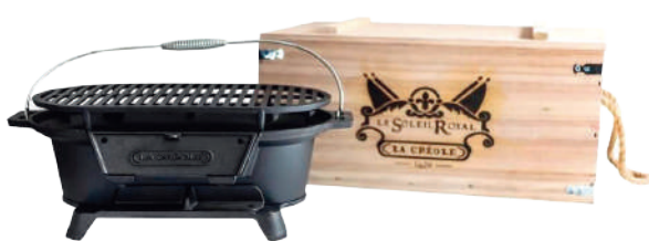
PARRILLA MARCA LA CRÉOLE