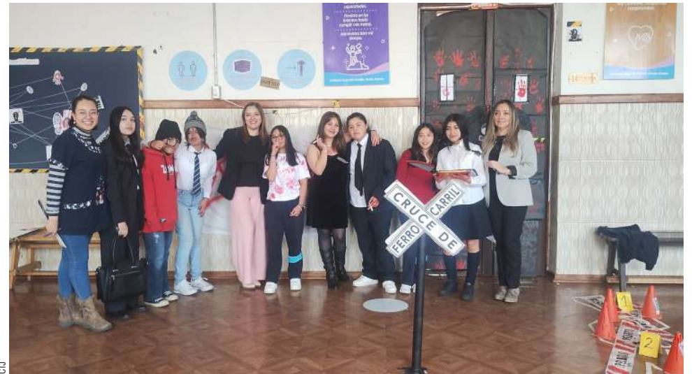
Las estudiantes del “séptimo A” se presentaron con una recreación de los personajes del libro.

Christian Jiménez cjimenez@elpinguino.com