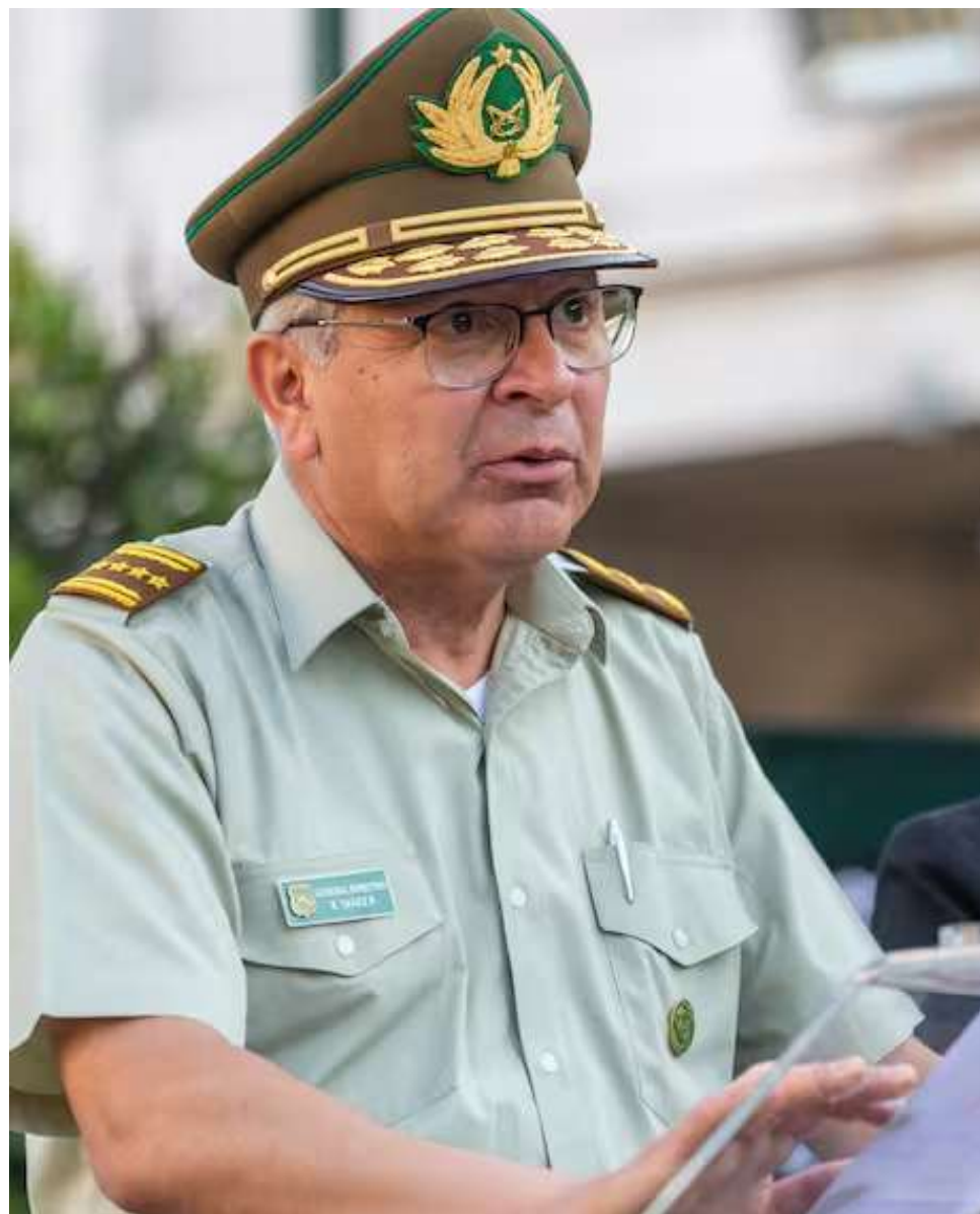
la audiencia -que inicialmente estaba calendarizada para el próximo martes 7 de mayo- tendrá lugar el 1 de octubre a las 9.00 horas.