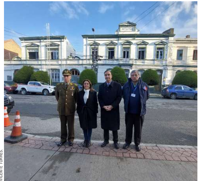
Las autoridades frente a la ex Prefectura de Carabineros.