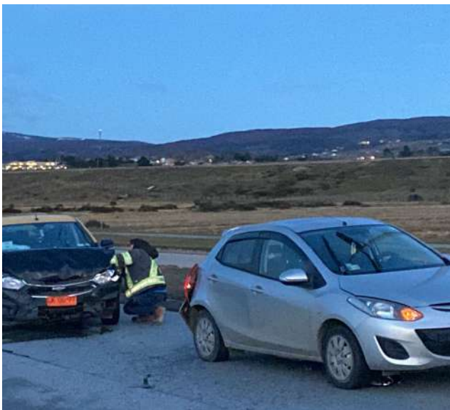
Triple colisión a la altura del humedal.

● Una mañana bastante movida se registró en la capital regional, con Carabineros debiendo efectuar diversos cortes de tránsito ante estas emergencias.