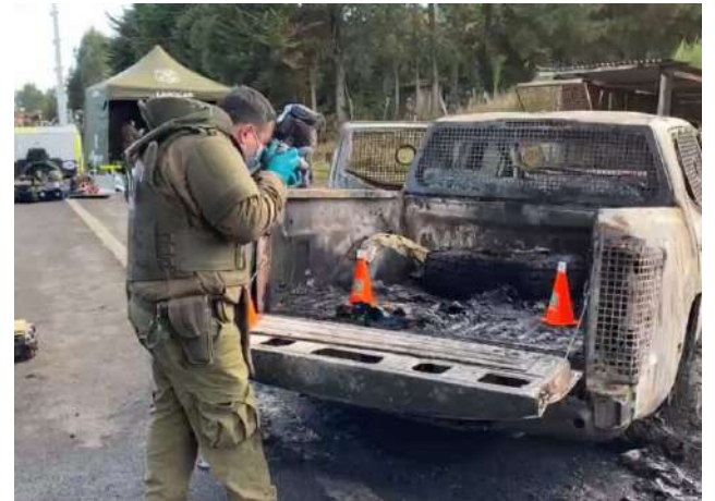
Testigos aseguran haber visto pasar dos vehículos tras la ráfaga de disparos y la quema de la camioneta.

Hasta ahora, no se ha informado públicamente una