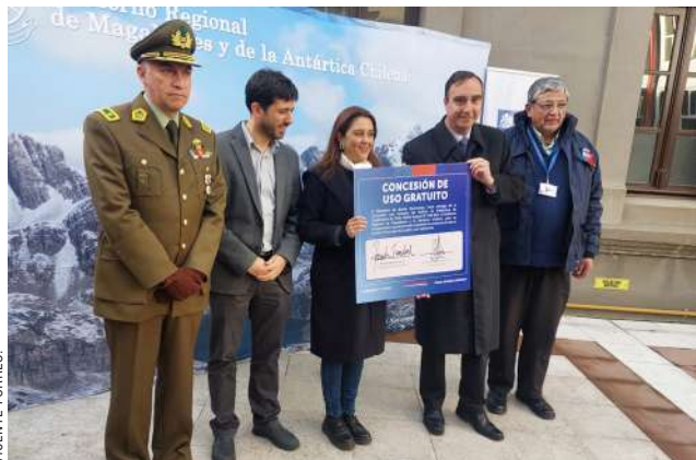
En compañía de Carabineros, tanto el gobernador Flies como la ministra efectuaron el traspaso del inmueble.

Además, anunció la pronta construcción de la nueva Primera Comisaría, lo cual estará complementado con un nuevo edificio zonal más la nueva Prefectura, lo que generará un nuevo complejo de Carabineros en calle Ignacio Carrera Pinto.