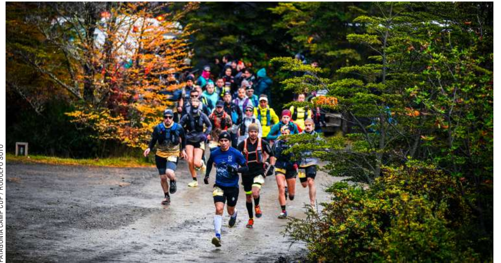
PATAGONIA CAMP CUP

Después de cruzar la línea de meta, los corredores fueron recibidos con aplausos, cerrando una jornada inolvidable con la fiesta de premiación, evento que contó con la presencia del grupo de música folclórica de Puerto Natales, Coirón, y donde los participantes y acompañantes disfrutaron de una exquisita cena buffet preparada por el hotel.