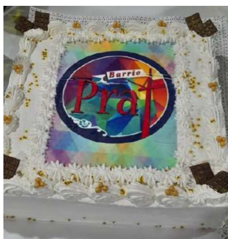
Lanzamiento del Logo corporativo de la Asociación de Comerciantes del Barrio Prat, realizada en la Escuela Arturo Prat.