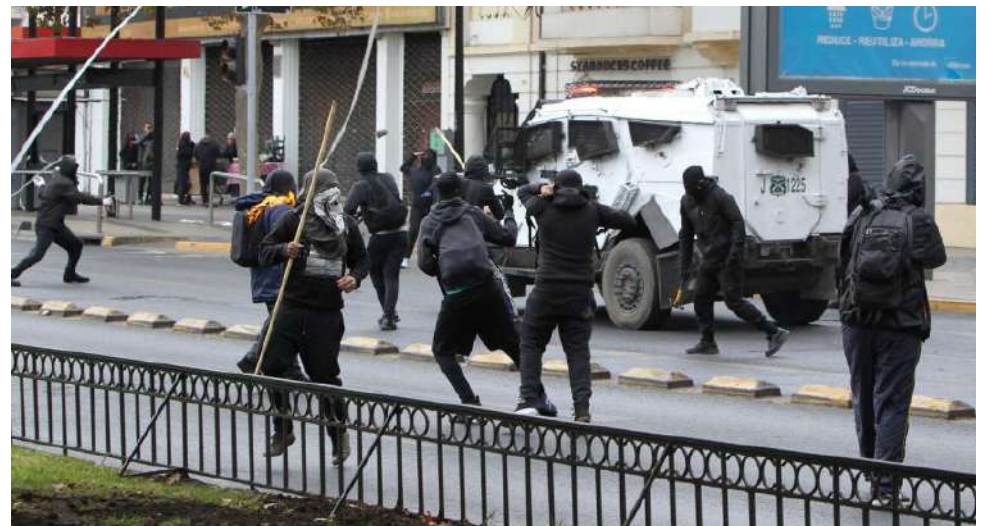
La movilización de la CCT no está relacionada con la marcha de la Central Unitaria de Trabajadores (CUT), la cual se desarrolló de forma pacífica.

Minutos más tarde, los individuos llegaron hasta el frontis de la Estación Central y lanzaron objetos contundentes e incendiarios hacia el terminal ferroviario.