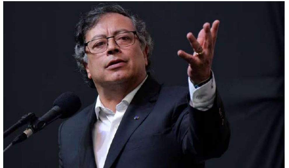
El Presidente de Colombia, Gustavo Petro, ya había anunciado en oportunidades anteriores que su país rompería relaciones con Israel.

“El presidente de Colombia prometió premiar a los asesinos y violadores de Hamás, y hoy cumplió su promesa. La Historia recordará que Gustavo Petro decidió ponerse del lado de los monstruos