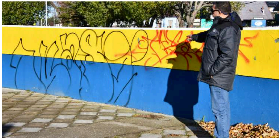
Diversas plazas de la ciudad han sido dañadas en los primeros cuatro meses del año.