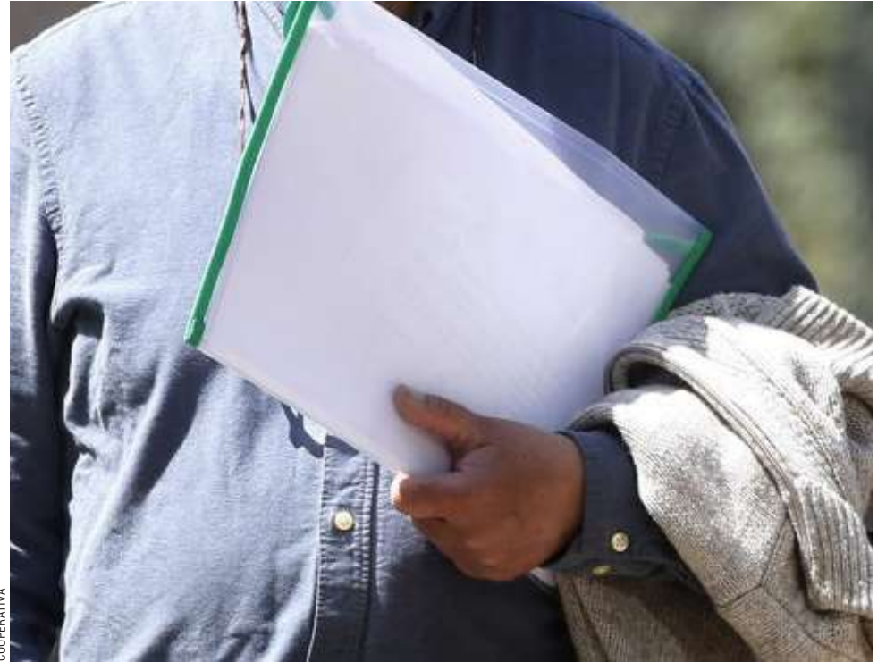
Según los datos, la región cuenta con un total de 7.130 personas desocupadas.

De esta manera, el economista realizó un llamado de preocupación, entendiéndose que en la región la cantidad de empleos no se ha incrementado en la misma proporción que los trabajadores. “Esto requiere medidas concretas, entre ellas la necesidad de inversión regional por parte de Gobierno Regional y la revisión urgente de las leyes de excepción para traer inversión a nuestra región; esto último es un compromiso por parte del presidente Boric y los servicios regionales y encargados no han logrado realizar los esfuerzos suficientes para la revisión de dichas excepciones,