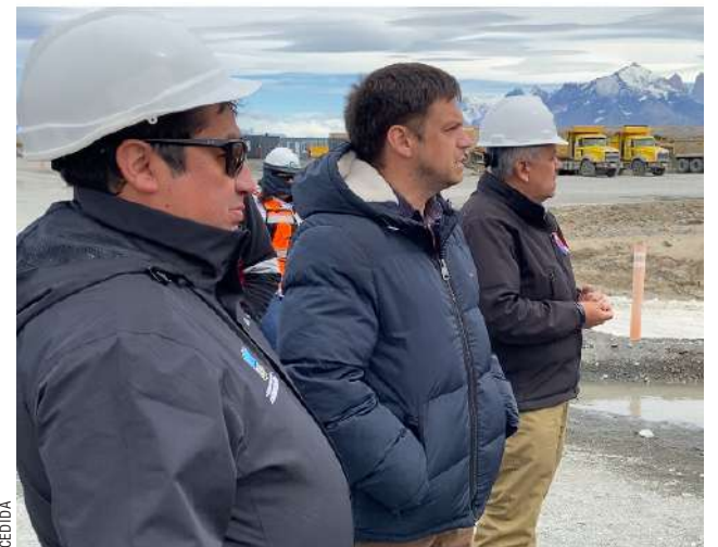
El seremi de Gobierno, Andro Mimica, se refirió a las últimas cifras económicas.

“Queremos invitar a todos los actores a trabajar en conjunto, poniendo sus capacidades para aumentar la productividad. Es necesario el esfuerzo del sector empresarial de incorporar en sus procesos tecnología e innovación. Estamos mandatados a que el 2024 sea el año del crecimiento y nos encontra-