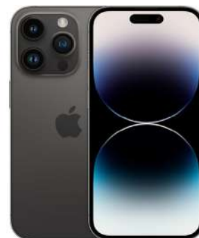
IPHONE 15 PRO