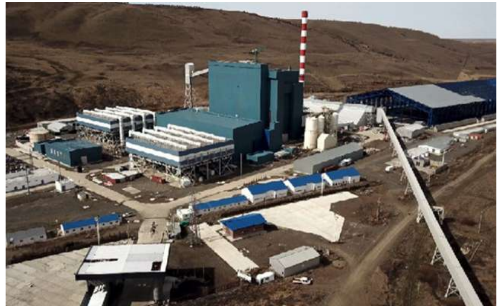
YCRT, la empresa que quiere privatizar Milei, pero que Santa Cruz pretende retener.

Ahora, la ley pasará al Senado de la Nación “y serán ellos quienes tienen la responsabilidad de legislar de cara al pueblo. Desde ATE como lo hicimos siempre sostenemos nuestra postura histórica, no a la Privatización, defensa de todos los puestos de traba-