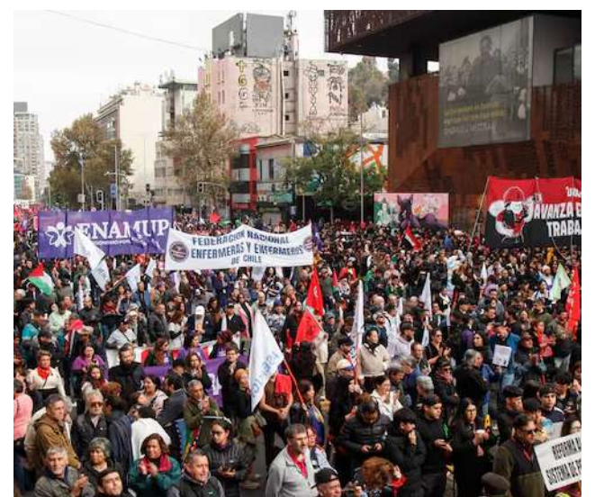
Los trabajadores plantearon que “500 mil pesos era una meta, pero era una meta que viene hace 7 años”.

El ministro de la Segpres, Álvaro Elizalde -quien participó en la movilización al igual que el ministro de Vivienda, Carlos Montes- también fue consultado sobre el tema y aseveró que “es importante promover el diálogo con todos los actores”. También resaltó “esfuerzos importantes en lo que va del Gobierno”. En esa línea, mencionó el próximo aumento del salario mínimo