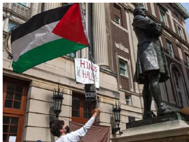
Las autoridades denunciaron que la mayoría de los manifestantes no eran estudiantes

Cell señaló que las autoridades se encuentran actualmente tratando de determinar qué porcentaje de manifestantes son estudiantes y cuál es su vínculo exacto con estas universidades.