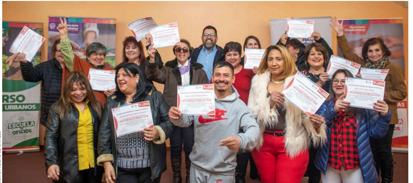
Con éxito finalizó la Escuela de Oficios desarrollada por la Municipalidad de Natales con fondos del Gobierno Regional.