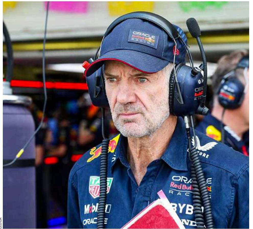
El inglés Adrian Newey, director técnico de Oracle Red Bull Racing y miembro de la compañía desde 2006.

La llegada de Honda como socio de la unidad de potencia del equipo en 2019 reavivó la chispa competitiva de Adrian Newey. El RB16B consiguió su primer campeonato en ocho años en 2021. Un amplio cambio de reglamento para la temporada siguiente dio como resultado otro diseño, el RB18, lo que llevó a una nueva era de dominio que comenzó en 2022 y continúa hasta el momento.