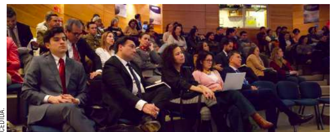
Integrantes del Poder Judicial y estudiantes de la carrera de Derecho analizaron el impacto de la inteligencia artificial en el ámbito judicial.

Por su parte, la directora nacional de la Asociación Nacional de Magistradas y Magistrados, Susan Sepúlveda, enfatizó la importancia de actividades como éstas para capacitar a jueces y juezas en la transformación digital del Poder Judicial, con el objetivo de mejorar el acceso a la justicia a través de la tecnología y las comunicaciones.