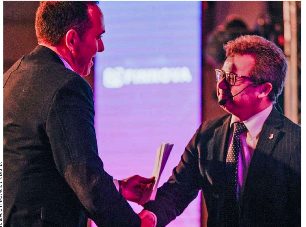
García fue uno de los expositores del evento que contó con destacados expertos latinoamericanos.

“Este congreso fue histórico para la provincia, no solo por el número de participantes sino por el nivel de discusión y comparación internacional sobre los regímenes de promoción”, destacó la organización. “Fue una oportunidad para profundizar en la comprensión y defensa de la ley 19.640, y compararla con modelos internacionales exitosos”.