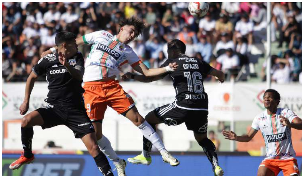
Colo Colo sólo logró empatar en el duelo contra Cobresal en Antofagasta.

Por contraparte, la visita corta una racha de dos triunfos consecutivos en la competencia local, y suma 17 unidades. Con esto, se mantiene a 7 unidades del puntero, Universidad de Chile, que jugará este