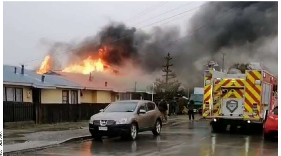
El fuego se dejó ver desde distintos sectores de Porvenir, al igual que la densa columna de humo.

Luego de varios minutos de trabajo, los voluntarios de Bomberos pudieron contener el fuego, evidenciando el daño de los tres inmuebles y una gomería, que funcionaba hace años, siendo esta última la que más trabajo demandó para sofocar las llamas, debi-