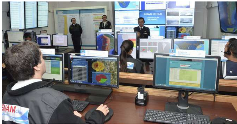
Sala de control sistema nacional de alarma de maremotos en el SHOA.

S in lugar a dudas, el Servicio Hidrográfico y Oceanográfico de la Armada, SHOA, hoy es percibido como una de las organizaciones institucionales que en mejor forma ha logrado capitalizar las experiencias obtenidas en los últimos años. Cambios organizacionales y modernización de equipamientos, se han traducido en el aumento significativo de sus capacidades destinadas a optimizar sus tradicionales servicios en los ámbitos nacional e internacional.