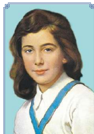
Agradezco a Santa Laurita Vicuña por favor concedido