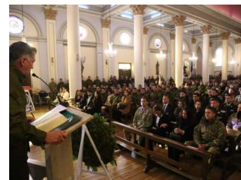
EN LA CATEDRAL SE CELEBRÓ LA EUCARISTÍA CON LA PRESENCIA DE TODAS LAS AUTORIDADES REGIONALES Y CON GRAN CANTIDAD DE PERSONAS QUE SE UNIERON EN LA ORACIÓN POR LOS CARABINEROS.