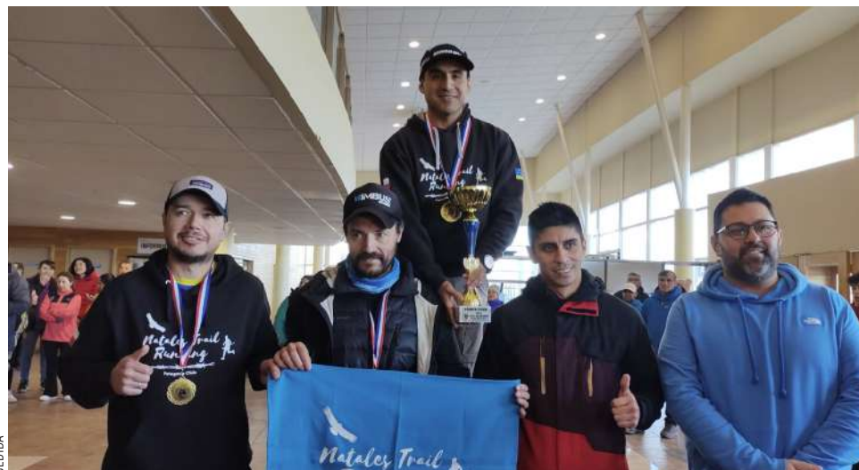
Los participantes una vez finalizada la actividad fueron parte de la premiación.

En esta ocasión, los atletas adultos participaron formando equipos de cuatro personas, que recorrieron el tramo desde la Curva del Bucanero hasta la Cueva del Milodón completando así 21.5 kilómetros. En tanto, los escolares participantes realizaron un trayecto desde la Cueva Chica hasta la Cueva Grande consistente en 2.9 kilómetros.