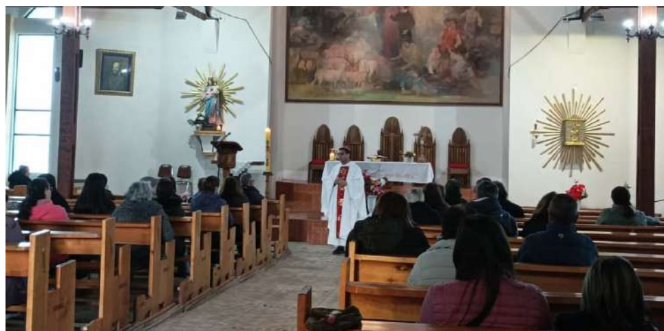
EL OBISPO ÓSCAR CELEBRÓ LA EUCARISTÍA EN PORVENIR.

Señor: la ofrenda de la propia vida en servicio a los demás.