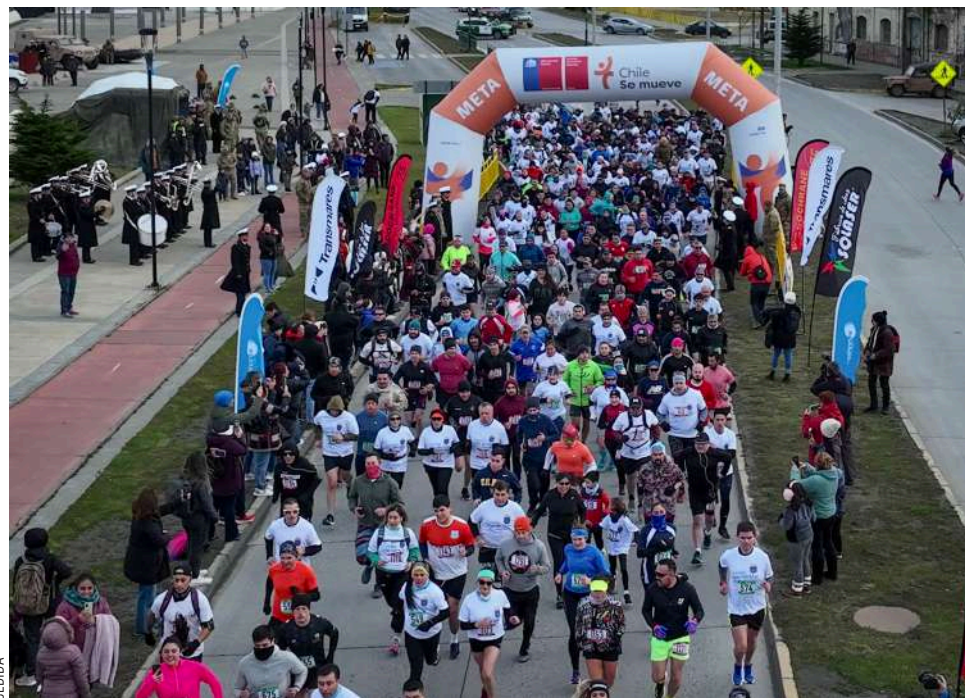
Con una gran cantidad de participantes se desarrolló una nueva corrida del Mes del Mar.