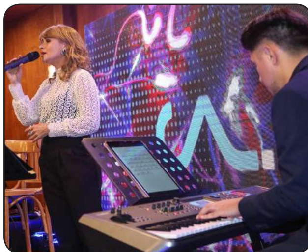
La actriz y cantante Amaya Forch amenizó la jornada con su música en Llanura de Dianas.