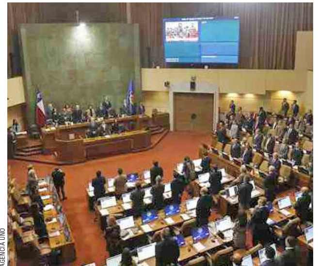
El proyecto de ley pasa ahora al Senado, en donde deberá ser discutido.

Por otro lado, el proyecto establece que el personal afecto a esta norma deberá contar con formación y capacitaciones adecuadas. Esto para hacer uso de la fuerza