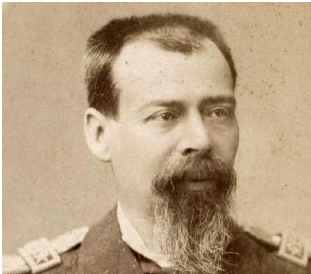
Francisco Vidal Gormaz, primer director del SHOA.

También podemos mencionar la biblioteca técnica del SHOA, abierta a los estudiantes de las materias afines a su quehacer; y el laboratorio químico, como ente técnico esencial en materias de contaminación marina.