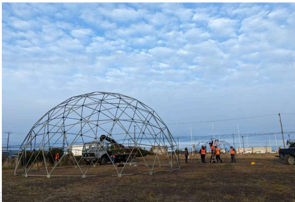
Ya se comenzó a preparar los domos en el Instituto de la Patagonia.

Una parte del Campamento Biocultural está organizado a modo de feria científica, en el que se presentarán los once proyectos financiados actualmente por el instrumento. Se trata de proyectos compuestos por funcionarios o estudiantes de la Umag que, en conjunto con un socio comunitario – asociación, junta de vecino, etc.- construyeron un plan de acción para la valorización de los patrimonios bioculturales de la región.