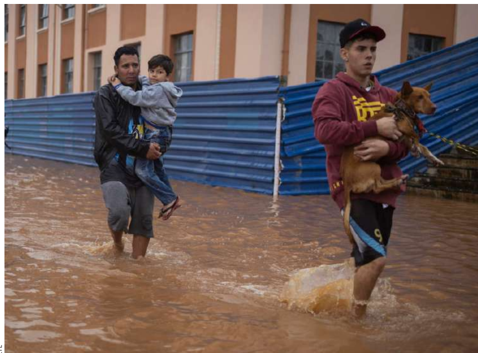
Los desbordos de los cauces de agua y deslizamientos de tierra mantienen interrumpidas numerosas carreteras en el estado de Río Grande do Sul.

El gobernador de Río Grande do Sul, Eduardo Leite, dijo el sábado en una transmisión en vivo por Instagram que se trataba de una situación “dramática” y “absolutamente sin precedentes”. En tanto, el alcalde de Porto Alegre, Sebastiao Melo, informó que “ pese al gran esfuerzo de contención”, un dique en otro río que surca la ciudad, el Gravataí, empezó a desbordarse.