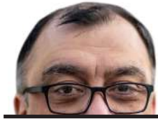
César Cifuentes presidente regional PRI

La Región de Magallanes enfrenta una escalofriante escalada en el narcotráfico, como lo revela el reciente informe sobre tráfico de drogas en la zona. Este análisis actualizado muestra un inquietante aumento del 800% en las incautaciones de dinero y bienes relacionados con actividades ilícitas en la región, un dato que enciende las alarmas tanto entre la ciudadanía como entre las autoridades.