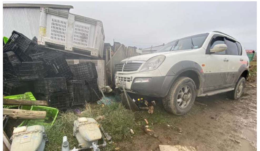
El vehículo fue retirado de circulación por personal policial, siendo enviado a maestranza.

Carabineros retiró el vehículo de circulación y los antecedentes serán entregados al juzgado respectivo.