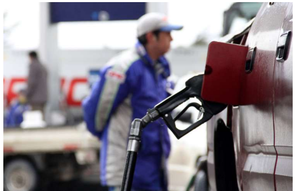
LAS ALZAS DE COMBUSTIBLES SIGUEN GOLPEANDO A LA POBLACIÓN REGIONAL.

del gobierno de bajar el precio de los combustibles, bastaría con disminuir ese impuesto que, teóricamente, era transitorio”.